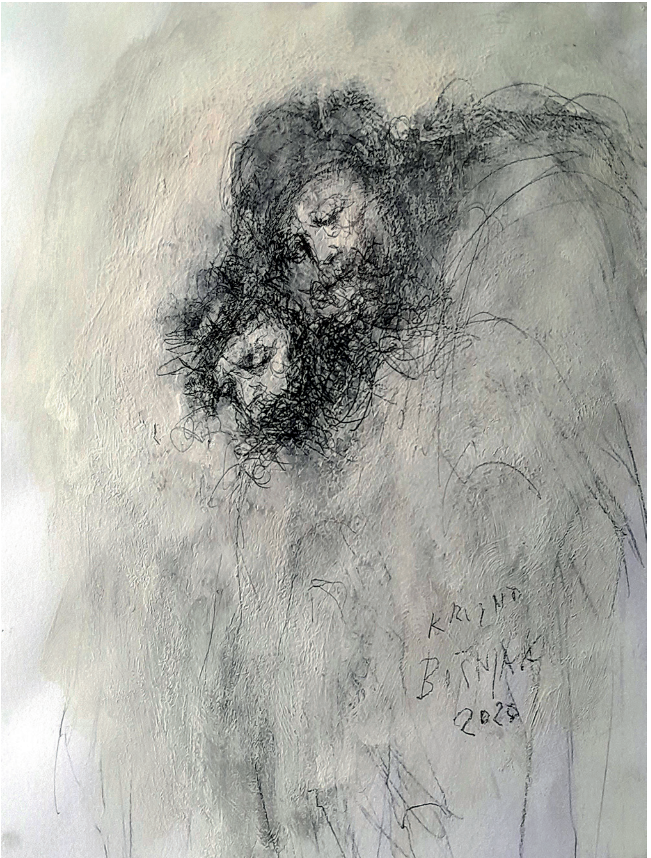
Isus 12., 2020., crtež na papiru, 57 × 38 cm