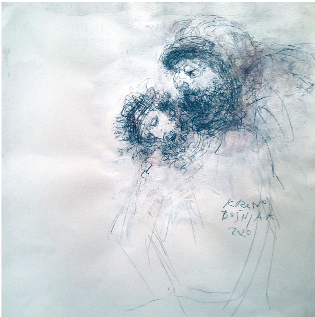
Pieta 3., 2020., crtež na papiru, 37×57 cm