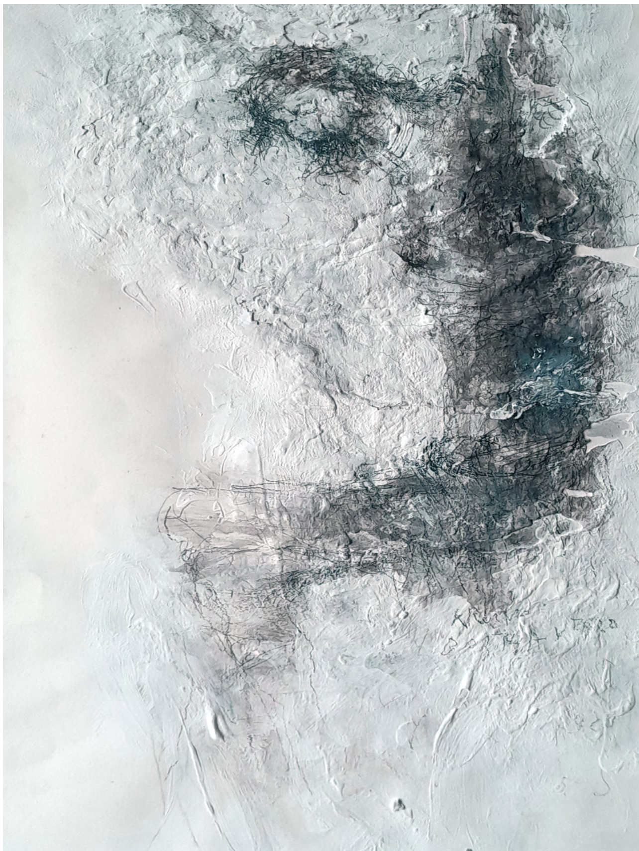
Isus 2., 2020., crtež na papiru, 53 × 39 cm