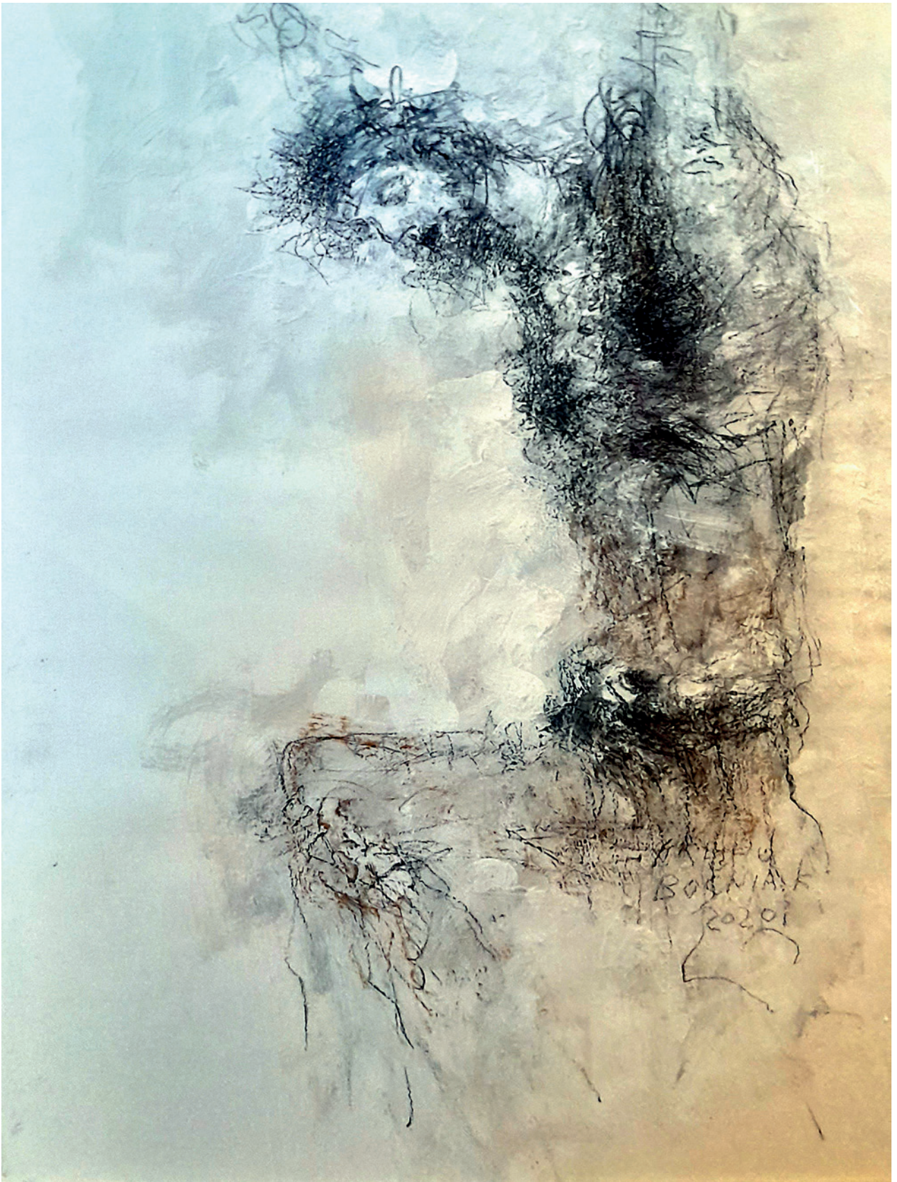
Isus 3., 2020., crtež na papiru, 53 × 39 cm