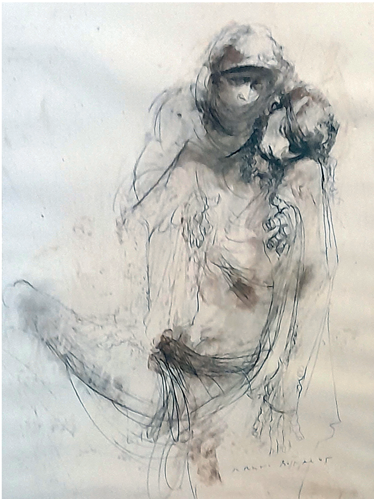
Pieta 2., 2020., crtež na papiru, 53 × 39 cm