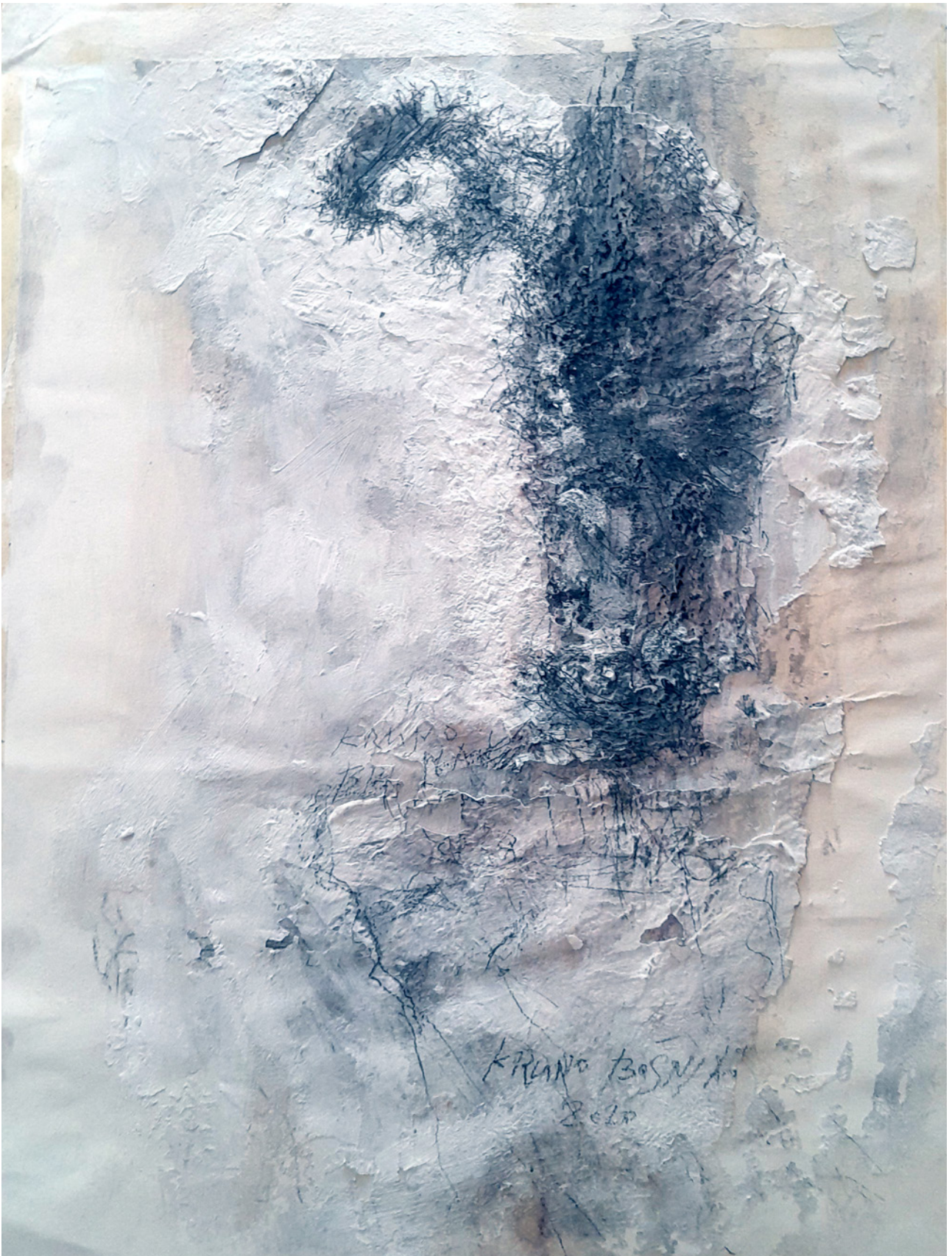
Isus 5., 2020., crtež na papiru, 57 × 32 cm