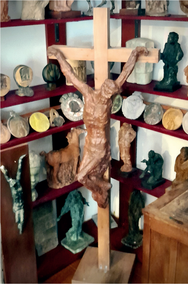
Atelje Krune Bošnjaka