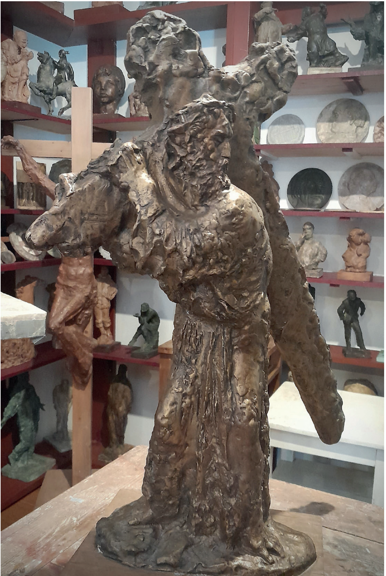
Atelje Krune Bošnjaka