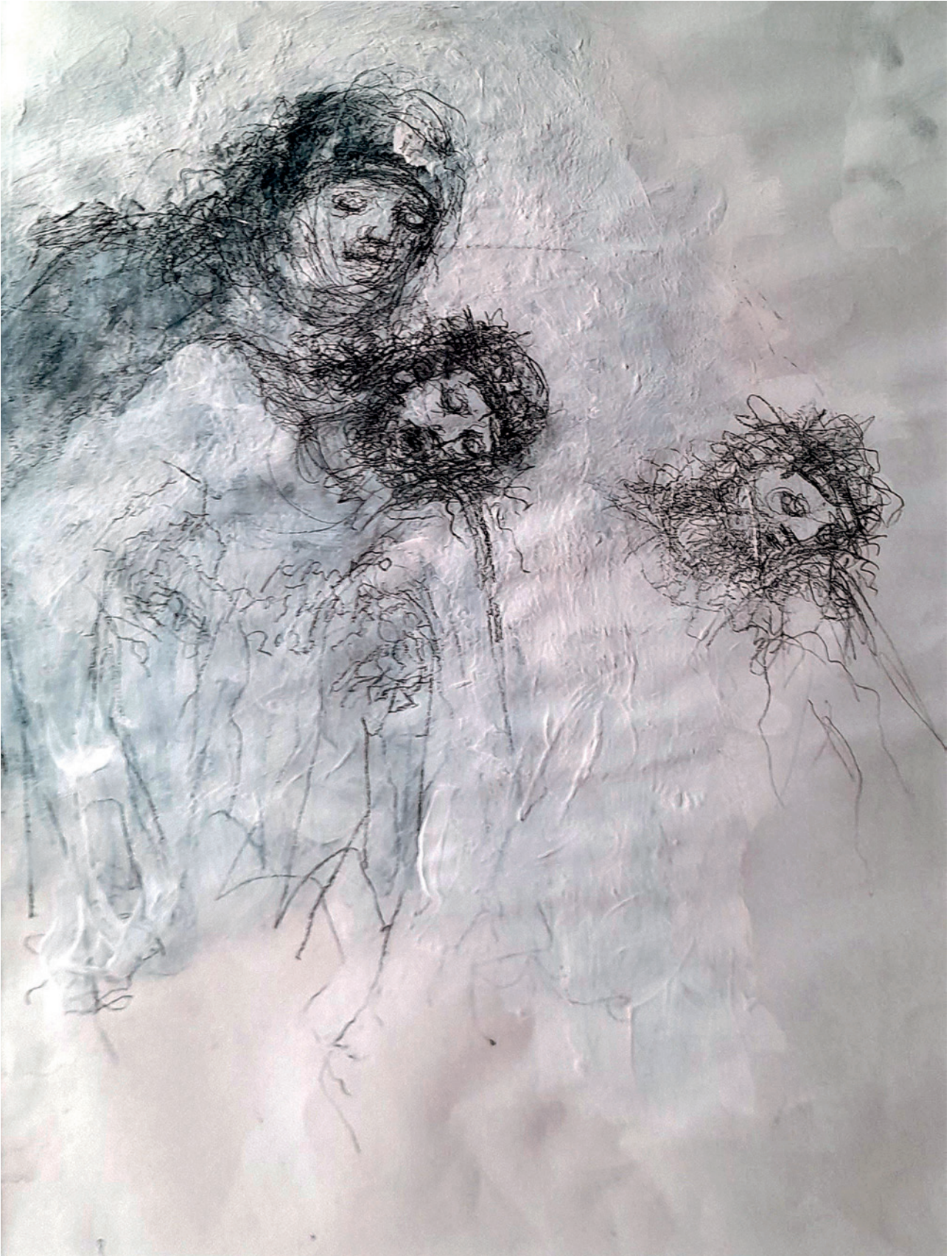
Pieta 1., 2020., crtež na papiru, 53 × 39 cm