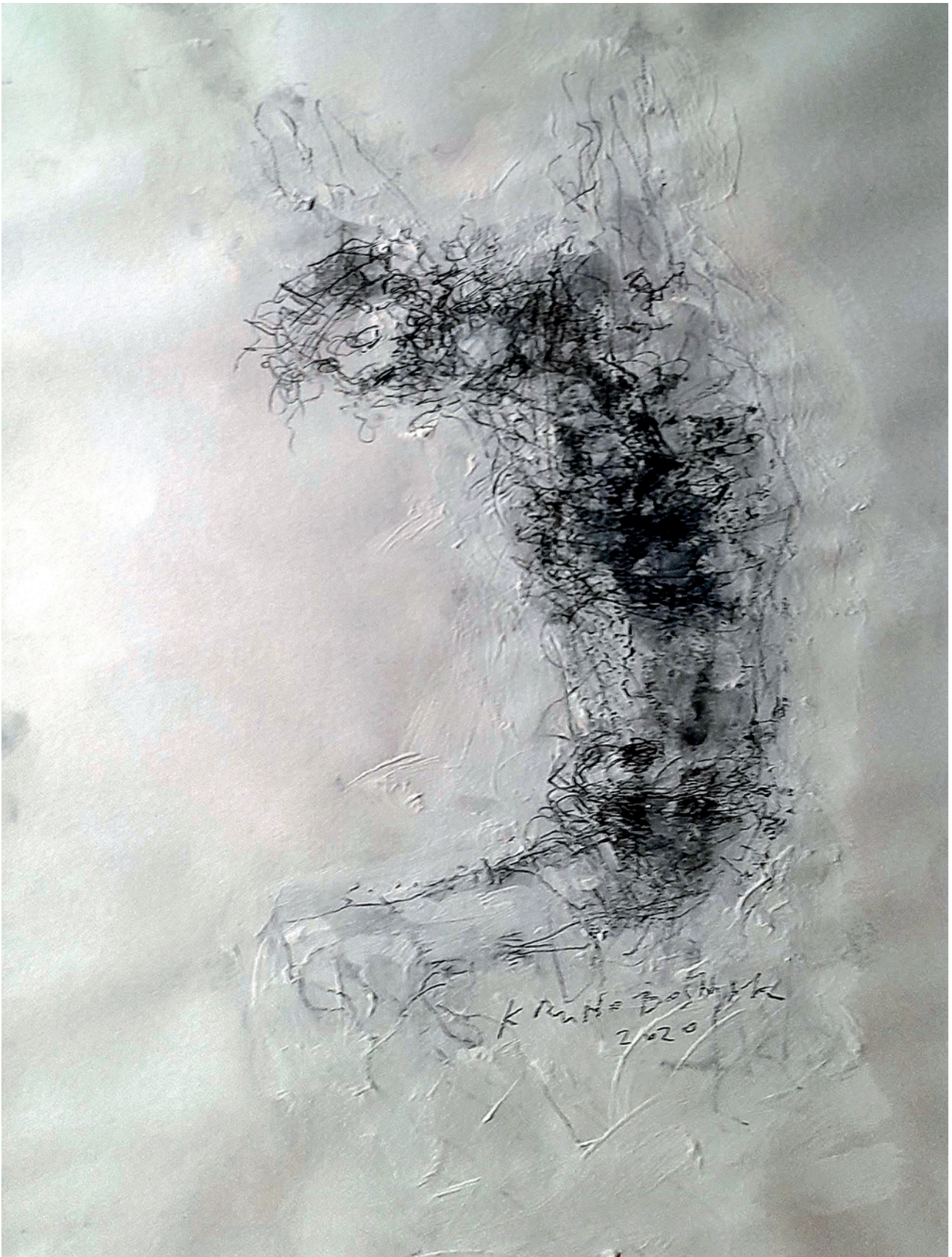
Isus 4., 2020., crtež na papiru, 53 × 39 cm