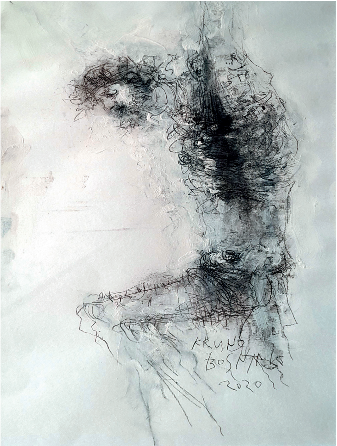
Isus 7., 2020., crtež na papiru, 57 × 32 cm