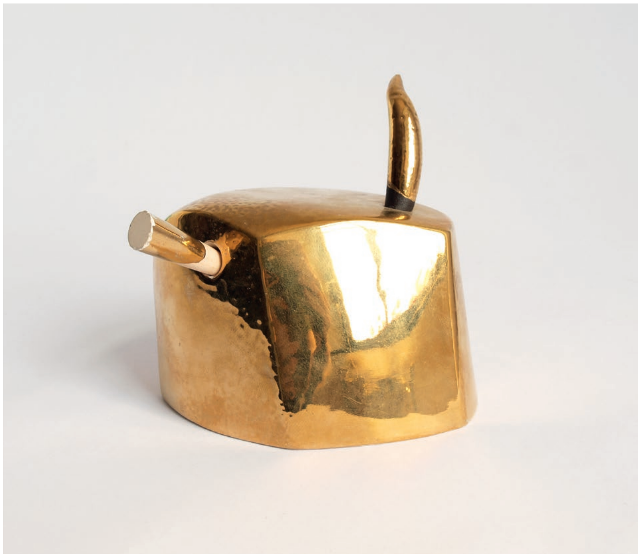
Robert Baća – "Glava", 1995. pozlaćena terakota, 9 × 15 × 13 cm, LZ-67