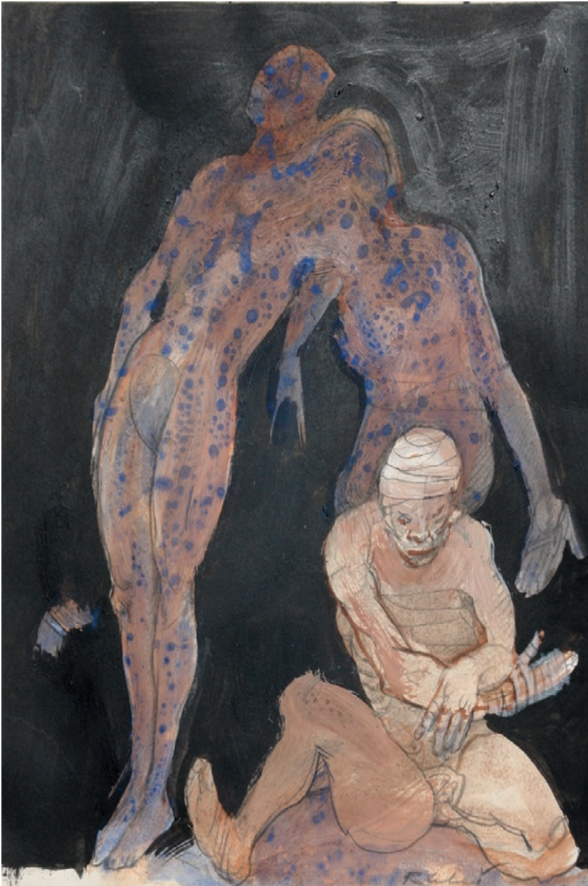
Rudolf Labaš – "Migrena", 2018. akril i olovka na papiru, 37,5 × 30 cm

Danas je međutim korisno prisjetiti se i propusta ili pogrešaka koje u početku rada nije bilo moguće izbjeći. Nekoliko posljednjih godina karakterizira bolja selekcija autorskih i skupnih izložbi, a ponajviše bolja i sadržajnija izvedba tiskanih i propagandnih materijala te medijska popraćenost. Na tome je posebno uspješno radila sadašnja ravnateljica Muzeja Prigorja Morena Želja Želle.