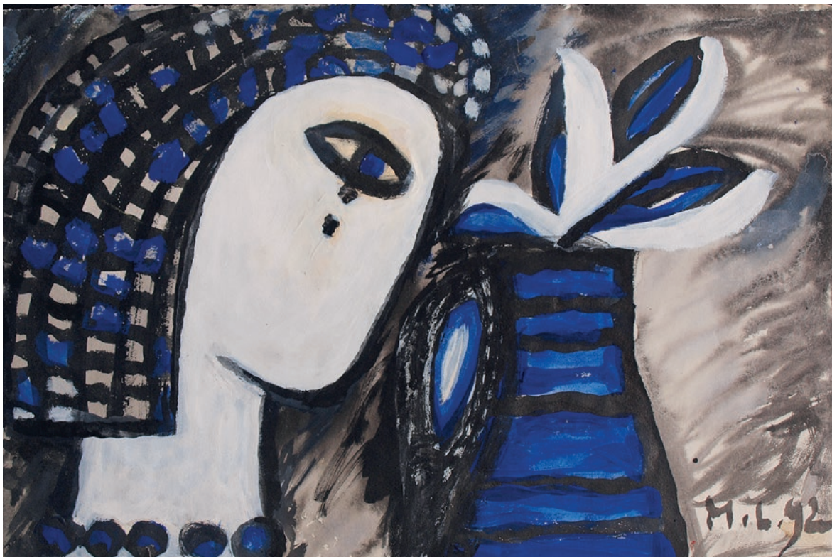
Milena Lah – "Dubrovkinja III", 1992. kombinirana tehnika, papir, 28,4 x 42,7 cm, LZ-89