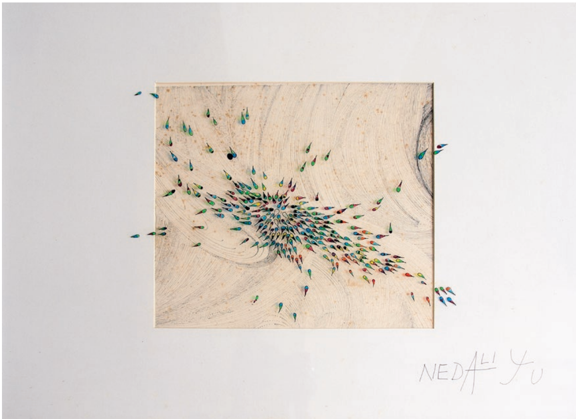
Neda Grdinić – "U oku", 1980. serigrafija, kombinirana tehnika, 48 x 64 cm, MPS-6109