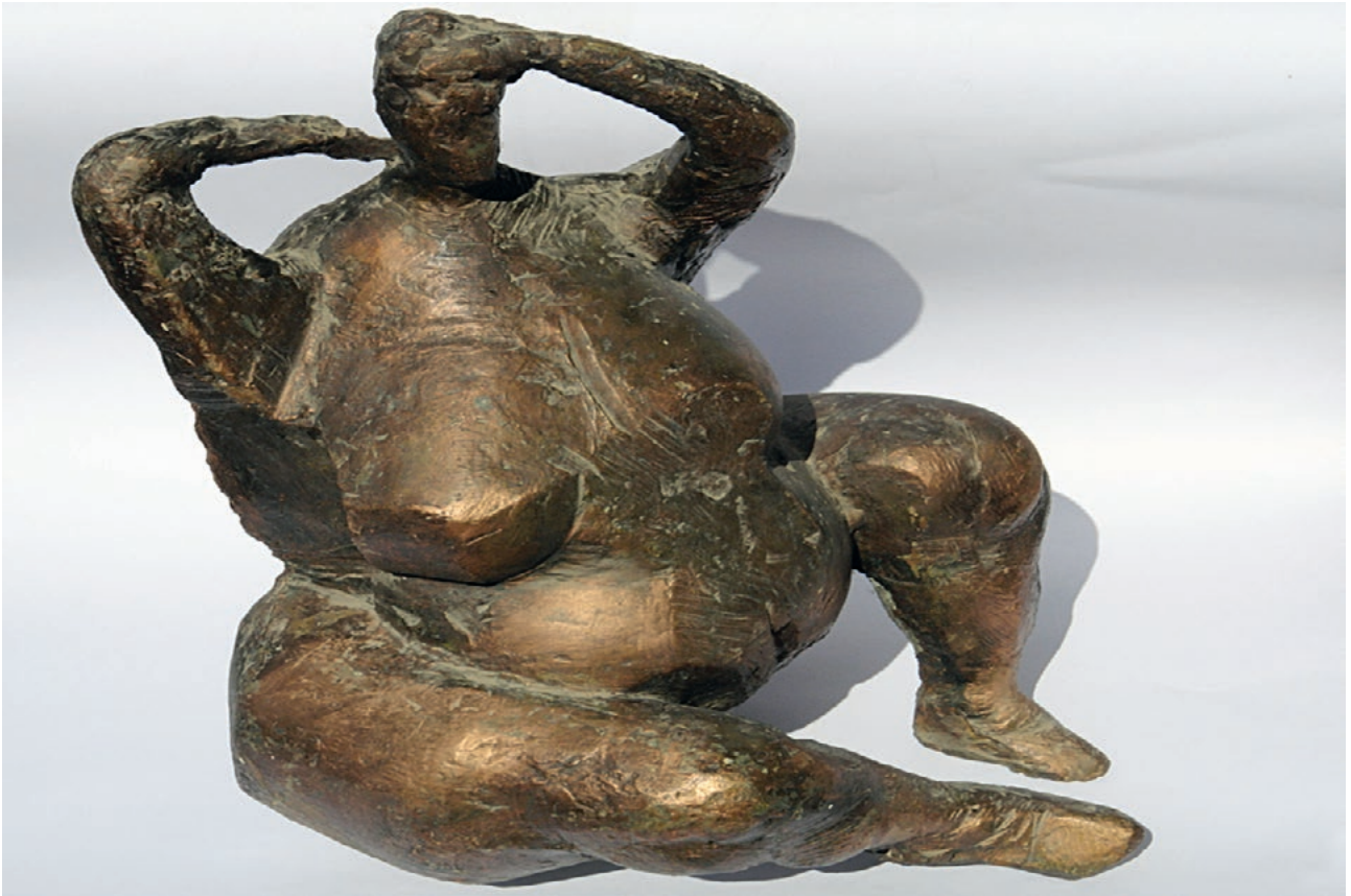
Branko Kelčec – "Teta Zora", 1975. patinirani gips, 54 x 42 x 38 cm

stoga pozdraviti sredinu gdje izvorne težnje, uzdignute umjetnošću bivaju jače i suptilnije. Sloboda nije rezultat izoliranosti već uzajamnosti, ne ekskluzivnosti već povezanosti. Smijemo li spram ove ili neke druge pojave izraziti samo svoje prihvaćanje ili odbijanje ili ono najgore, slegnuti ramenima. To bi se moglo tolerirati samo onda kada bi se radilo o sasvim privatnom posjedu. Stvaralaštvo je događanje u kojem sudjeluju svi, katkad razdijeljeno na autore i publiku, no uvijek nedjeljivo povezano s cjelokupnim životom. Stvaralac okušava sve ono moguće ili nemoguće, tek naslućeno ili u klici. On razlistava ljudsku psihu kako bi čovjek pomoću umjetnosti mogao bolje shvatiti drugog čovjeka u svim njegovim patnjama i veselju, nedoumicima i čežnji.