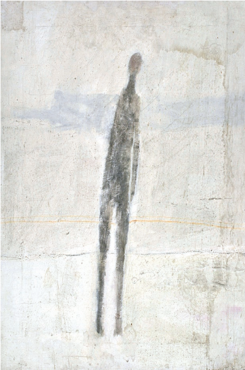
Miroslav Usenik – "Nagnuti akt", 1969. ulje na platnu, 77 × 64 cm