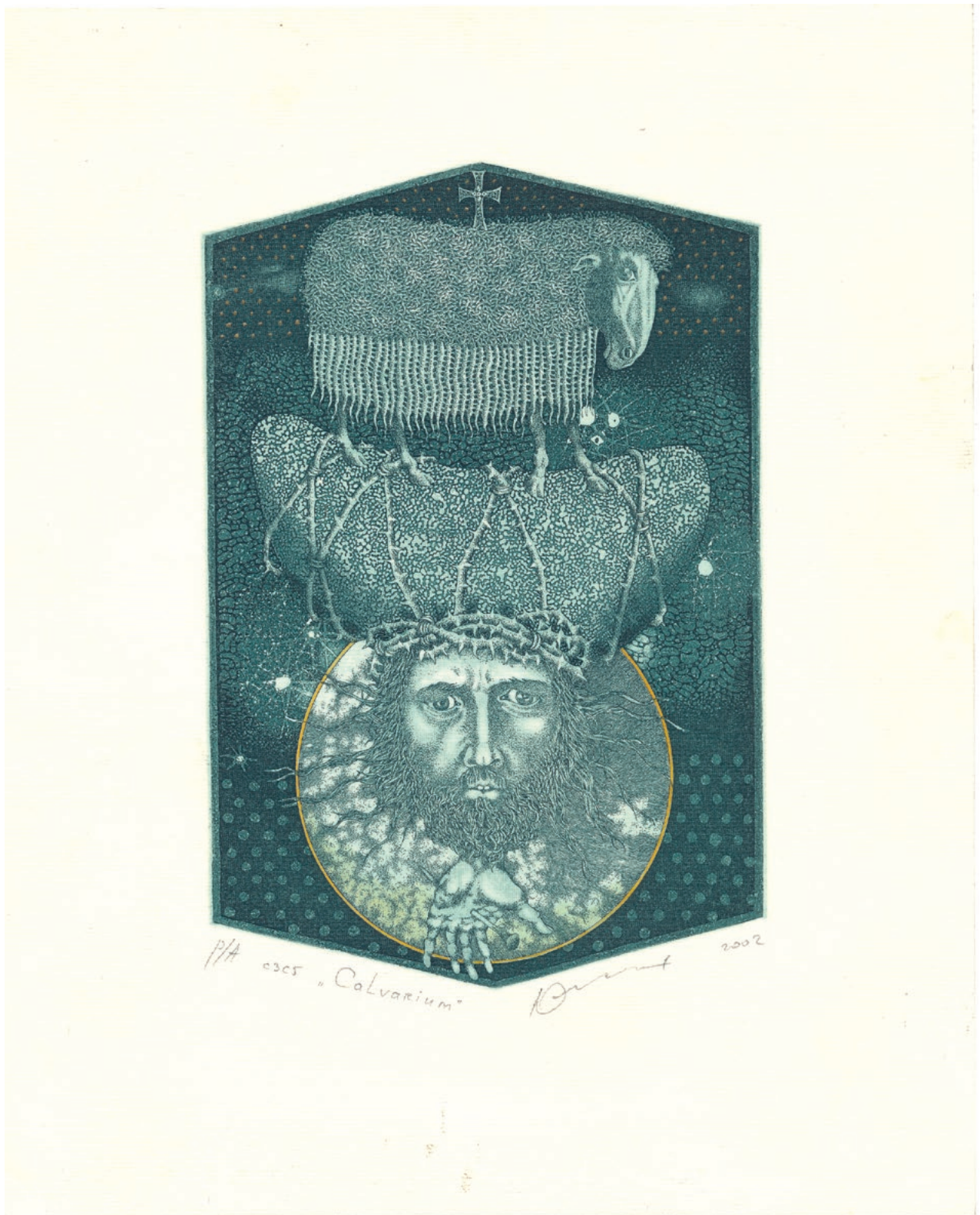
Jurij Jakovenko – "Calvarium", 2002., bakropis na papiru, 17,5 × 11,5 cm, MPS-3960