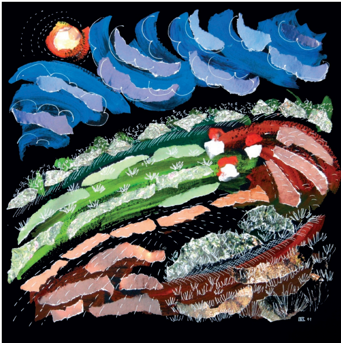
Proletni kolaž, 2011.

Akril na papiru, komadići papira, crtež tušem, 30 x 30 cm