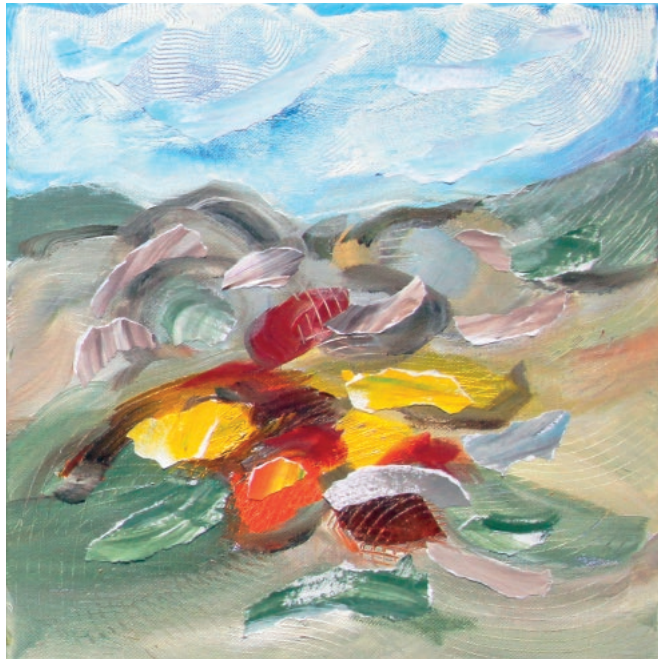
Trio Landscape 3, 2017. Akril na platnu, tonirani papir, 30 × 30 cm