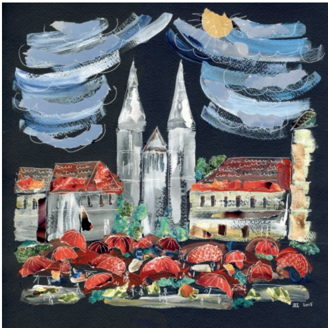
ZG - 3, 2015. Akril na papiru, komadići papira, crtež tušem 30 × 30 cm