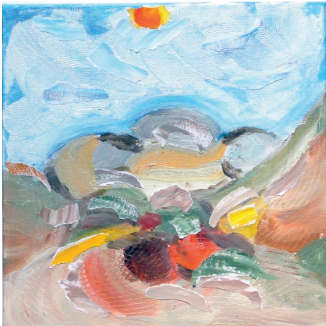
Trio Landscape 2, 2017. Akril na platnu, tonirani papir, 30 × 30 cm