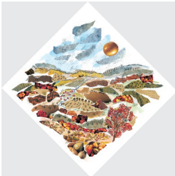
↑ 2-Ljeto, 2002. Akvel na papiru, komadići papira, crtež tušem 30 × 30 cm