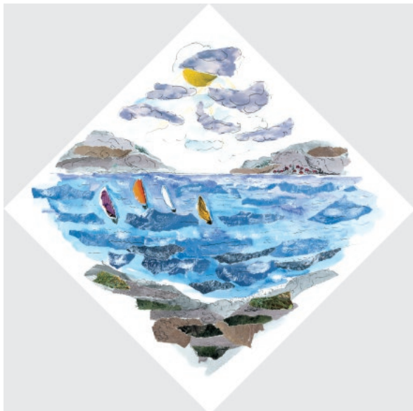
← 1-Proljeće, 2002., Akvel na papiru, komadići papira, crtež tušem 30 × 30 cm