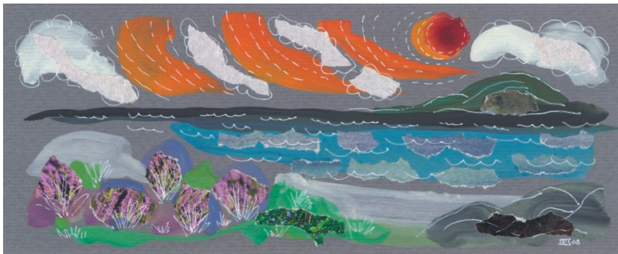
Kalendar 06, 2008. Tempera na papiru, komadići papira, crtež tušem, 12 × 30 cm