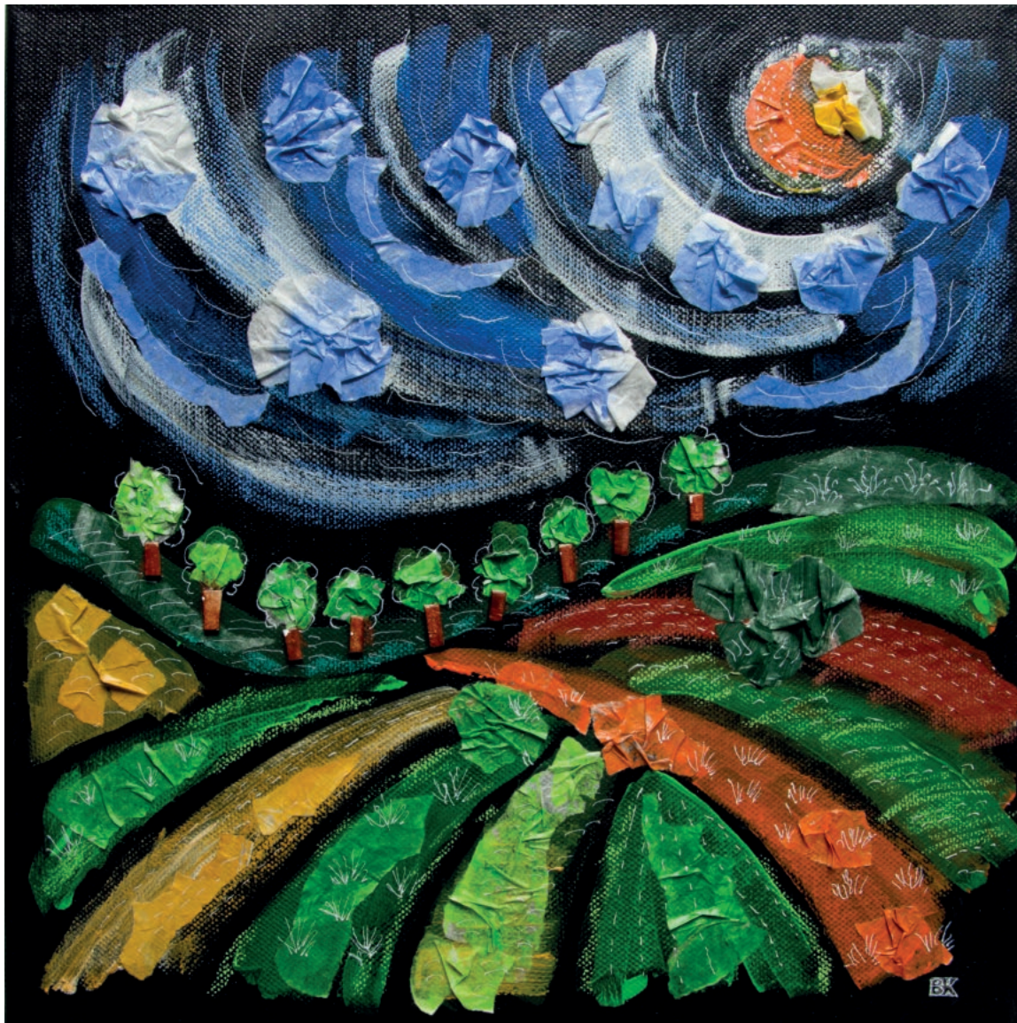
Tri dimenzije – 2, 2018. Akril na platnu, tonirani papir, 30 × 30 cm