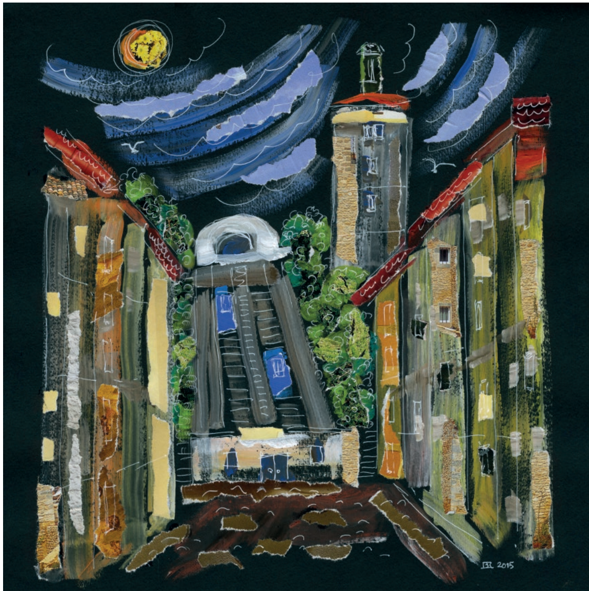
ZG - 2, 2015. Akril na papiru, komadići papira, crtež tušem, 30 x 30 cm