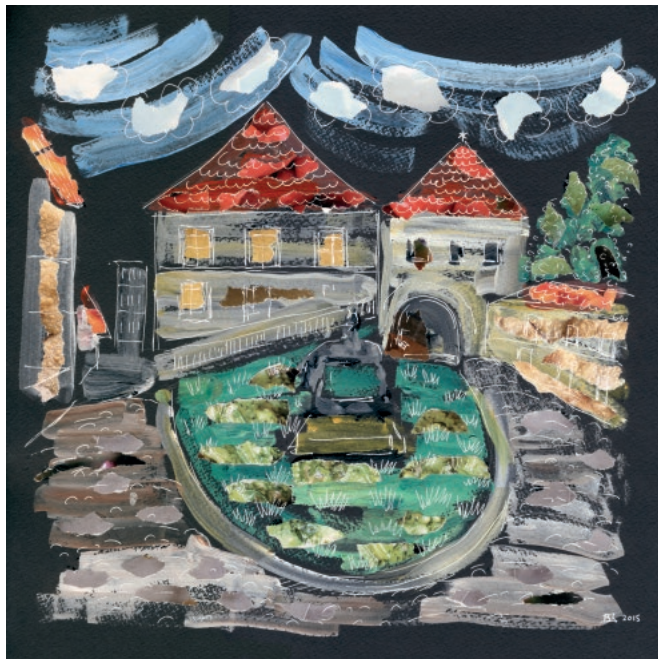
ZG - 4, 2015. Akril na papiru, komadići papira, crtež tušem 30 × 30 cm

→ 4 Frtalji XXXI, 2004. Akril na papiru, tonirani papir, crtež tušem 30 × 30 cm