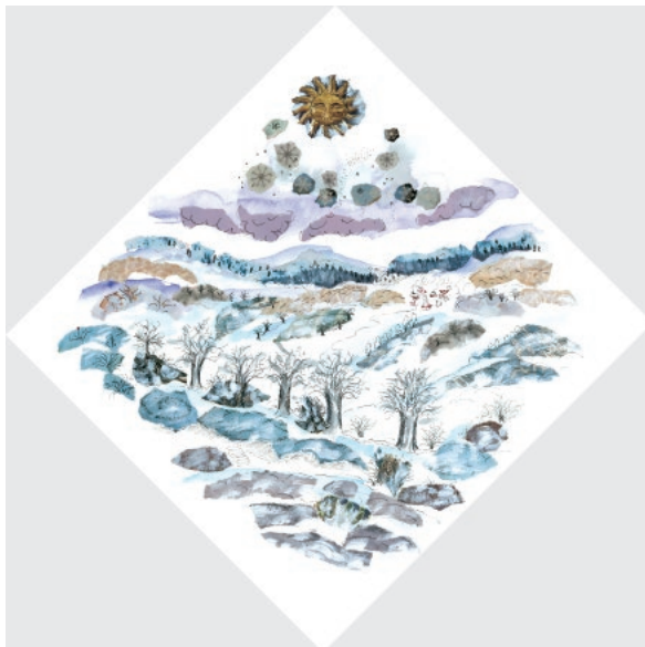
→ 4-Zima, 2002. Akvel na papiru, komadići papira, crtež tušem 30 × 30 cm