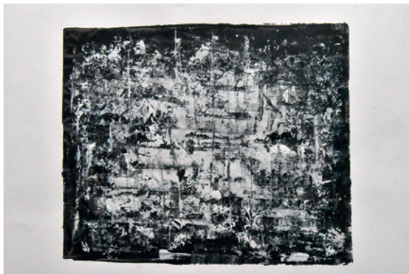
KRUNOSLAV JAKOBOVIĆ JM965M XII, 2020. monotipija 305 × 405 mm