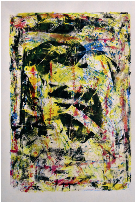
KRUNOSLAV JAKOBOVIĆ JM965M VII, 2020. monotipija 425 × 325 mm