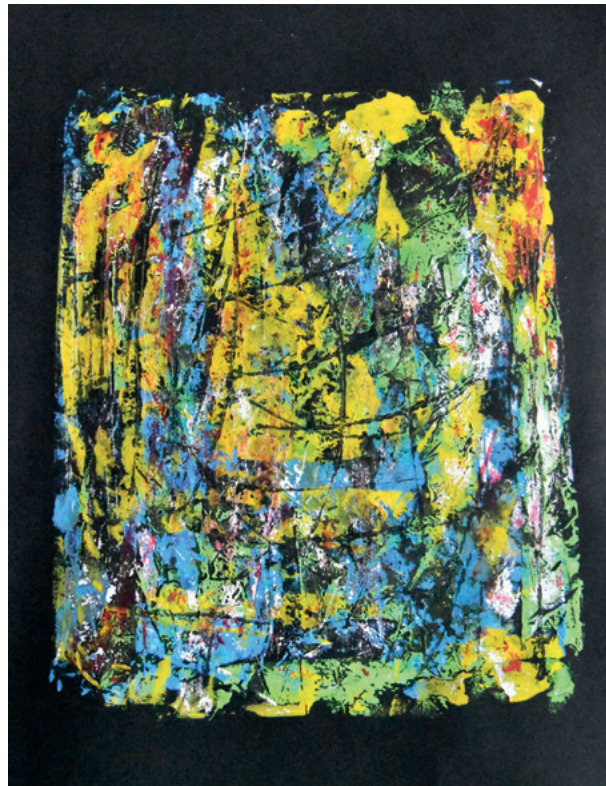
KRUNOSLAV JAKOBOVIĆ JM965M X, 2020. monotipija 370 × 270 mm