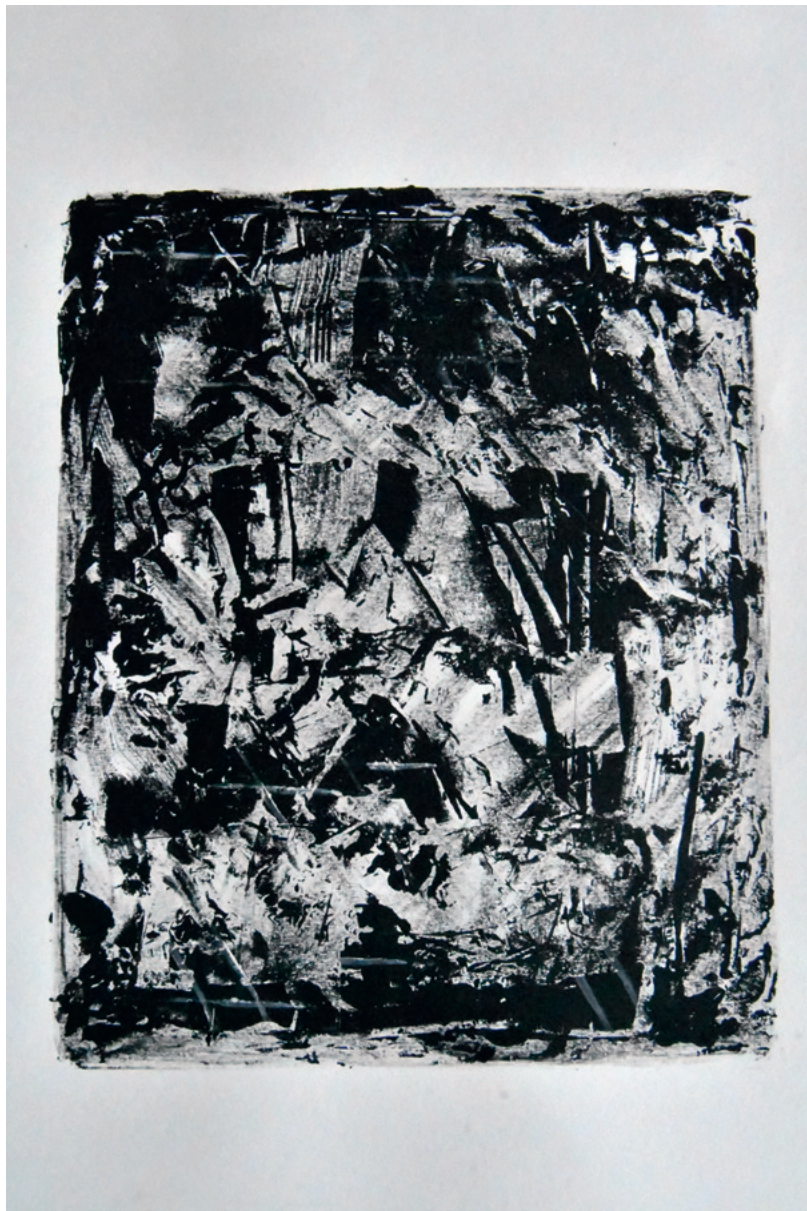
KRUNOSLAV JAKOBOVIĆ JM965M XI, 2020. monotipija 420 × 315 mm