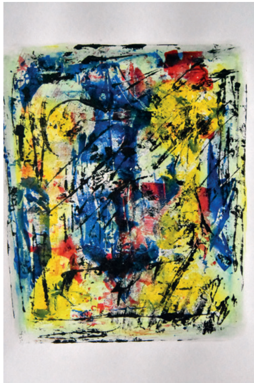
KRUNOSLAV JAKOBOVIĆ JM965M VIII, 2020. monotipija 398 × 300 mm