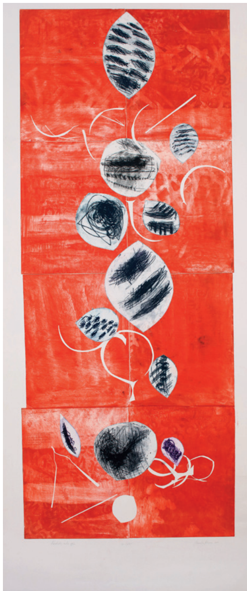
NEVENKA ARBANAS G - XXI, 2017. akvatinta, suha igla 2270 × 940 mm