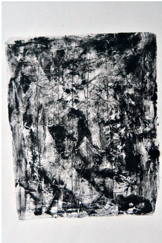
KRUNOSLAV JAKOBOVIĆ JM965M IX, 2020. monotipija 420 × 315 mm