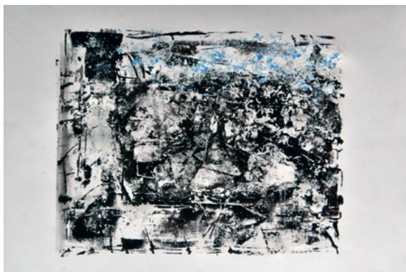
KRUNOSLAV JAKOBOVIĆ JM965M XIII, 2020. monotipija 305 × 405 mm