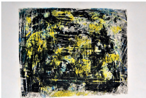
KRUNOSLAV JAKOBOVIĆ JM965M XIV, 2020. monotipija 305 × 405 mm