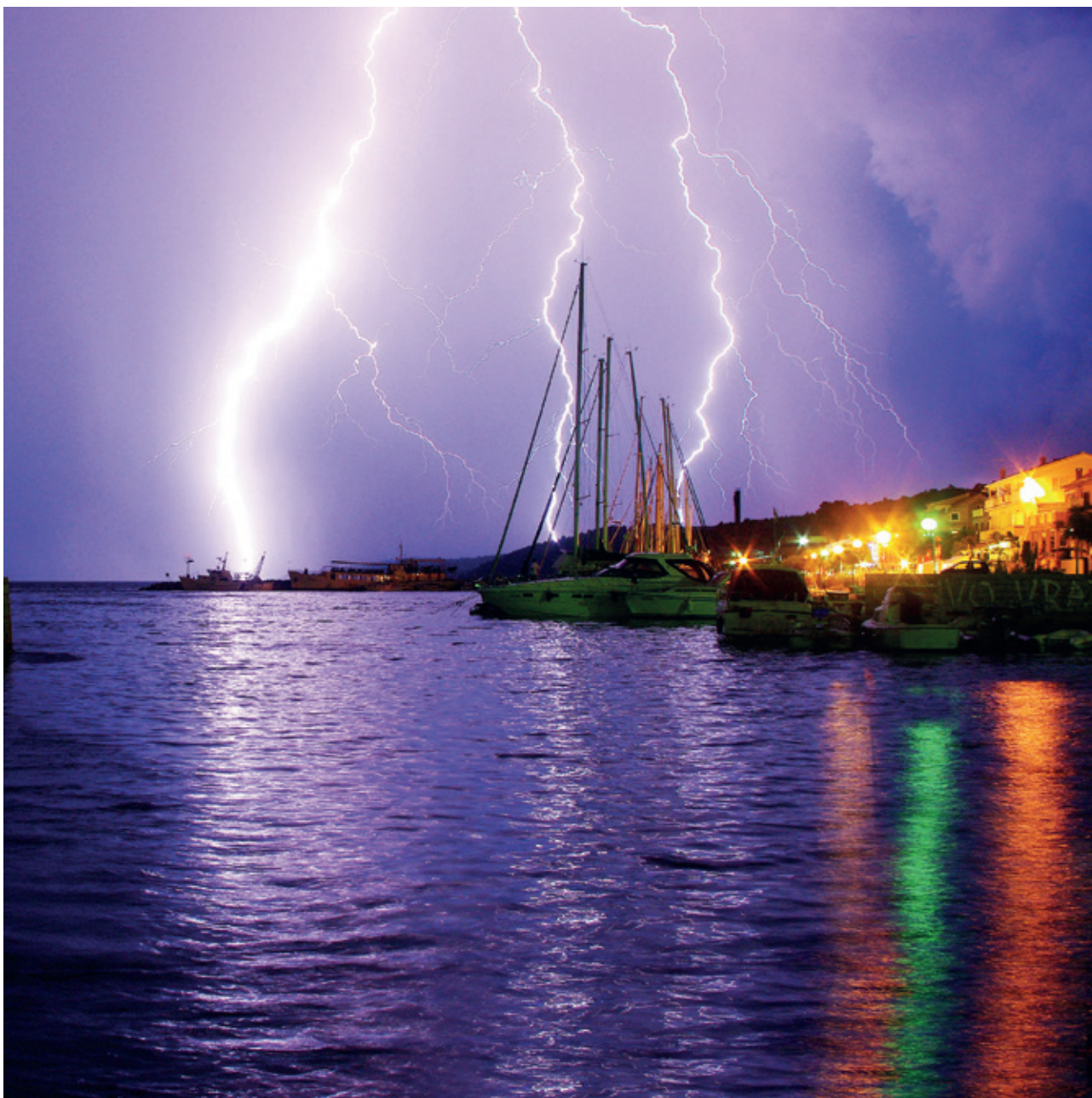
White Light White Heat

fije i samog prizora. Snimci imaju svoje uporište u realnom svijetu, ali se u njima nastojalo objektivom uloviti detalje na koje naslovi upućuju. Primjerice, White Light White Heat , koji je na razini slike uravnotežena kompozicija raspolovljena između neba i mora s prodorima svijetlih okomica munja, na razini značenjske cjeline ostvarene naslovom mogla bi upućivati na prilično psihodeličnu istoimenu pjesmu grupe Velvet Underground s kraja 60-ih 20. stoljeća. Tu je i Kak taubeka dva , rijedak primjer rada naslovljenog na hrvatskom jeziku, a koji doživljavamo i kao krajnje pročišćenu dvodjelnu kompoziciju izgrađenu od plavog neba i ciglene strukture zida u kojoj su se našla, zahvaljujući sretnom slučaju (kojeg Lesinger ističe kao važan element za nastanak dobrog