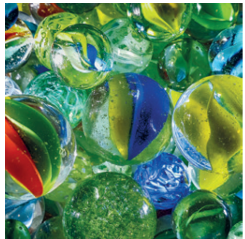
Igra staklenih kuglica