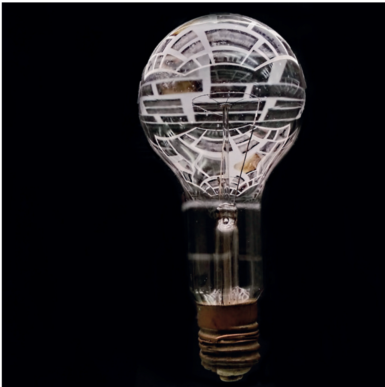
Žarulja iz ateljea Ive Kirina

Iz svih ovih razloga, pozivam vas da popratite putovanja fotografija Darka Lesingera od ekrana vašeg mobilnog telefona do prostora Galerije Kurija te da usporedite da li njegovi pažljivo odabrani motivi pričaju istu ili možda drugačiju priču, ovisno o mediju kroz koji ih promatrate.