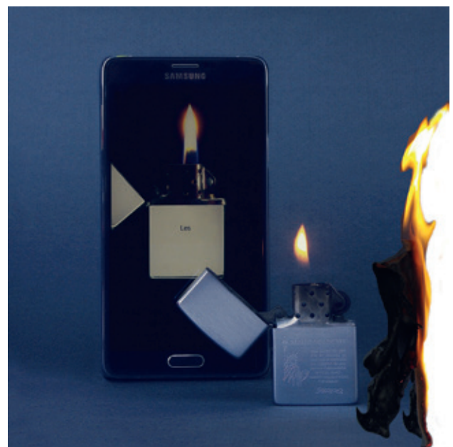
Even Better Than the Real Thing

Što je sa svim onim ljudima oštra oka koji takve trenutke uporno i iznova otkrivaju i bilježe svaki dan? Koji ne primjećuju samo motive, ili zamrzavaju trenutke u vremenu, nego i umiju zabilježiti emociju koja će proizvesti reakciju u oku promatrača bez obzira da li fotografiju promatratare kroz Instagram na minijaturnom ekranu vašeg mobilnog telefona ili se divite uvećanoj fotografiji na zidu galerije.