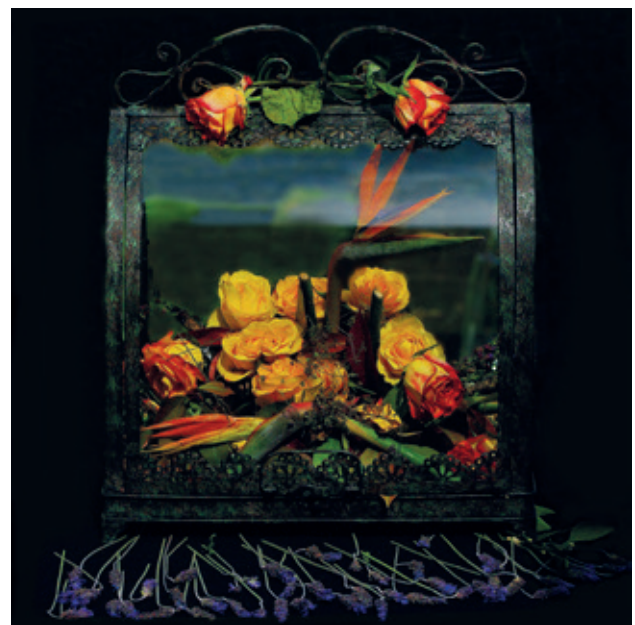
↑ Majina srebrna zdjela Dead Flowers

loškog teksta. Dakle, snimak izložbenog prostora ispunjenog Lesingerovim fotografijama sa sabranim pro-matračem, kako je to lijepo naglasio Walter Benjamin još u 30-im godinama 20. stoljeća 9 , nalazio bi se gotovo na samom kraju moje vizualne bilježnice.