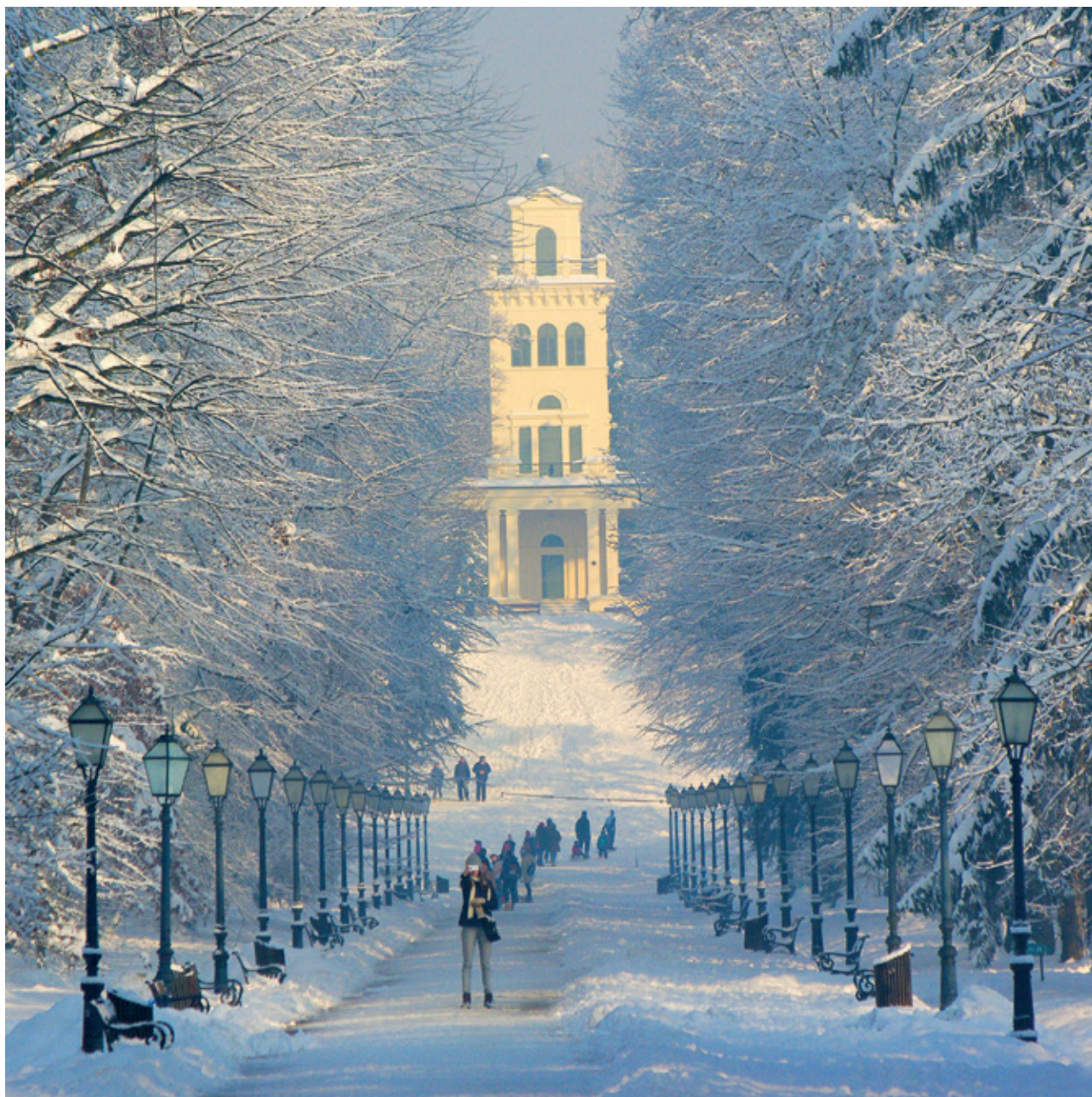
New Year's Day

ukazala na važnost označavanja fotografija naslovom. I tek tu bih otvorila mali Lesingerov univerzum slika 6 spremnih za izložbeni blow-up u Muzeju Prigorja. Da bih ga što bolje razumjela, uredila sam ga dijeljenjem u grupe polazeći od fotografija utemeljenih na opažanju i zaustavljanju aparatom realnih prizora u kojima napetost unosi ne samo prizor nego i naslov fotografije pa do primjera u kojima je samom prizoru pridodavan tekst kako bi se ojačalo značenje.