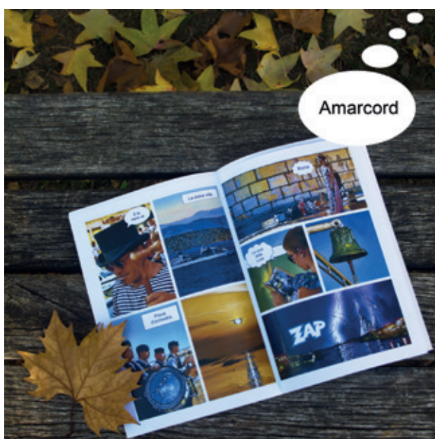
↑ I Love Paris Amarcord