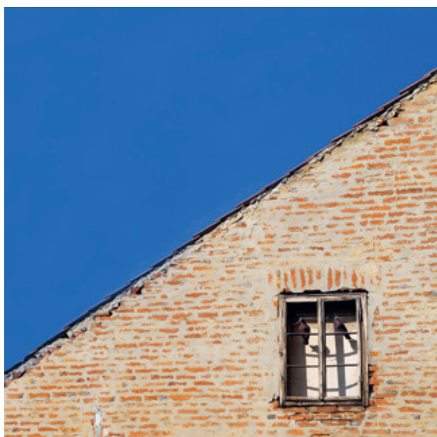
Kak taubeka dva