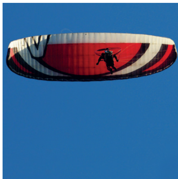
Learning to Fly

ozbiljnije s njim oboje susreli tada, iako su prvi fotografski aparati (njegova Agfina igračka ISO-PAK C i moj Zorki 6) došli u naše domove i ranije. Dakle, to bi mogao biti i snimak vršnjačkog fotografskog okupljanja , pripadanja tim posebnim krugovima mladih ljudi koji su prolazili kroz sve etape nastanka fotografije, posebice kroz razvijanje filmova (negativa) i njihovog transponiranja na površinu foto papira. Uključivalo je to stvaranje osjećaja izabranosti i posvećenosti, a dodatno ojačano zatamnjеним prostorom foto-laboratorija s različitim opremom. Detaljno poznavanje fotografskog aparata i njegovih mogućnosti te tehnologije razmjerno složenog postupka koji je dovodio do materijalne fotografije bilo je gotovo obavezno. Dok smo ih koristili, dok smo