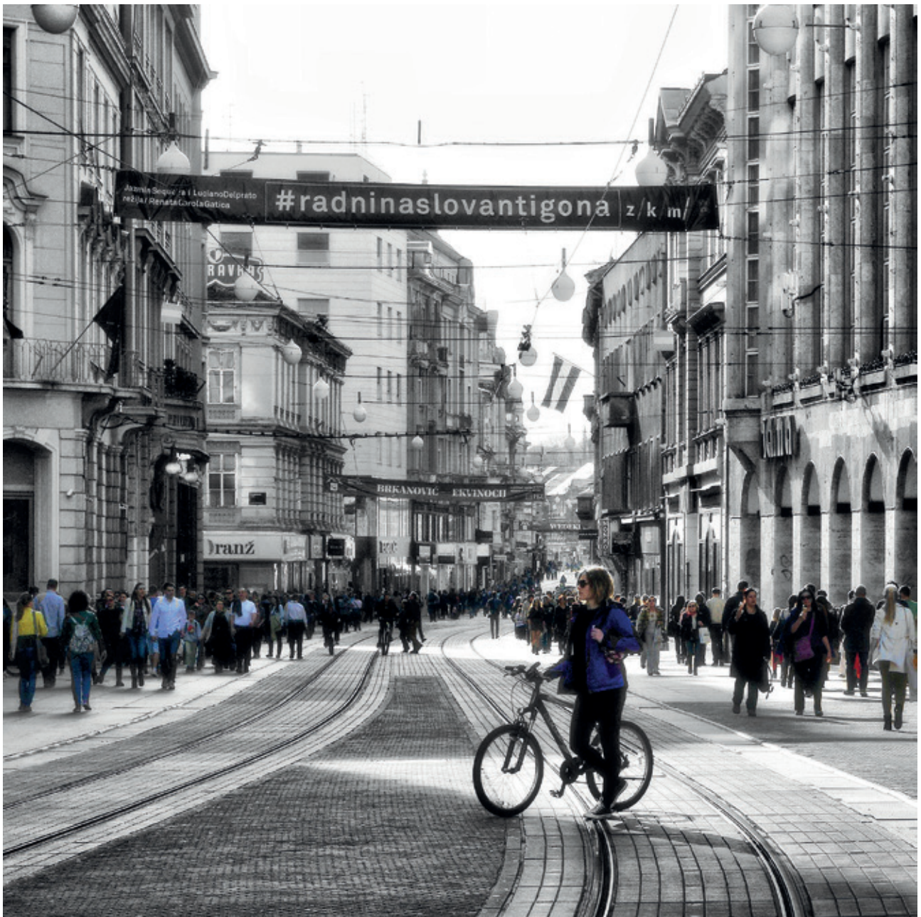
Radni naslov Antigona

U drugoj skupini okupila sam radove u kojima je fotograf sam proizveo/konstruirao prizor sastavljen od realnih stvari, poigrao se s njihovim odnosom prema okolišu (pješčani sat u pijesku, snježna kugla u snijegu i sl.), dopustio si i poigravanje tehnologijom, a neke od inscenacija opremio iznova i naslovima pjesama. Svakako bih tu izdvojila fotografiju važnu autoru – Even Better Than the Real Thing (naslov pjesme grupe U2) te fotografiju važnu meni, nastalu na izložbi sjetskog fotografa Ive Kirina u Muzeju Prigorja – prizor istovremeno jednostavan i složen (okoliš žarulje de-konstruiran u svjetlećem tijelu!), koji je sam po sebi iziskivao igranje medijem i nije bilo potrebno pojačavati ga pridodavanjem naslova. Nasuprot njemu, a ipak nastalo po istom