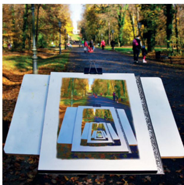
↑ The Steel Claw Maksimirski akvarel