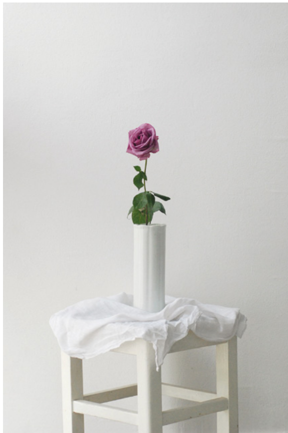
RAJ, 2011. fotografija – digitalni print na platnu, 70 × 50 cm