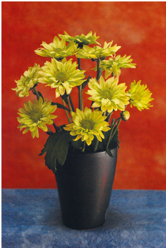
Van DROBNJAK, 2011. fotografija – digitalni print na platnu, 70 × 50 cm