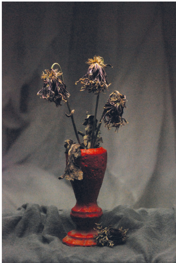
PAKAO, 2011. fotografija – digitalni print na platnu, 70 × 50 cm