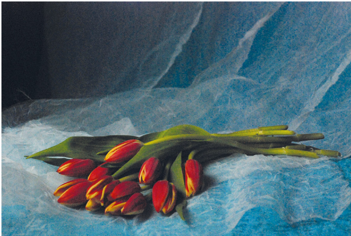
TULIPANI 1, 2011.

fotografija – digitalni print na platnu, 50 × 70 cm