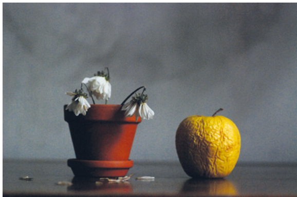
S JABUKOM, 2010. fotografija – digitalni print na platnu, 50 × 70 cm