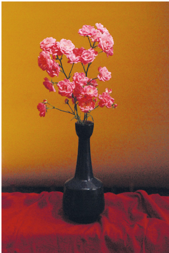
JAPAN, 2011. fotografija – digitalni print na platnu, 70 × 50 cm