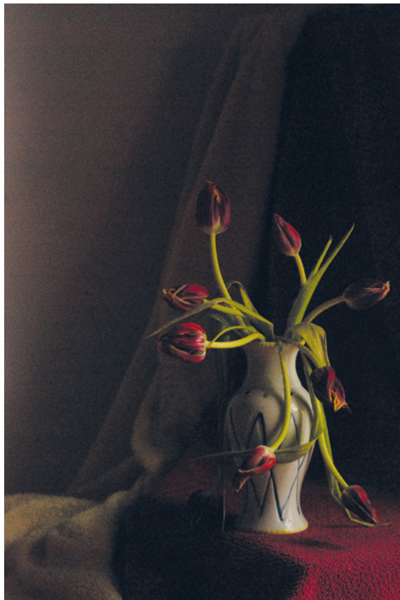
TULIPANI 3, 2011. fotografija – digitalni print na platnu, 70 × 50 cm