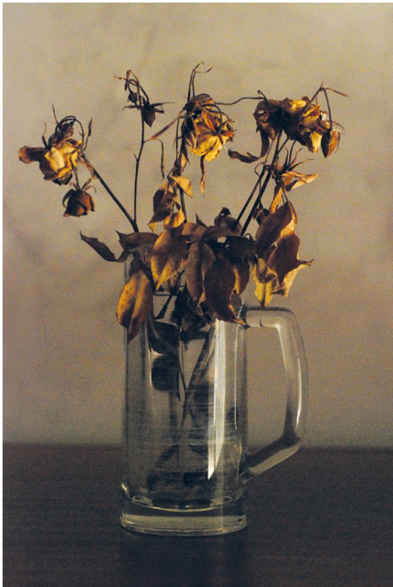
POČETAK, 2010. fotografija – digitalni print na platnu, 70 × 50 cm