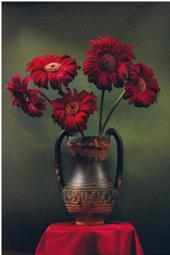
GERBERI, 2011. fotografija – digitalni print na platnu, 70 × 50 cm