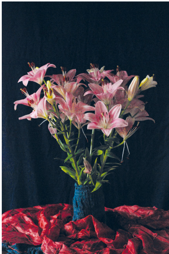
KOD TETE ANKE, 2011. fotografija – digitalni print na platnu, 70 × 50 cm