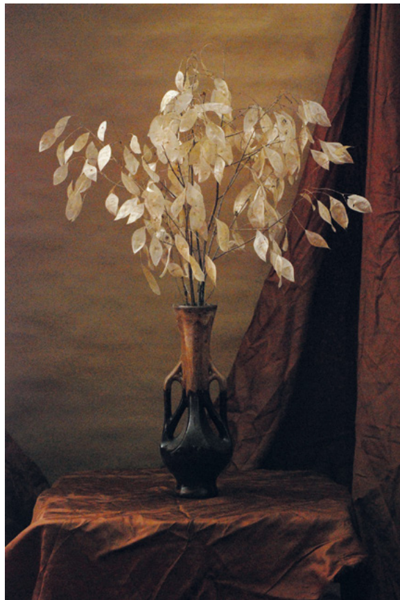
SMEĐA, 2011. fotografija – digitalni print na platnu, 70 × 50 cm