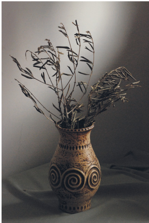
MASLINA, 2012. fotografija – digitalni print na platnu, 70 × 50 cm