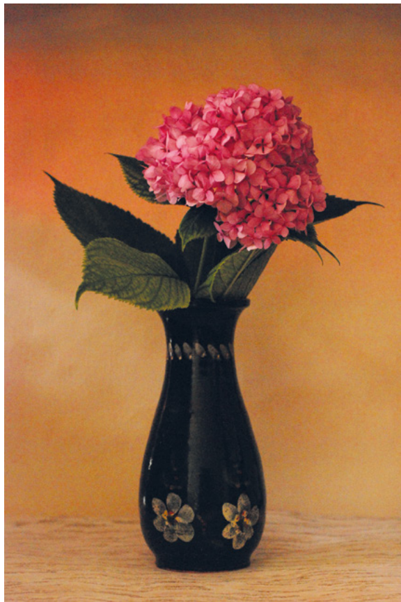
HORTENZIJA, 2011. fotografija – digitalni print na platnu, 70 × 50 cm