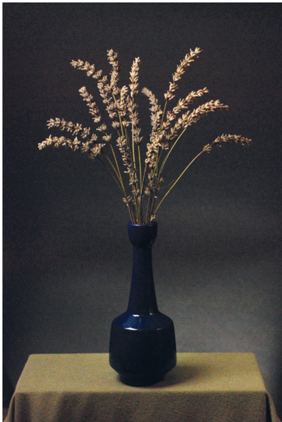
LA VANDA, 2011. fotografija – digitalni print na platnu, 70 × 50 cm