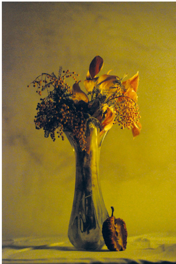
ZLATNA, 2011. fotografija – digitalni print na platnu, 70 × 50 cm