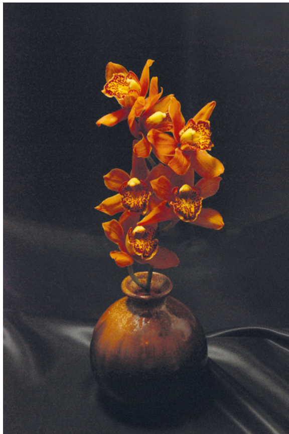
ORHIDEJA, 2011. fotografija – digitalni print na platnu, 70 × 50 cm