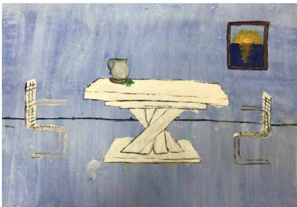
Dragutin Šporec, akrilik na platnu, 70 x 50 cm, 10 god.