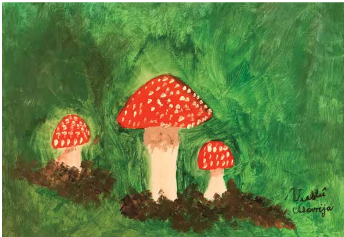
Marija Vukelić, akrilik na platnu, 70 x 50 cm, 89 god.