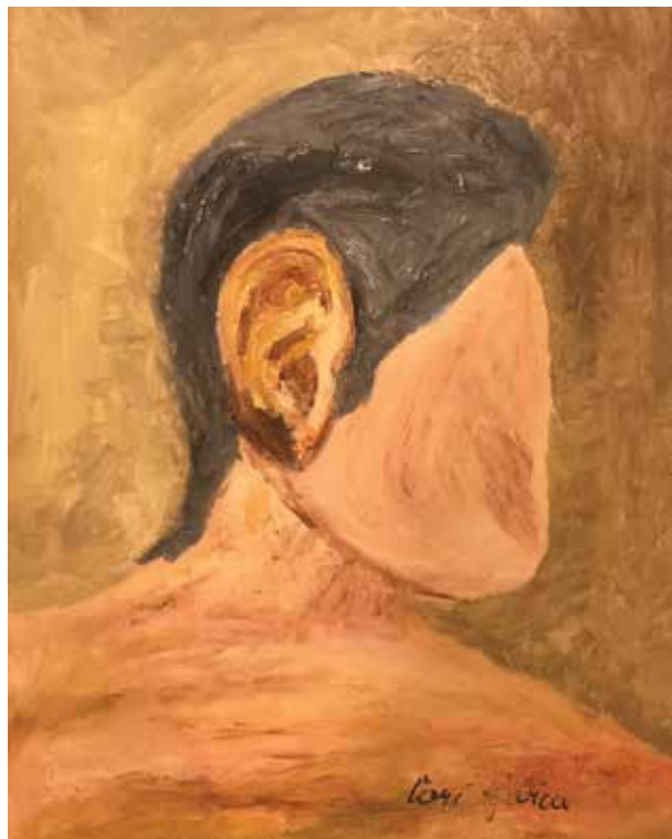
Ljubica Vori, akrilik na platnu, 60 x 40cm, 88 god.