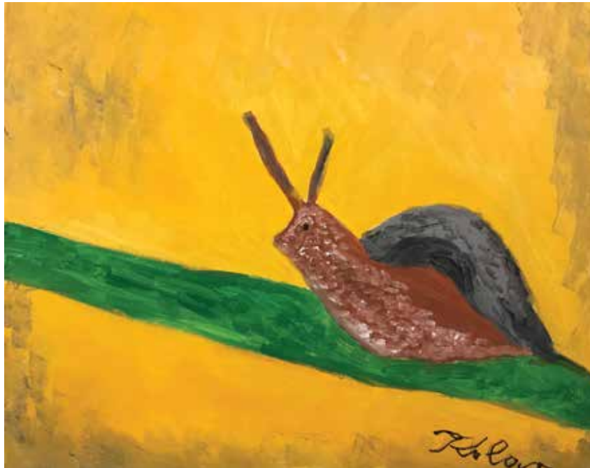
Kolar Stanko , akrilik na platnu, 70 x 50 cm, 84 god.