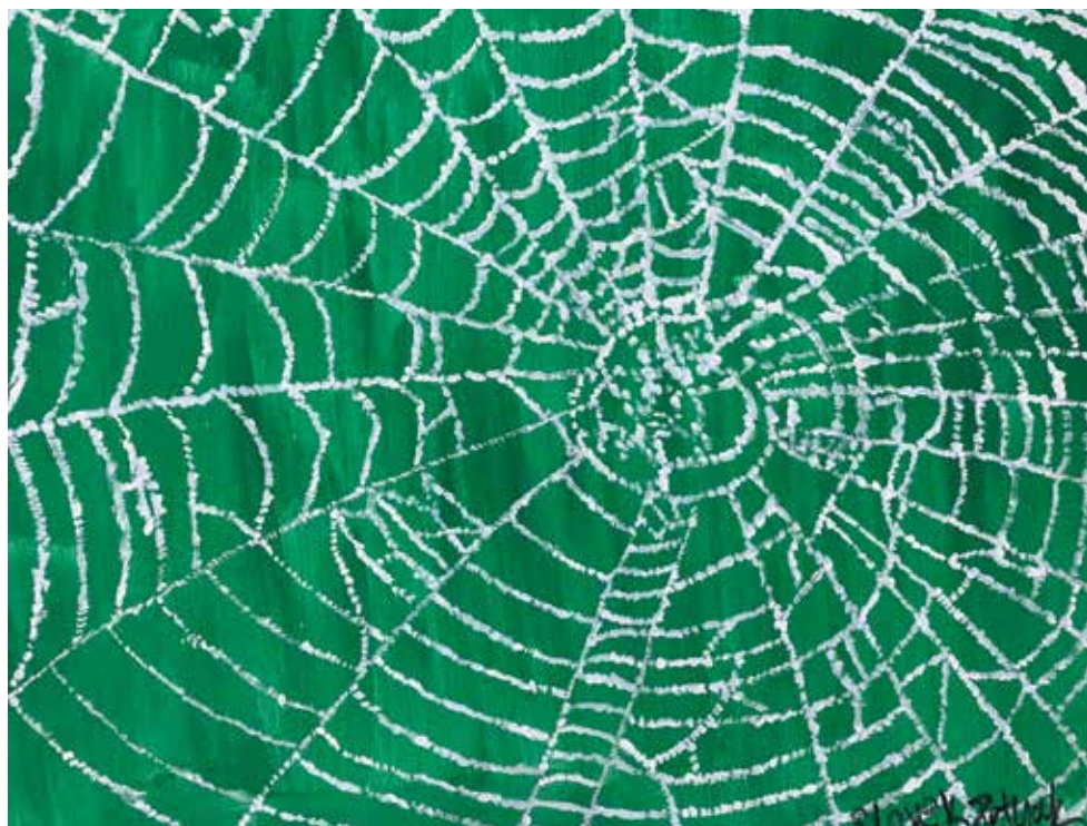
Slavek Petljak, akrilik na platnu, 70 x 50 cm, 87 god.