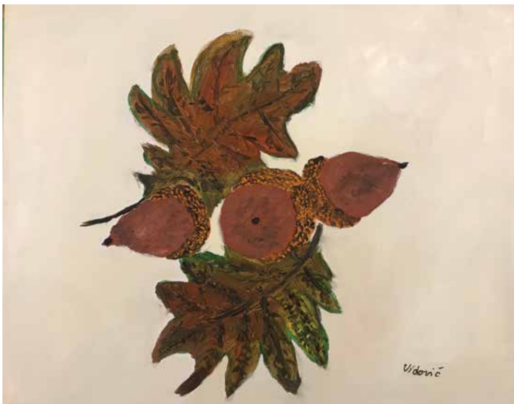
Stankica Vidović, akrilik na platnu, 60 x 40 cm, 88 god.