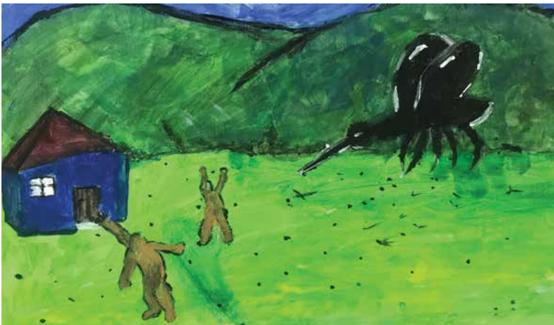
Gabrijel Martinović , akrilik na platnu, 60 x 40 cm, 9 god.