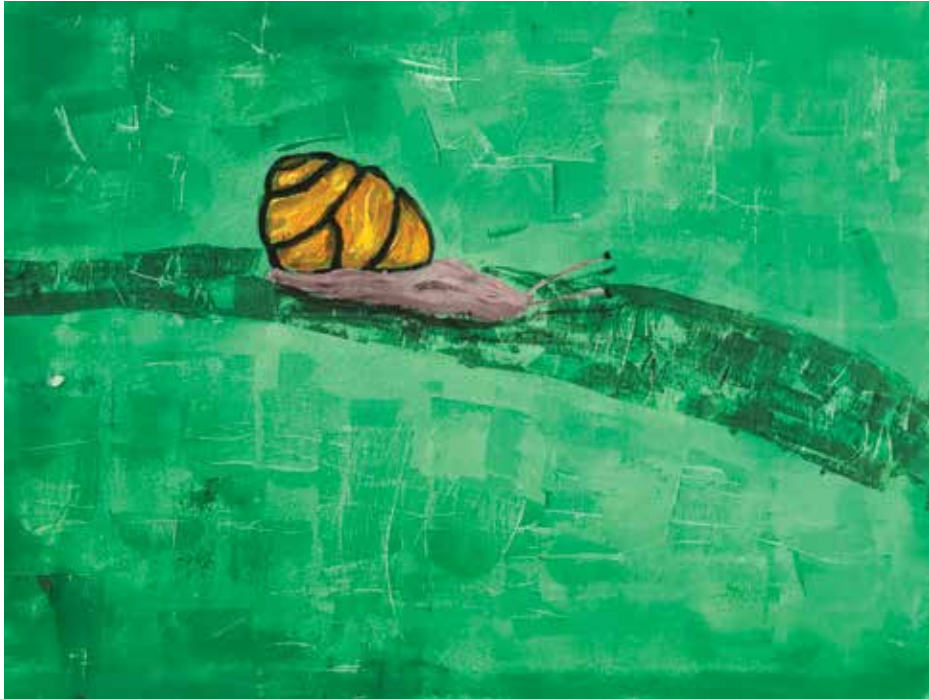
Roko Juraga , akrilik na platnu, 70 x 50 cm, 10 god.

Kaj je na svietu najjakše? (Puž, teri svo ižu nosi)