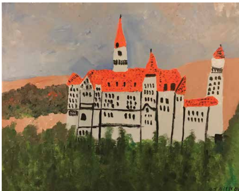
Marija Stanković , akrilik na platnu, 70 x 50 cm, 92 god.