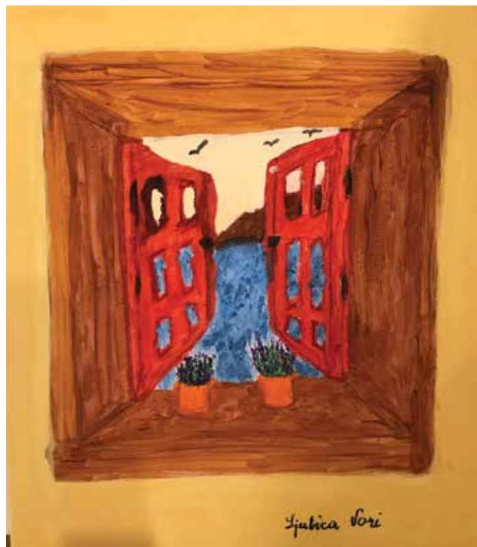
Ljubica Vori , akrilik na platnu, 60 x 40 cm, 88 god.