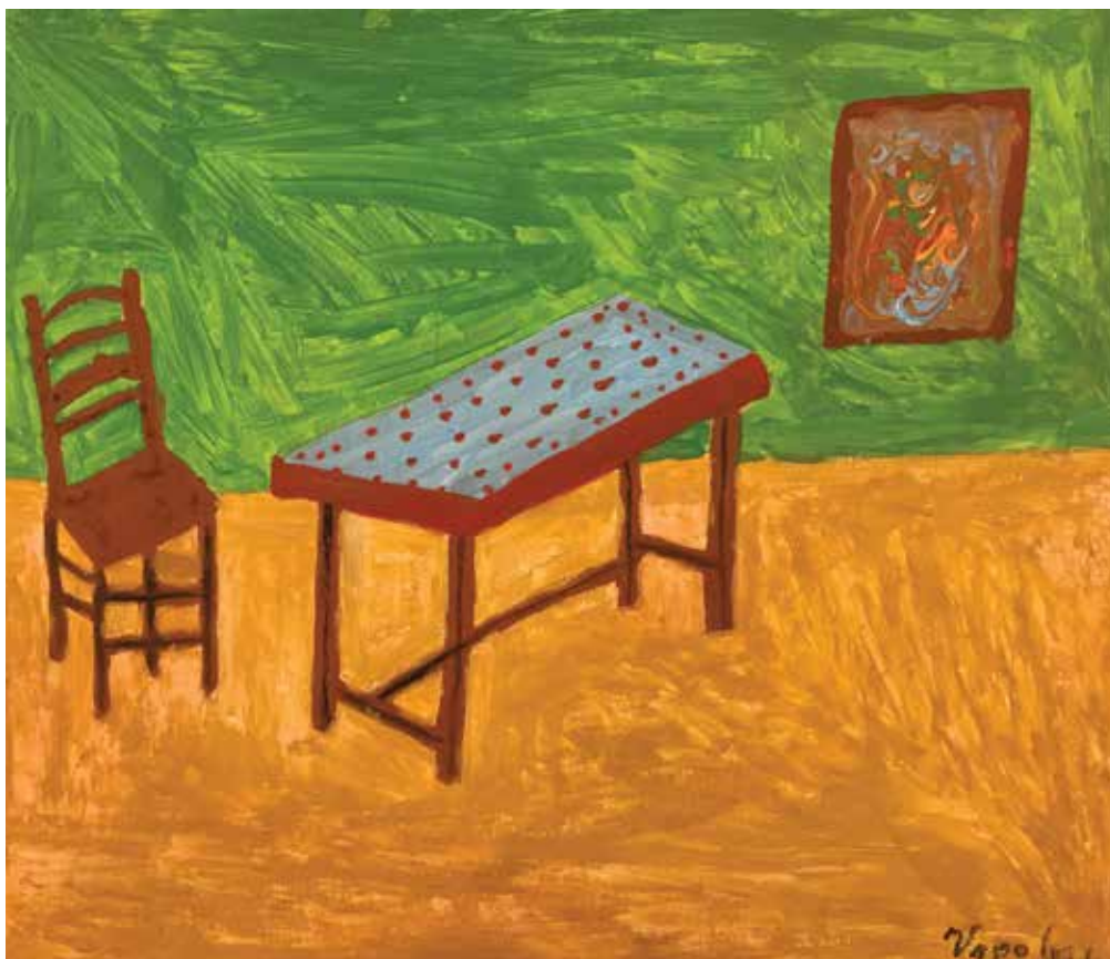
Vrpoljac Zora, akrilik na platnu, 70 x 50 cm, akrilik na platnu, 88 god.