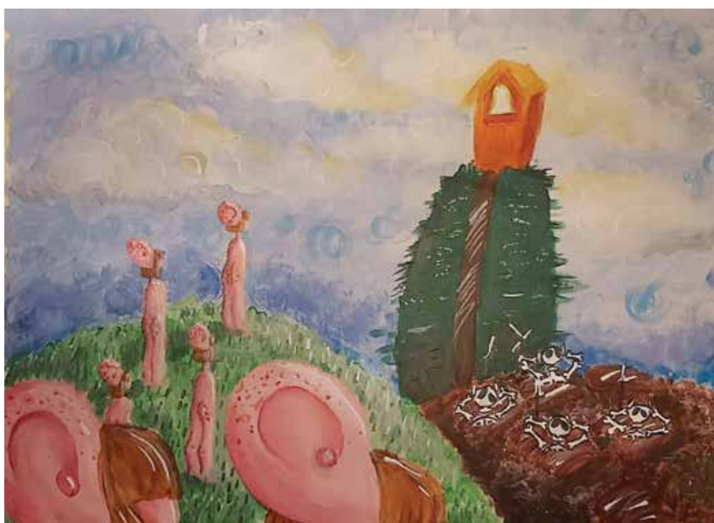
Tereza Šarić, akrilik na platnu, 70 x 50 cm, 14 god.