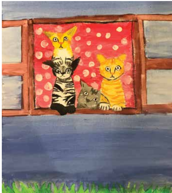
Dragutin Šporec , akrilik na platnu, 60 x 40 cm, 10 god.

De je maček, da nie ni fiže ni vane? (Na obloku)