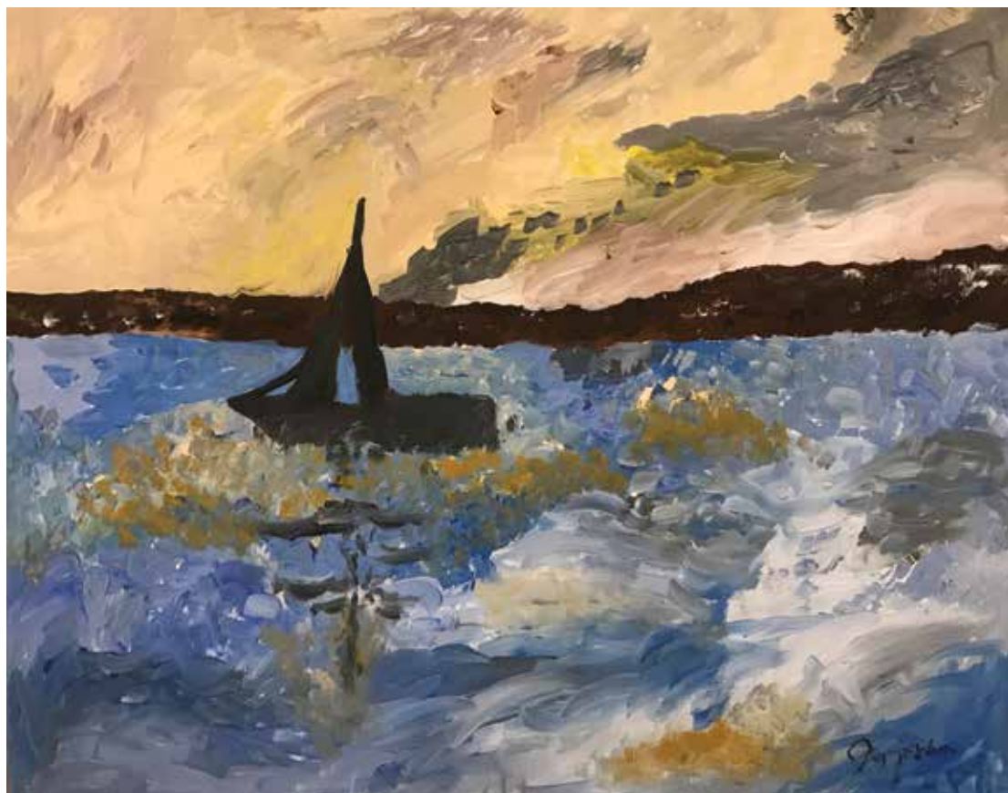
Rada Pajeska , akrilik na platnu, 70 x 50 cm, 74 god.