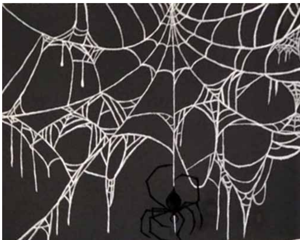
Lara Smolčić, akrilik na platnu, 70 x 50 cm, 14 god.