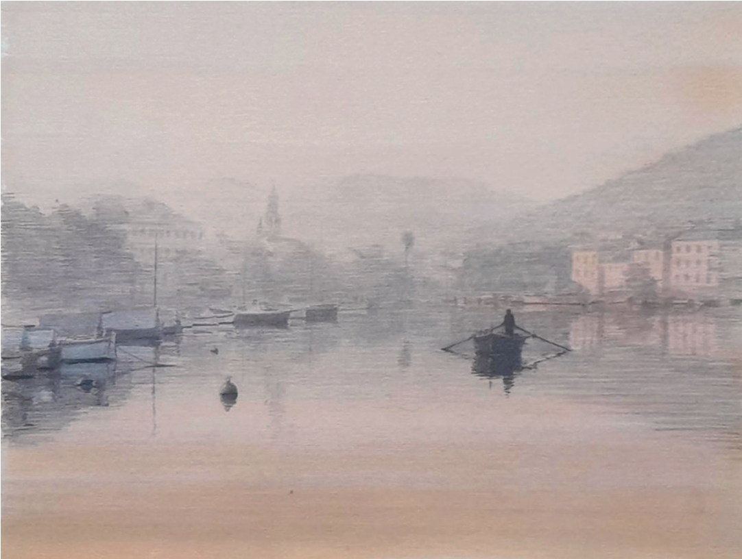
VELA LUKA RANO U JUTRO, 1989. kombinirana tehnika, 24 × 37 cm