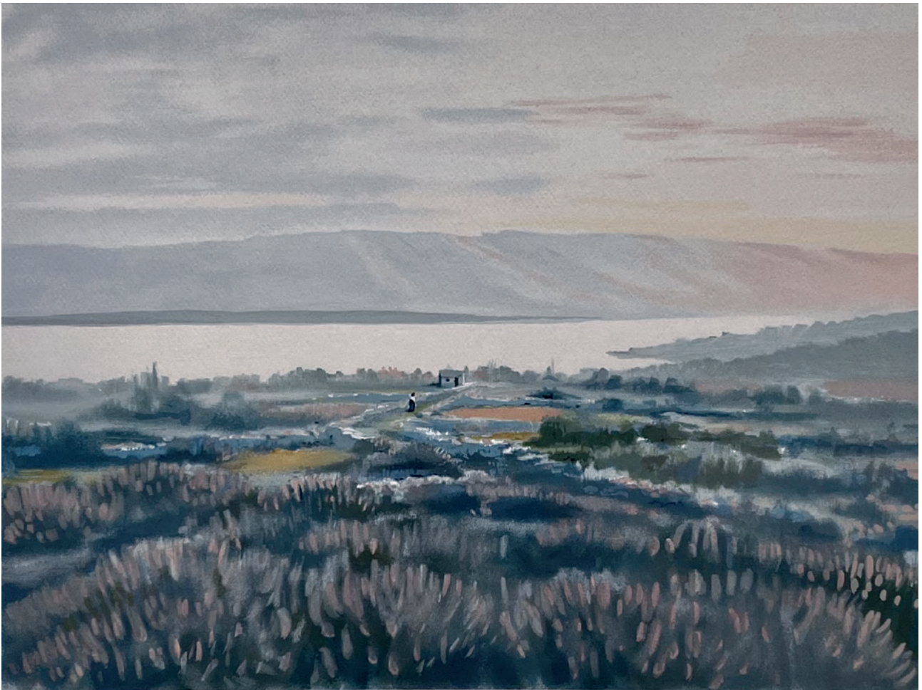
LEVANDA U CVATU, između 1980. i 2000. serigrafija, 35 × 50 cm