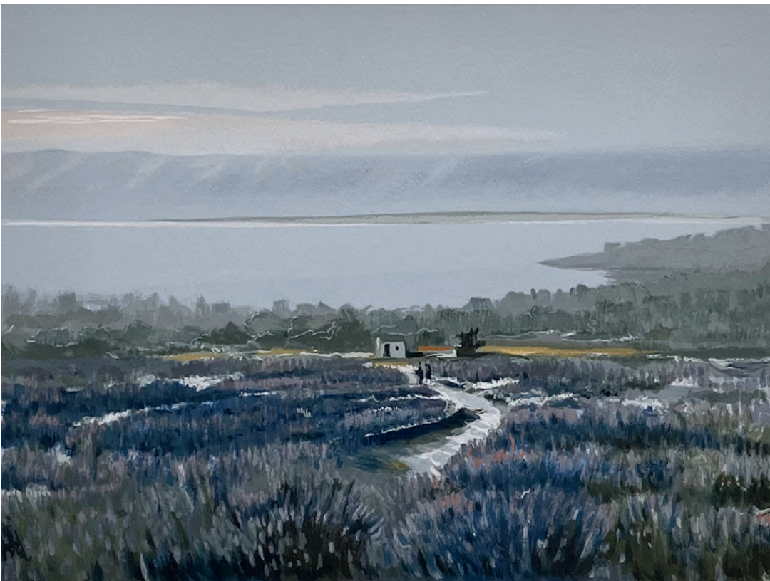
LEVANDA U POLJU, između 1980. i 2000. serigrafija, 27 × 41 cm