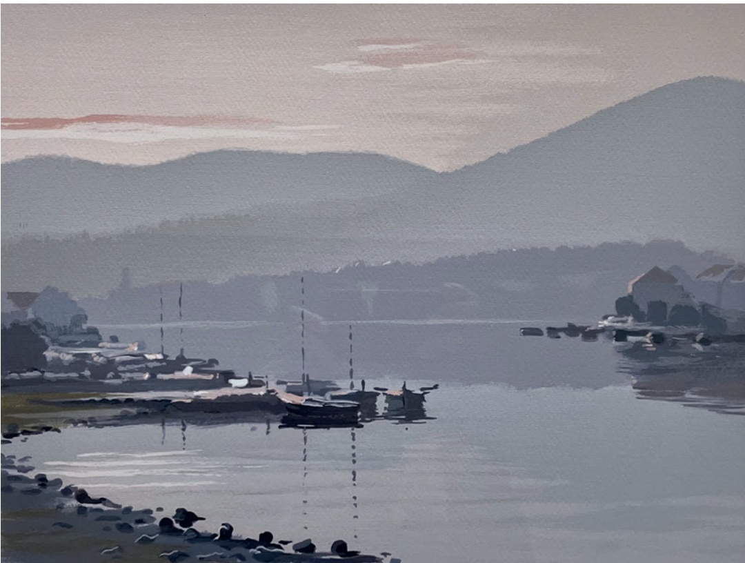
SVITANJE U VELOJ LUCI, između 1980. i 2000. serigrafija, 27 × 41 cm