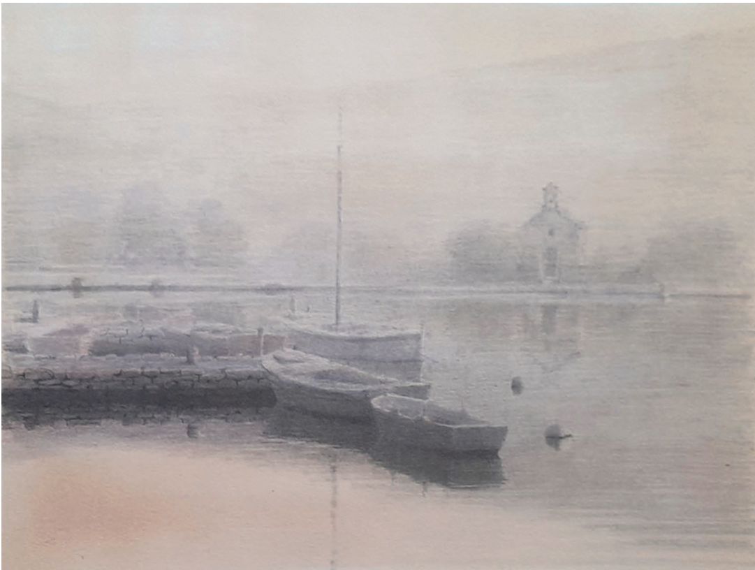
BONACA U KALIMA, 1991. kombinirana tehnika, 26 × 40 cm