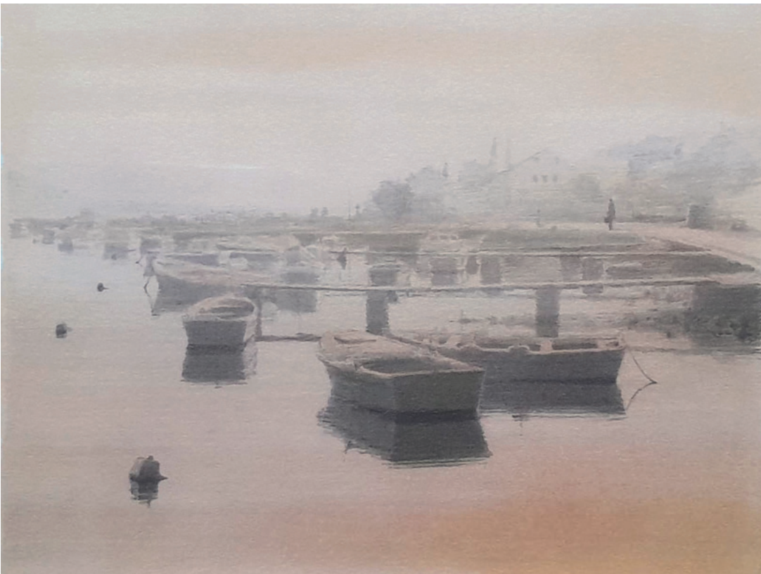
LIJEPO TROGIRSKO JUTRO, 1990. kombinirana tehnika, 24 × 37 cm