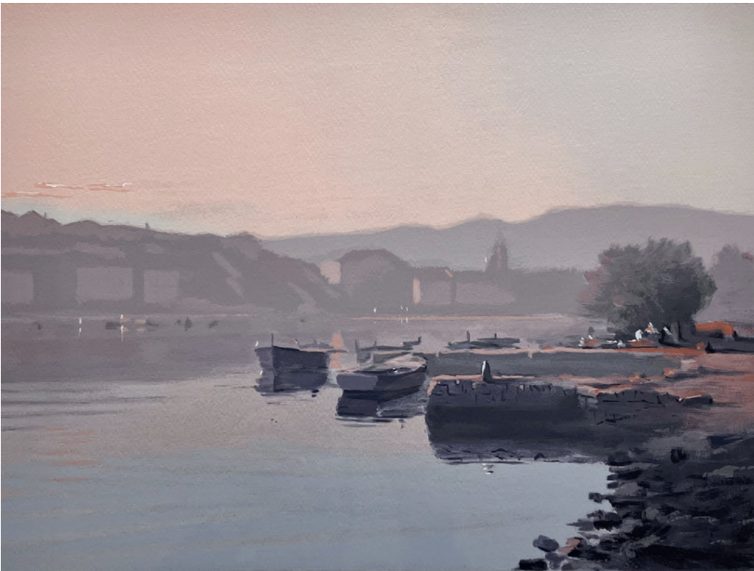
MIRNO VELOLUŠKO JUTRO, između 1980. i 2000. serigrafija, 30 × 46 cm