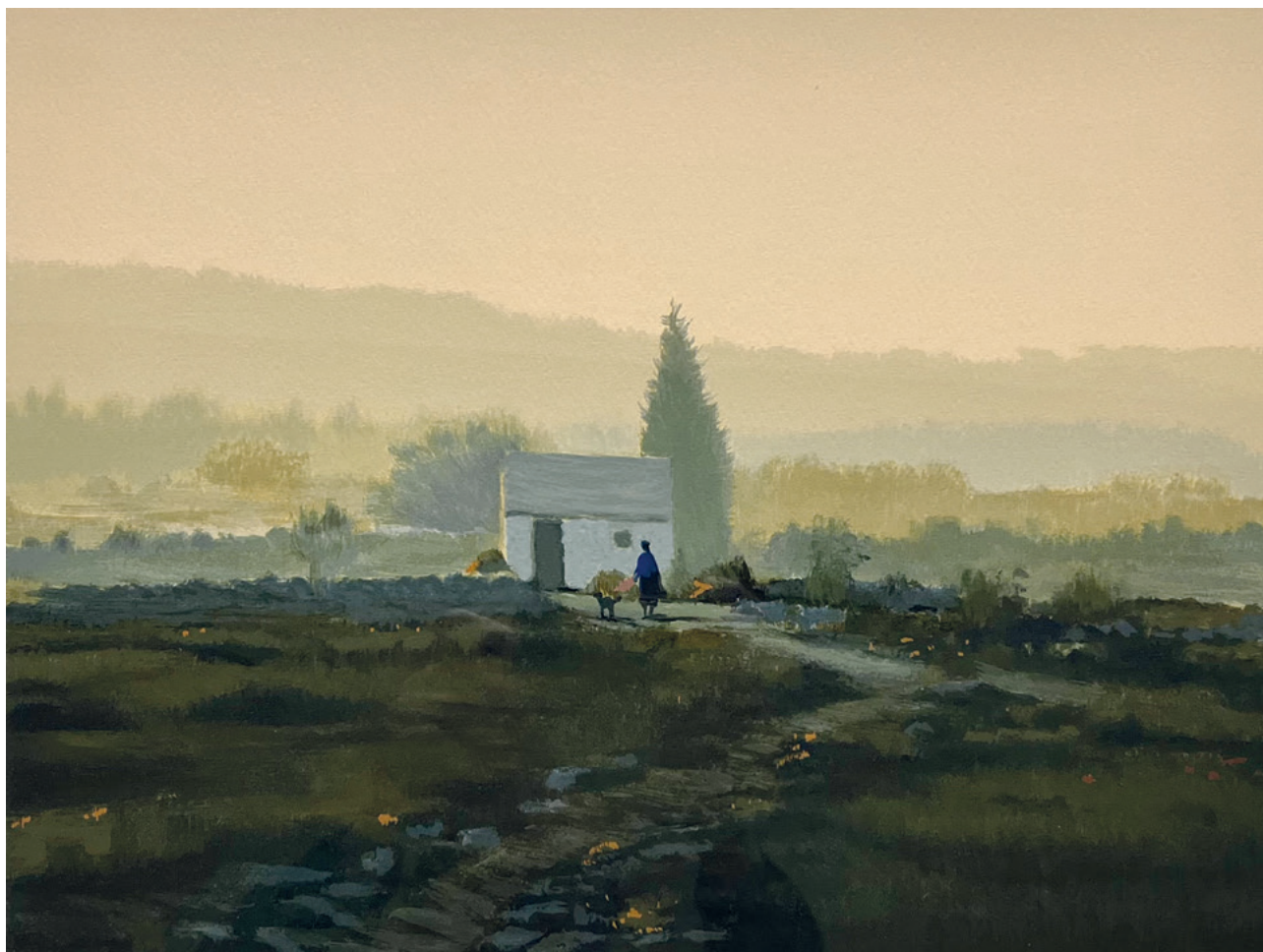
NA DJEDOVINI, između 1980. i 2000. serigrafija, 27 × 41 cm