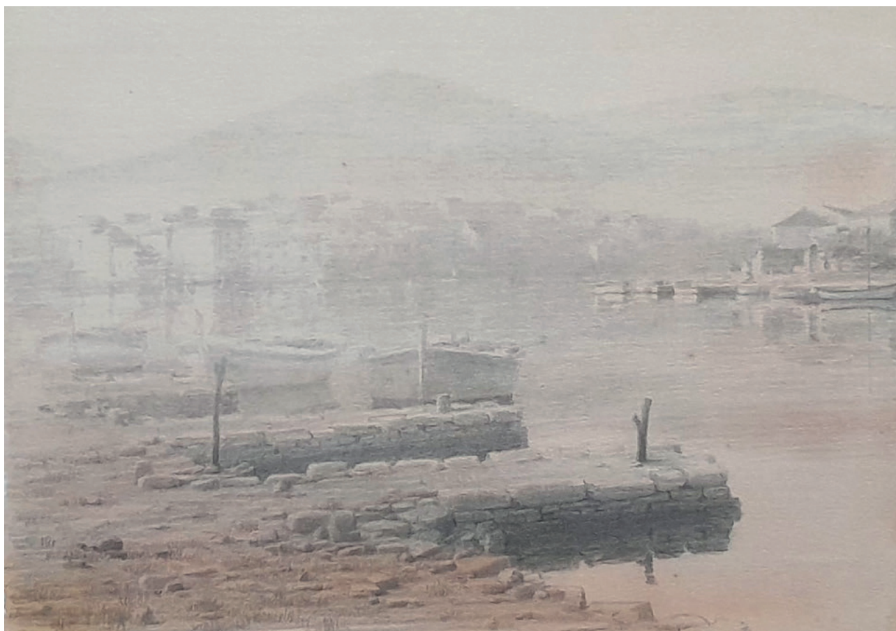
BONACA U VELOJ LUCI, 1993. kombinirana tehnika, 23 × 32 cm