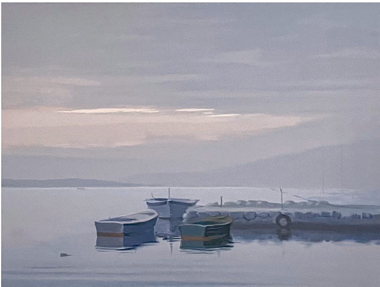
JUTARNJA BONACA, između 1980. i 2000. serigrafija, 35 × 50 cm

Ono pak što konceptijski determinira ovu seriju grafičkih listova jesu dvije tematske cjeline koje su i okosnice njegova golemoga opusa, jer se iščitavaju u dugoj kronološkoj liniji u brojnim i inventivnim mutacijama. Riječ je, dakako, o motivima autorova zavičajnoga prostora, poglavito Vele Luke, koji se svojom brojnošću otkrivaju i kao velika i neiscrpna tema te mediteranskoga krajolika u njegovim prepoznatljivim obilježjima. Oba ciklusa slikar pokriva jednim naslovom — Orebove utihe — i time čvrsto markira njihovu temeljnu odrednicu snažne lirске sugestivnosti. Upravo je ta lirška sastavnica prožela cjelokupno Orebovo stvaralaštvo koje je na suvreme-