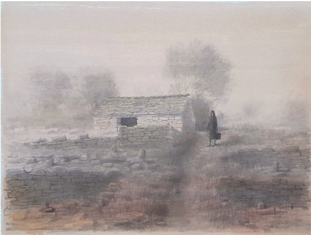
KUĆICA U POLJU, 1987. kombinirana tehnika, 22 × 35 cm