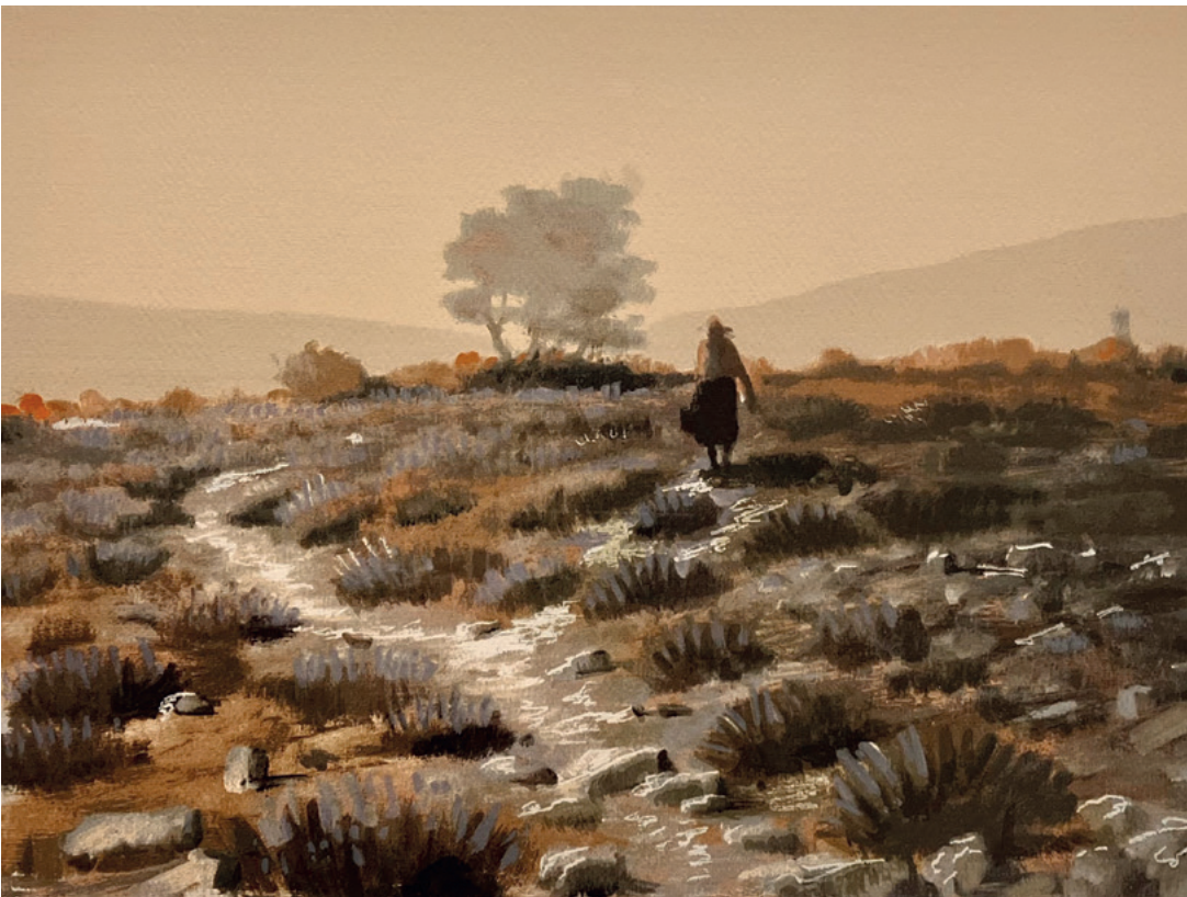
U KAMENJARU, između 1980. i 2000. serigrafija, 27 × 41 cm