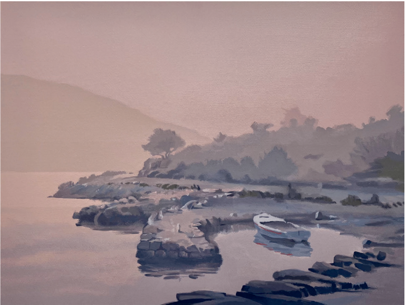
U SIGURNOM ZAGRLJAJU, između 1980. i 2000. serigrafija, 43 × 59 cm

Naslovnica: OSVANULO LIPO JUTRO, između 1980. i 2000. serigrafija, 27 × 41 cm