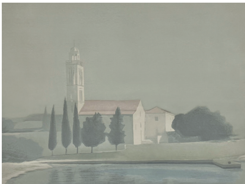
FRANJEVAČKI SAMOSTAN U HVARU, između 1980. i 2000. serigrafija, 51 × 65 cm