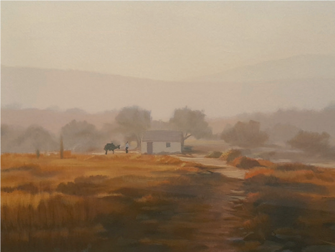
LJETNO JUTRO, između 1980. i 2000. serigrafija, 34 × 46 cm