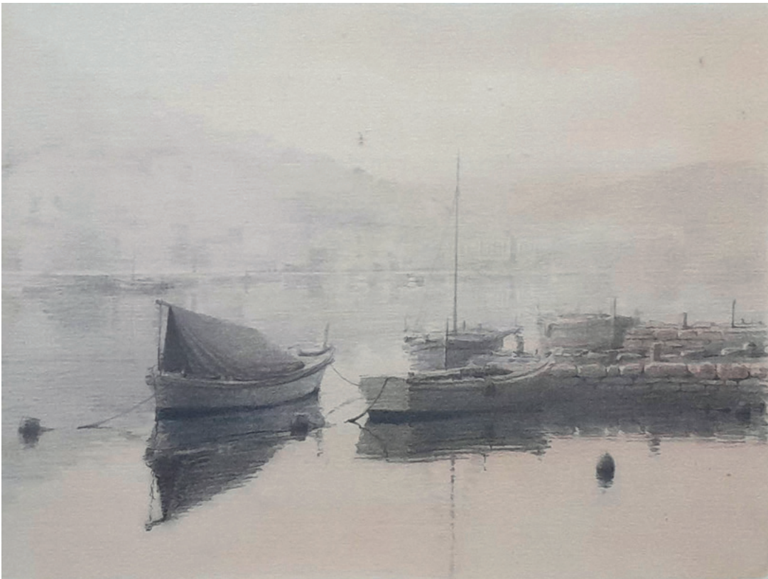
JUTRO U VELOJ LUCI, 1993. kombinirana tehnika, 26 × 40 cm