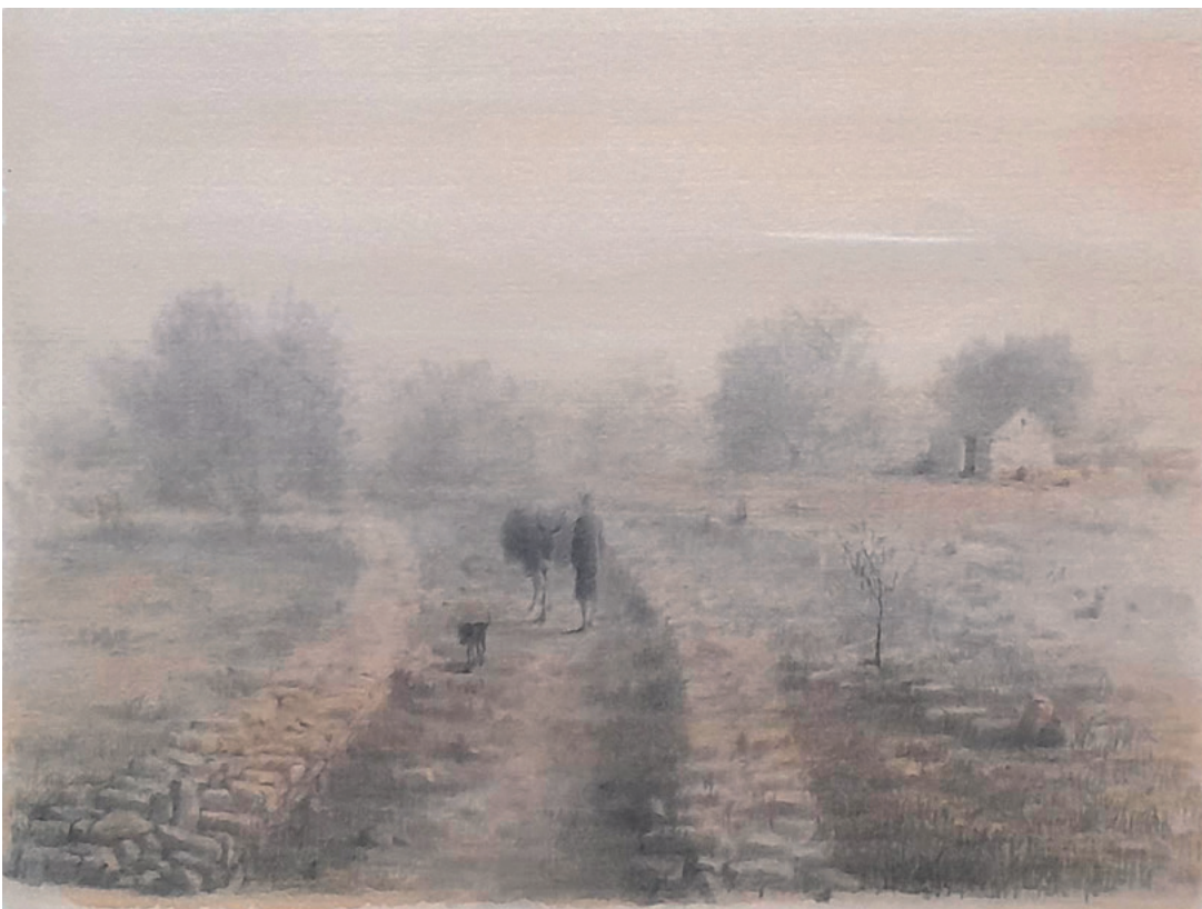
POVRATAK S POLJA, 1989. kombinirana tehnika, 23 × 37 cm