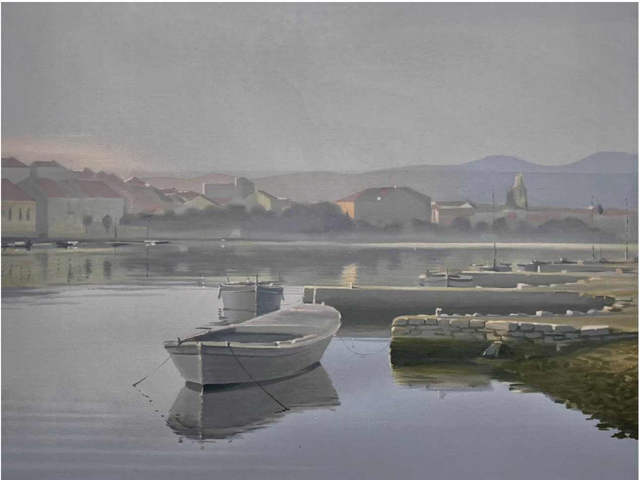
VELA LUKA SE BUDI, između 1980. i 2000. serigrafija, 62 × 79 cm