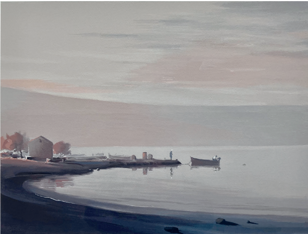
JUTRO PUNO NADE, između 1980. i 2000. serigrafija, 35 × 55 cm