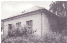
Škola u Glavnici (zagrađena 1928)