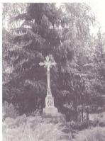
Raspelo s natpisom (ispod špale u Moravču) "Po Ignju Vatroslavu Štajduaru (Štaduaru) iz Moravče"