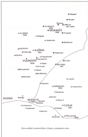
Karta naseljenih i podnaseljenih mjesta u Priroju i pripadajućim selima