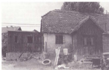
Prva škola u Plavici (1926. godine)