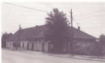
Stara škola u Sesvetama (agradirano 1865.)

posjeda Zagrebačkog kaptola, kojeg su u ondašnjim izvorima nazivali "TERRA CASINA". Tijekom svog postojanja, dugog skoro sedamstogodišnje, bogatog povijesnim i kulturno-povijesnim događajima, školstvo je također imalo veliku ulogu u razvoju ovoga dijela Hrvatske.