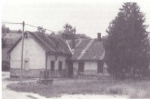
Stara škola u Vugrovcu (zgrajena 1833.)