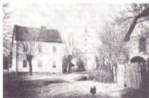
Stara škola u Cerju