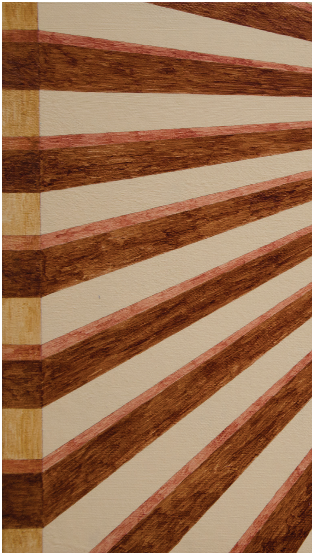
SITNICA, 2022. akrilik na platnu, 30 × 40 cm