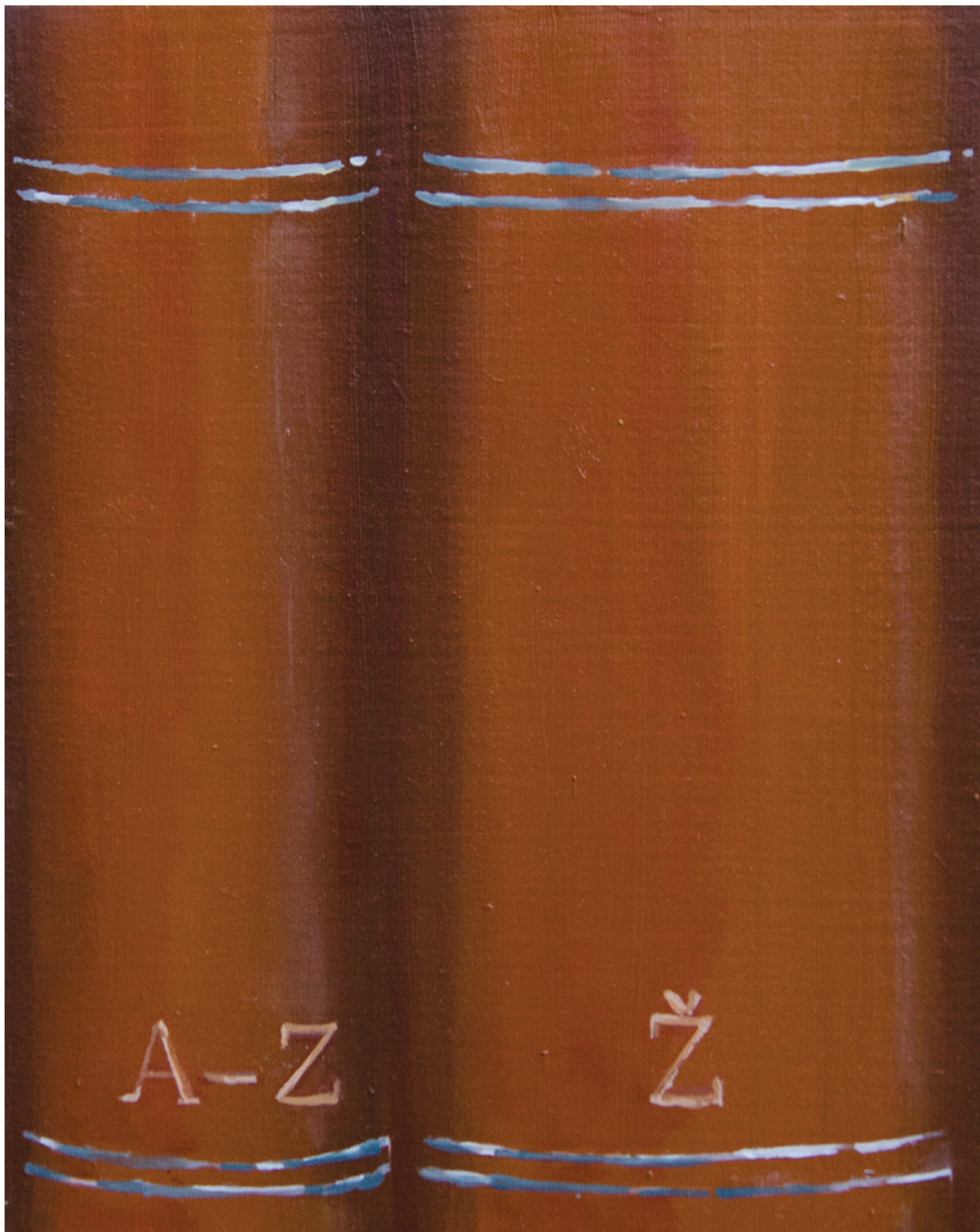
IZ KUĆNE BIBLIOTEKE: A-Z, Ž, 2022. ulje na drvu, 19 × 15 cm