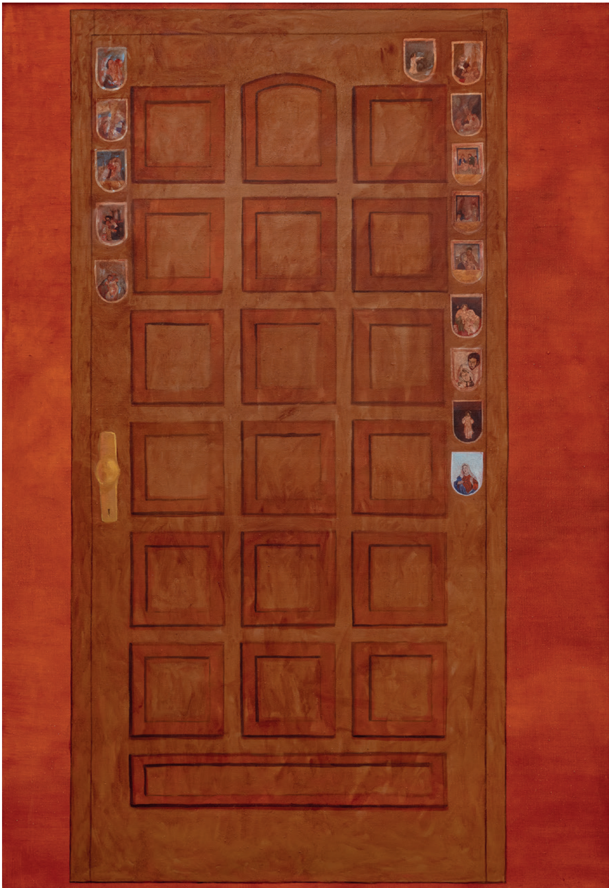
MIR U KUĆI OVOJ, MOŽDA DOGODINE, 2022. ulje na platnu, 190 x 130 cm