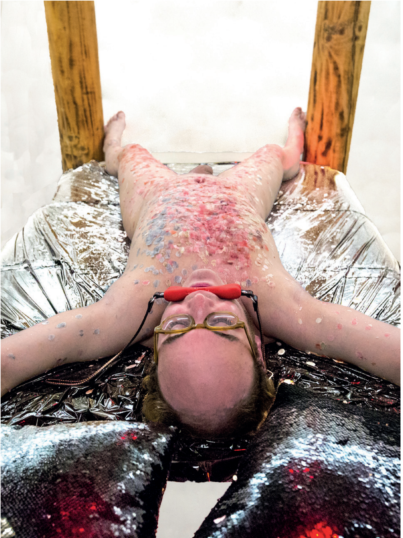
UNSUBSCRIBED, 2022. fotografija, digitalni ispis, 190×141 cm