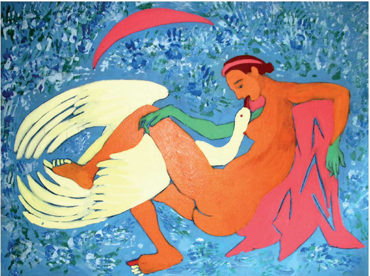
INCEPTION, 2022. ulje i akrilik na platnu, 140 × 190 cm