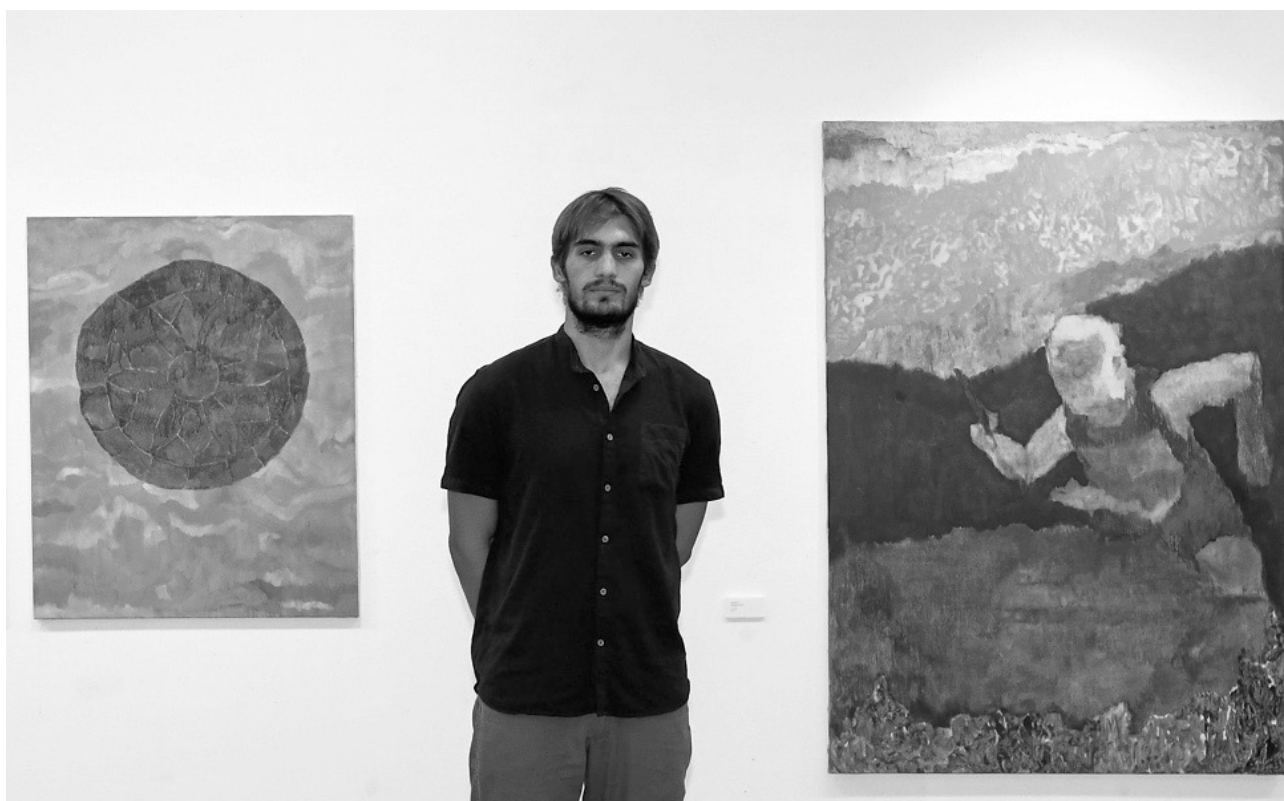
snimio Juraj Vuglač