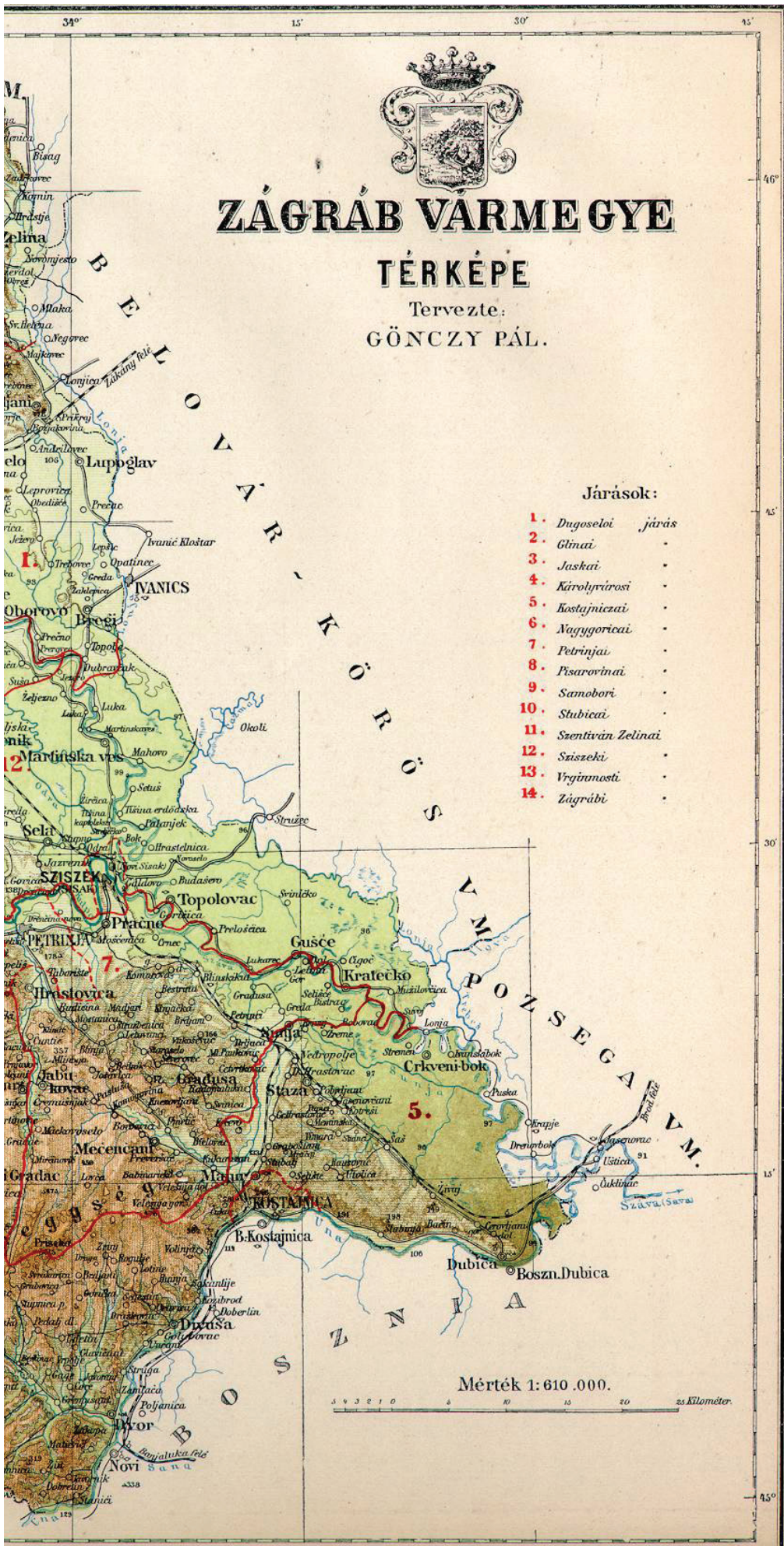
Karta Zagrebačke županije