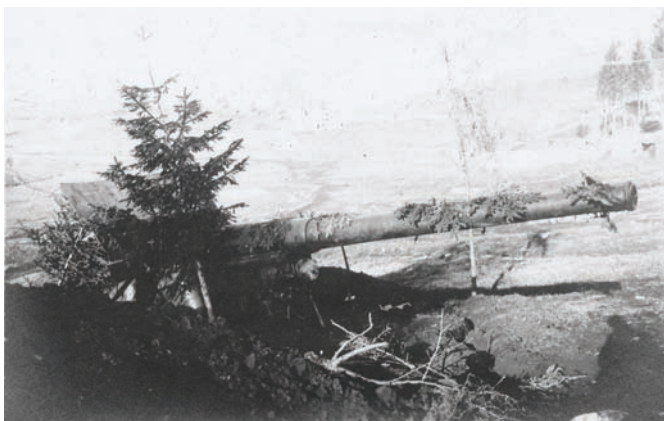
Kamufilirani austrougarski teški poljski top kal. 104 mm Škoda M.1915, talijansko ratište. ZFTA-210.1.

Četvrta godina rata donijela je iscrpljenoj Austro-Ugarskoj Monarhiji ozbiljne unutarnje probleme. Dugotrajni rat izazvao je opće nezadovoljstvo što je kulminiralo u jesen 1918. raspadom dotadašnje vlasti širom zemlje. Nemiri koji su zahvatili Hrvatsku u danima nestajanja Austro-Ugarske Monarhije, naročito nakon proglašenja Države SHS, zahvatili su i Sesvet-