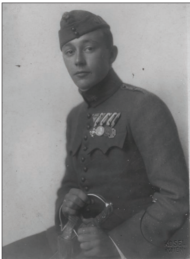
Odlikovani poručnik ulanske pukovnije, Beč, 1918. ZFTA-833.3.

„tako oduševljeno pljeskalo vojsci na polasku na bojište. (...) Jer rat je ipak manje-više u sve unio osjećaj nesigurnosti, prekinuo stalozhen i udoban život. Rat se prvih tjedana još nije osjećao s neugodne strane...“ 7