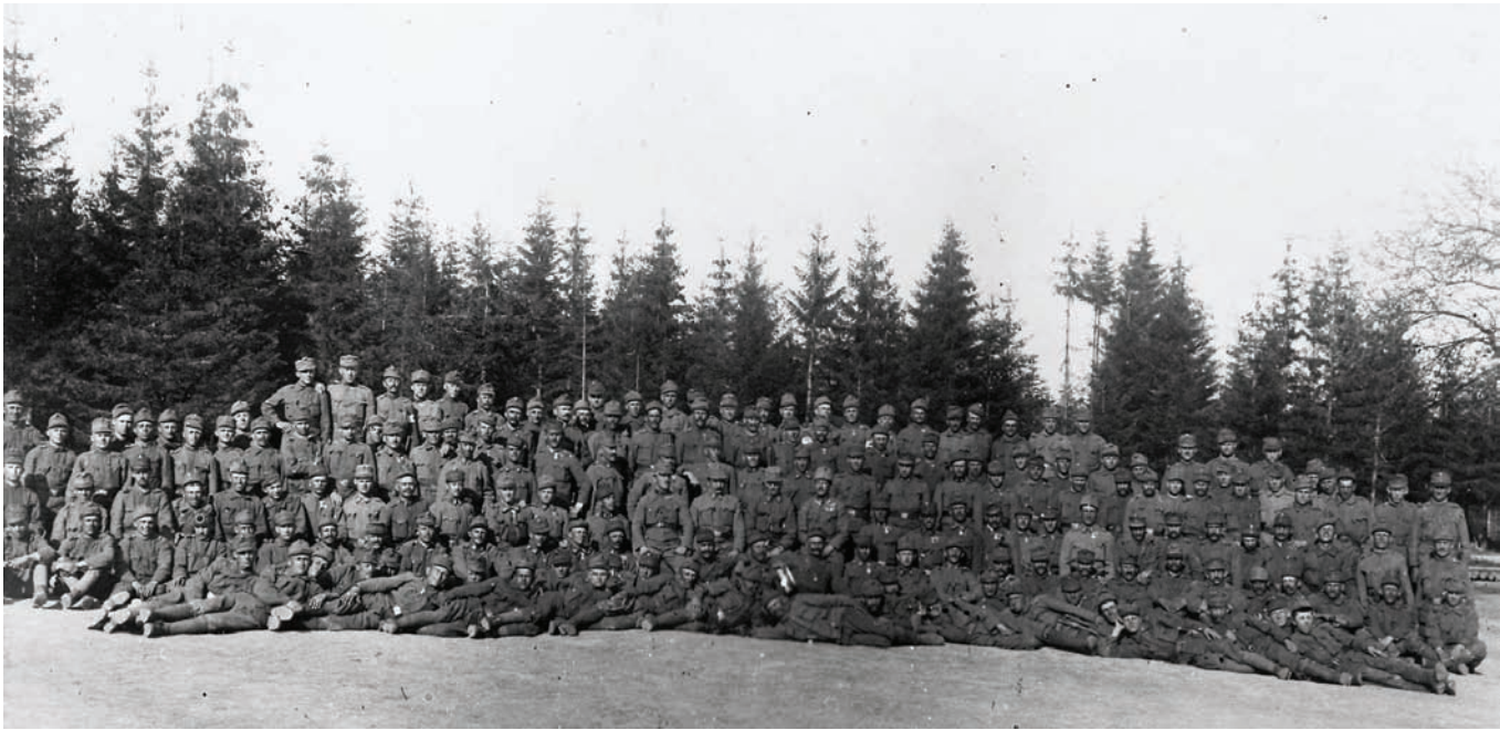
Pripadnici 53. pješačke pukovnije na ruskom ratištu, 22. svibnja 1917. ZFTA-248.3.

kraljevine Hrvatske, Slavonije i Dalmacije od 11. studenog 1915. pokrenuta akcija prikupljanja novčanih priloga za božićne darove za vojnike na bojištu. Na području Zagrebačke županije pučke i ostale škole skupile su za Božić 1915. 3621 krunu i 25 filera. Od toga je pučka škola u Sesvetama skupila 10 kruna i 76 filera, a škola u Belovar – Moravču 5 kruna. 31 Pri skupljanju novčanih priloga posebno su se istakli stanovnici općine Kašina, njih 295, koji su uspjeli skupiti 215 kruna i 40 filera 32 , a općinsko poglavarstvo Moravče – Belovar odaslalo je 100 kruna. 33