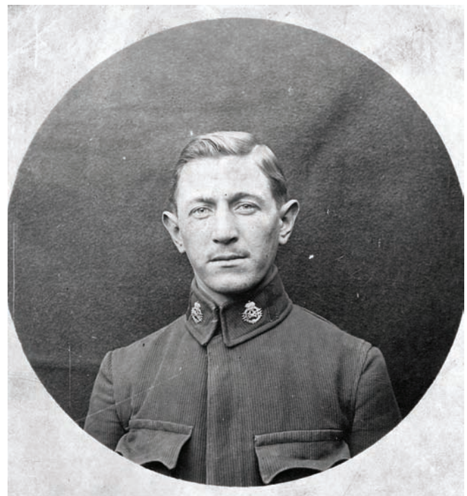
Telegrafist 16. satnije 16. pješačke pukovnije odjeven u bluzu od koprive. ZFTA-222.6.

Sljedeća akcija pokrenuta od strane vojnih ureda prikupljanje je vune i kaučuka. 49 U listopadu 1915. kraljevsko ugarsko ministarstvo za zemaljsku obranu pozvalo je preko zemaljske vlade, odjela za bogoštovlje i nastavu, sve srednje, stručne te niže i više pučke škole da pokrenu sabiranje stvari od vune i kaučuka u ratne svrhe. 50 Pučka škola u Sesvetama odazvala se akciji te