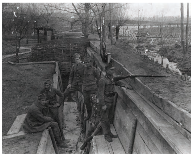
Utvrđeni i uređeni rovovi 42. domobranske divizije na ruskom ratištu, 1. svibnja 1917. ZFTA-872.

neprestanih kiša te će se naknadno zasijati ostala površina. 14 Osim toga, tražene su i informacije o posijanim veleposjedima iznad 500 rali. Na području Sessvetskog prigorja jedino je kaptolski veleposjed Kraljevec imao preko 500 rali. 15