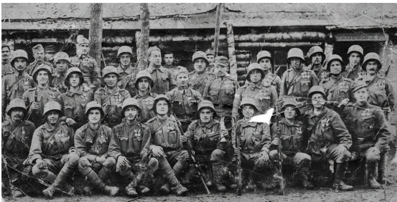
Jedna hrvatska postrojba na ruskom ratištu, 1917. ZFTA-2046.1.