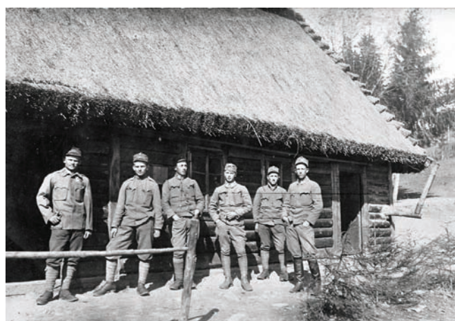
Pripadnici 8. čete 53. pješačke pukovnije ispred kolibe u Galiciji, svibanj 1917. ZFTA-248.5.

stva od početka ovoga mjeseca ostao bez kruha i trpi glad, koji mu smanjuje radnu njegovu snagu. (...) I u vugrovačkom kraju općine Kašina ljudi već gladuju, pa bi trebalo i općini Kašini doznačiti barem još 1 vagon kukuruze.“ 27 I kašinski župnik Milan Hok, kao član aprovizacijskog odbora općine Kašina, uputio je žalbu u lipnju 1917. velikom županu zagrebačke županije zbog nepravedne podjele kukuruza između triju kotarskih općina. Općina Kašina i Moravče – Belovar dobi- le su po 1 vagon kukuruza, a općina Sv. Ivan Zelina 2 vagona. 28 Odmah potom kašinskoj općini dostavljeno je 2 vagona kukuruza. 29 I u općini Sesvete zbog nestašice agrarnih proizvoda potrebe za kukuruzom bile su velike. U prvih šest mjeseci 1917. dostavljen je ukupno 31 vagon kukuruza. 30