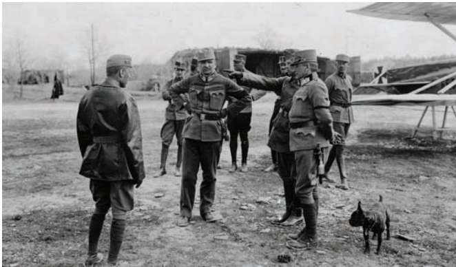
Zapovjednik RZHM (Ratnog zrakoplovstvo Habsburške monarhije – Luftfahrtruppen – Lft), pukovnik Milan-Emil Uzelac obilazi zrakoplovne postrojbe na sočanskom frontu (prosinac 1916.). Časnici nose crni flor oko rukava u znak žalosti za pokojnim carem Franjom Josipom I. koji je preminuo 21. studenog 1916. ZFTA-965.

na konjska bolnica. 85 Oružnička postaja u Sesvetama javlja Narodnom vijeću SHS u Zagreb „da je konjska bolnica pokradena, ali da je Narodna straža uspostavila