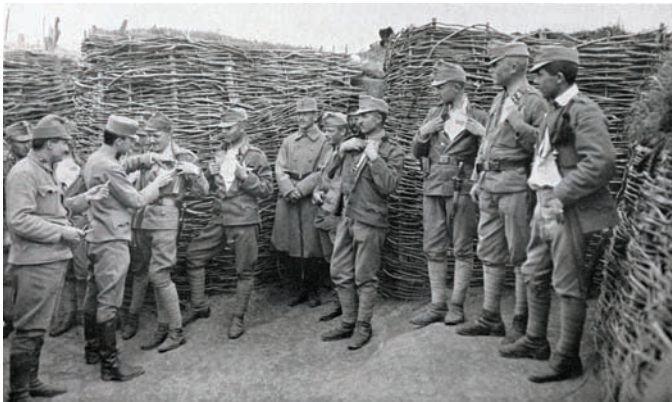
Cijepljenje protiv kolere u streljačkom jarku ugarske domobranske pješačke pukovnije, Unsere Krieger Bilder aus groszer Zeit , br. 31, 1916., str. 492.

Iako je epidemija dizenterije prouzročila veliki gubitak stanovništva, ipak je španjolska gripa, koja je 1918. i prvih mjeseci 1919. poharala cijeli svijet, imala pogubnije posljedice za stanovništvo Sesevskog prigorja. Ova epidemija smatra se po broju oboljelih najopsežnijom zarazom u dosadašnjoj hrvatskoj povijesti budući da je zahvatila i do 90 % stanovnika Hrvatske. Izbila je i proširila se iz američke vojne baze u Kansasu u travnju 1918., a prenesena je u Europu preko američkih vojnika. Čini se kako su i u Hrvatskoj, kao i u ostatku svijeta, vojnici bili izvor epidemije. U Sesevskom prigorju španjolska gripa pojavila se u rujnu 1918., a puni vrhunac dosegla je u drugoj polovini studenog i prvoj polovini prosinca 1918. godine. Zanimljiv je izvještaj kraljevskog županijskom fizika (liječnika) dr. Julijana Valjavca koji je 14. listopada posjetio općinu Kašina. U izvještaju dr. Valjavec navodi: Prošavši sela Kućanec, Vugrovec, Goranec i Prekvršje, župa