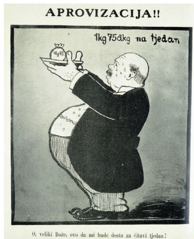
Ilustrovani list, br. 41, 9. listopada 1915., str. 984.

Briga o opskrbi i prehrani civilnog stanovništva tijekom Prvog svjetskog rata predstavljala je jedno od važnijih pitanja u Austro-Ugarskoj Monarhiji. Da bi podmirile osnovne životne potrebe stanovništva, vlasti su provodile aprovizaciju. 19 Na području Sessvetskog prigorja osnovani su općinski aprovizacijski odbo-