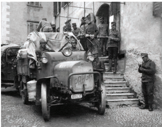
Austrijska transportna vozila na sočanskoj fronti, 1917. ZFTA-838.3.

u drugom tjednu prosinca 1918. broj umrlih penje na 264 osobe. 71