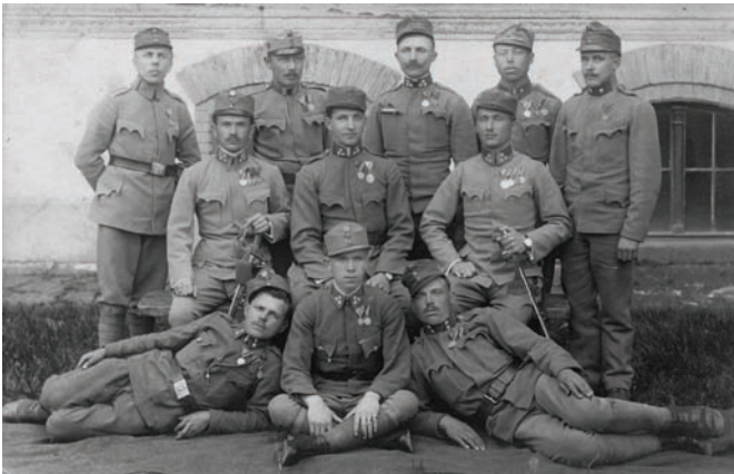
Odlikovani dočasnici 53. pješačke pukovnije, Rudolfova vojarna - Zagreb, 1917. ZFTA-990.2.

a druga polovica obitelji mobiliziranih vojnika iz upravnih općina Sesvete, Vrapče, Šestine, Sela kod Siska i Varaždinske Toplice. 41 Katolička crkva poticala je na aktivnosti i župe koje su nerijetko skupljale novčane priloge. Okružnicom zagrebačkog nadbiskupa Antuna Bauera od 10. kolovoza 1914. prikupljeni su prilozi u crkvama „za obitelji vojnika ostavljene u biedi i nevolji.“ 42 Kašinska župa uspjela je prikupiti 3 krune i 76 filera, a župa u Moravču 3 krune. 43 Župne akcije prikupljanja novčanih priloga trajale su do kraja rata 1918.