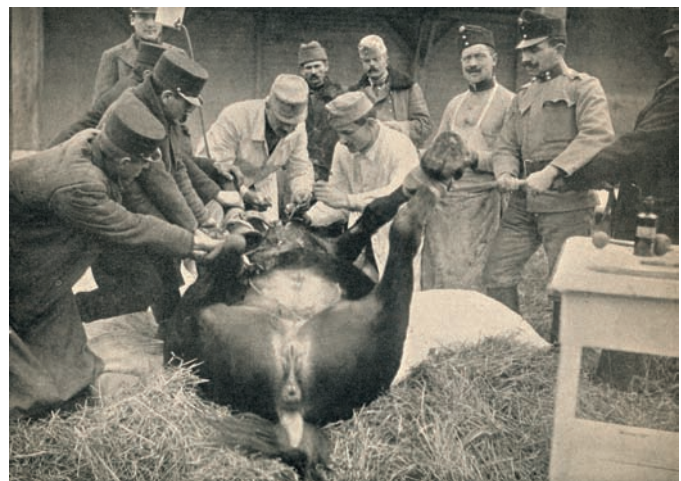
Odstranjenje metka iz ranjenog konja (bolnica konja Karád - Mađarska), Unsere Krieger Bilder aus groszer Zeit , br. 14, 1916., str. 223.

U nemirnim danima koji su slijedili incidenti su se učestalo događali u Vugrovcu zbog pustošenja šume zagrebačke nadbiskupije i zemljišne zajednice. Predvodnici seljačkog bunta bili su vojnici povratnici koji