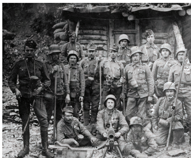
Hrvatski domobranci na talijanskom ratištu, 1918. ZFTA-503.

vjerenstva ustanovila količinu koja će biti stavljena pod zabranu, odnosno rekvirirana. Iz arhivskih izvora saznajemo da je već na početku rata, u kolovozu 1914., zemaljska vlada tražila podatke od kotarskih oblasti o raspoloživim zalihama zobi, pšenice, raži i ječma. 9 Kotarska oblast u Sv. Ivanu Zelini podnijela je iskaz o zalihama: selo Šašinovec je imalo 6 q 10 ječma, Cerje 10 q pšenice i 3 q raži, Blaguša 10 q zobi, Planina 12 q pšenice i 3 q ječma te Kučilovina 6 q ječma. U istom iskazu zanimljiva je napomena „da izkazana količina žita, nije niti približno dovoljna za prehranu ovopodručnog žiteljstva, koje se bavi većim djelom vinogradarstvom i stočarstvom. Žito većim djelom kupuje, dok vina ima u izobilju.“ 11 U arhivskim izvorima nismo uspjeli saznati jesu li navedene zalihe rekvirirane. Međutim, krajem 1915. vlasti su stavile pod zabranu 176 q kukuruza u općini Kašina i 1104 q kukuruza u općini Sesvete. 12 Pred kraj rata počela su se osnivati i mjesna povjerenstva koja su rekvirirala žitarice na licu mjesta. Tako je u srpnju 1917. u općinama Kašina i Moravče – Belovar imenovano četveročlano povjerenstvo koje je moralo u što kraćem roku provesti rekviziciju žitarica. 13 Vlasti su se zanimale i za količinu zasijanih površina usjevima. U siječnju 1916. tajnik kotarske oblasti u Zagrebu izvještava vladinog povjerenika za zagrebačku županiju da je u općini Sesvete bila određena površina od 300 rali za zimske usjeve, ali je zasijano samo 160 rali zbog