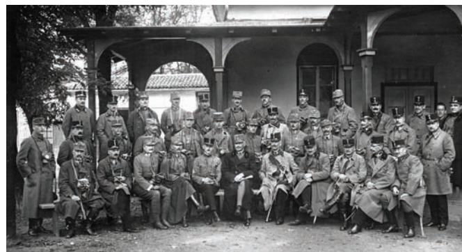
Skupina viših i nižih časnika habsburške vojske na tečaju upoznavanja s djelovanjem i upotrebom zaštitne maske protiv bojnih otrova, 1915. ZFTA-2018.1.

poteškoćama susretale obitelji mobiliziranih vojnika. Možemo samo zamisliti što se događalo sa ženama i djecom čiji bi muževi – očevi poginuli ili nestali na ratištu.