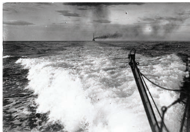
Flota RMHM bježi prema sigurnosti kotorske utvrde. ZFTA-642.6

Sesevski je kraj zbog konfiguracije terena privlačio i mnogobrojne vojne bjegunce iz susjednih mjesta.