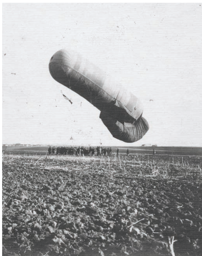
Uzljetanje austrougarskog izviđačkog balona tipa Drachenballon negdje na istočnoj bojišnici tijekom 1915. ili 1916. godine. U početku je glavna svrha zrakoplovstva bila u izviđanju neprijatelja i korekciji artiljerijske paljbe. ZFTA-2075.

u zemlji njima su se pridružili i brojni osiromašeni seljaci koji su željeli poboljšati svoj socijalni položaj.