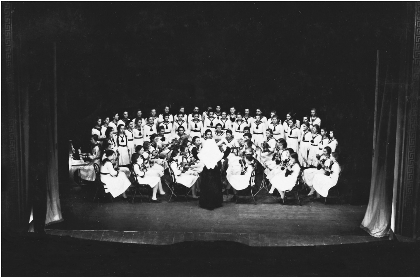
Pjevački zbor i mandolinski kvintet učenica Ženske građanske škole sestara milosrdnica, 1938. | 72