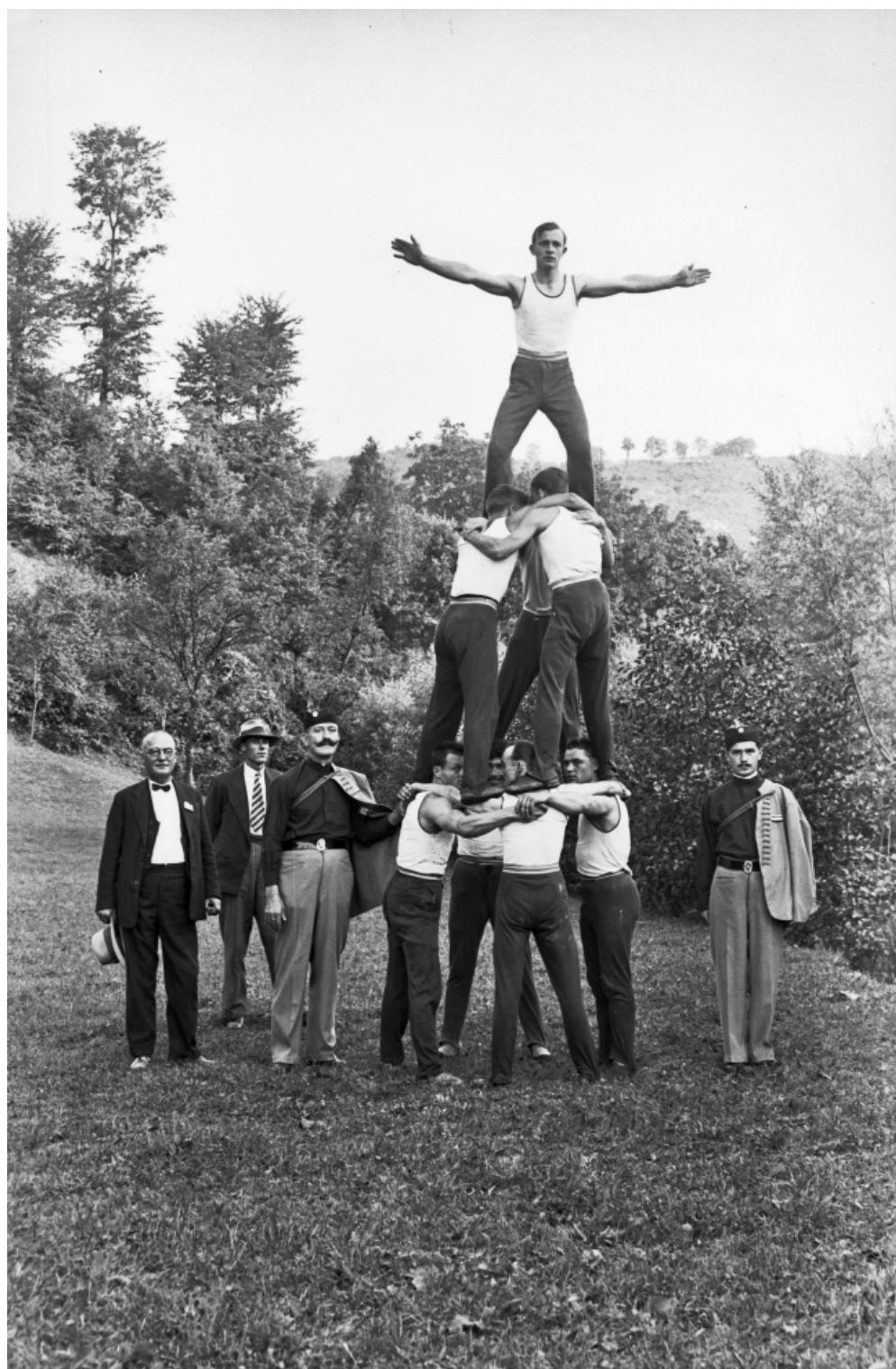
67 | Vježbači Hrvatskog sokola Sesvete, prije 1930.