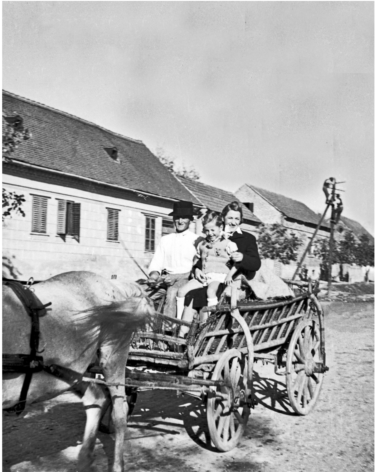
49 | Mobilna obitelj, sredina 1930-ih