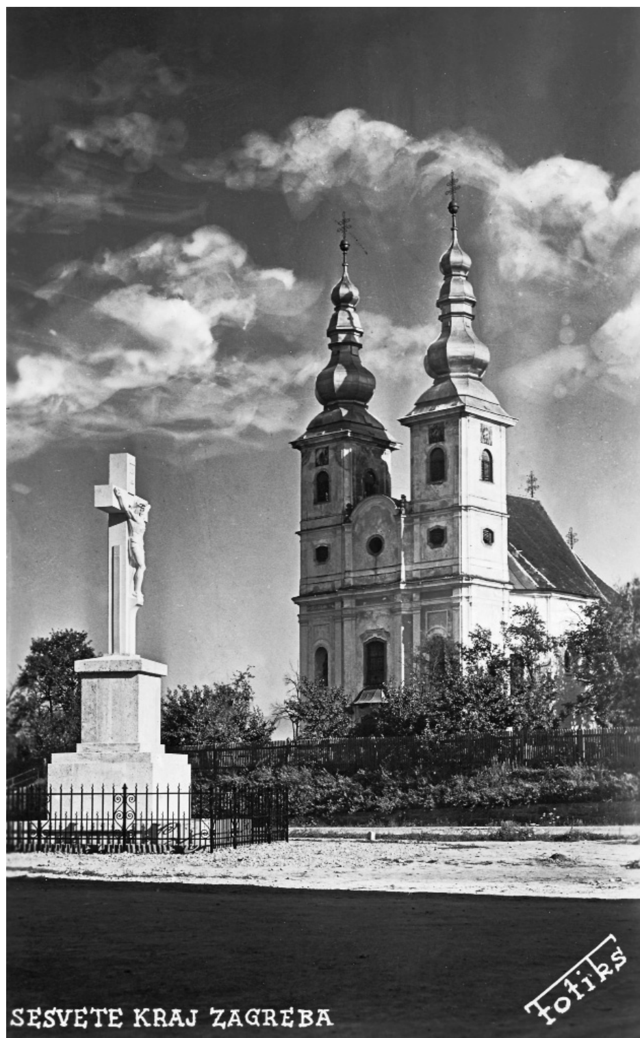
75 | Središte Sesveta, 1944.