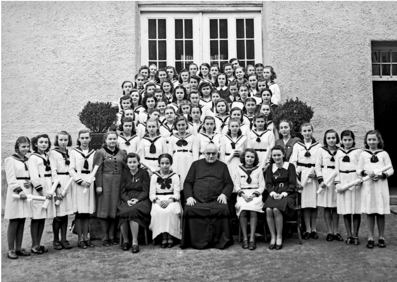
Učenice Ženske građanske škole sestara milosrdnica, 1940. | 52