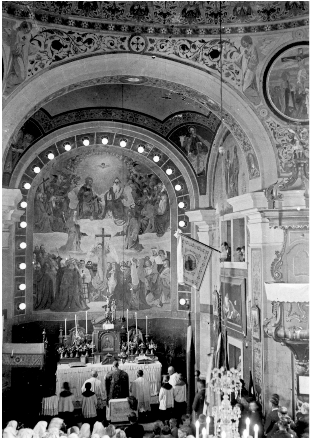
45 | Glavni oltar crkve Svih Svetih, 1938.