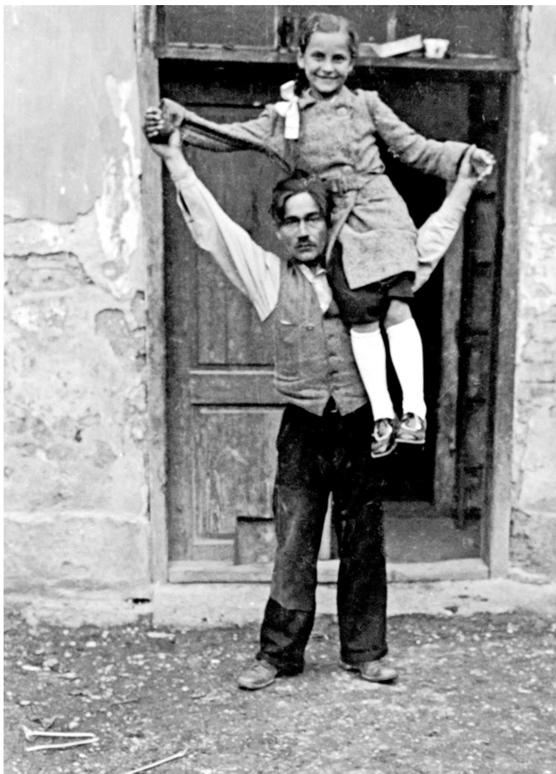
27 | Djevojčica na očevu ramenu, 1930-ih