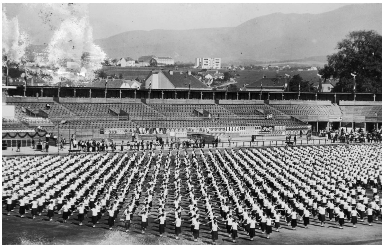
69 | Generalna proba za Sokolski slet u Zagrebu, 1934.