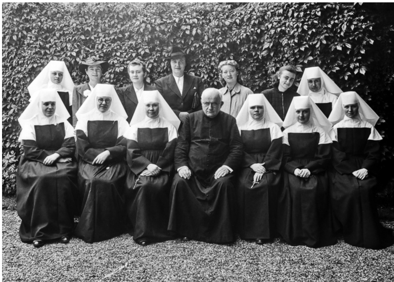
53 | Nastavničko osebje Ženske građanske škole sestara milosrdnica, 1940.