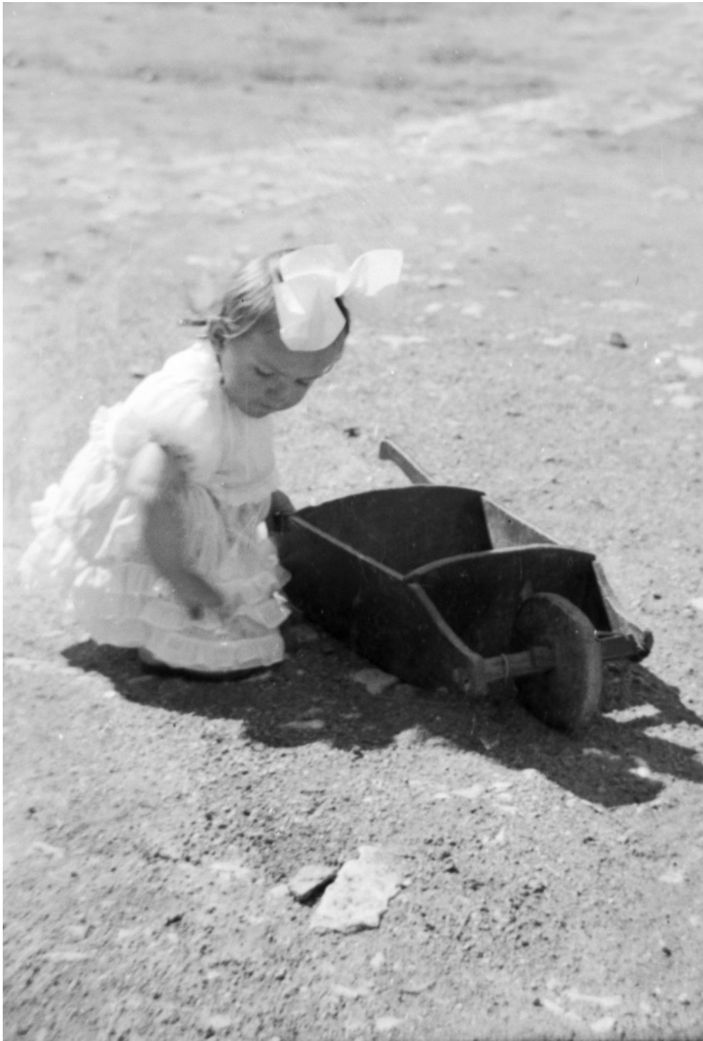
Djevojčica s kolicima, sredina 1930-ih | 22