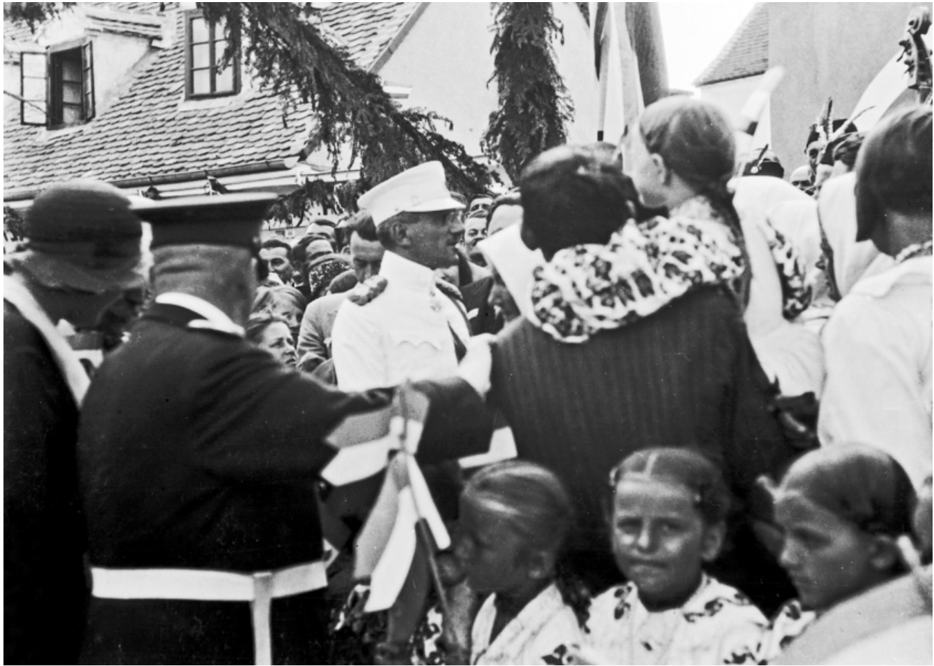
39 | Kralj Aleksandar I. Karađorđević sa Sesvećanima, 1. lipnja 1931.