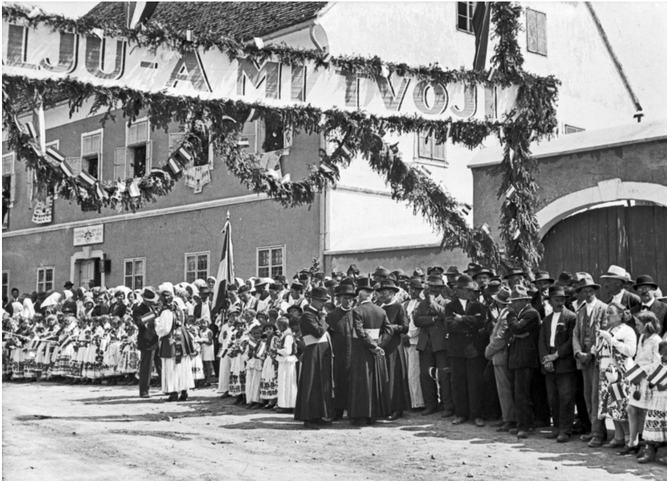
Velikodostojnici s narodom čekaju kralja Aleksandra I. Karađorđevića, 1. lipnja 1931. | 36