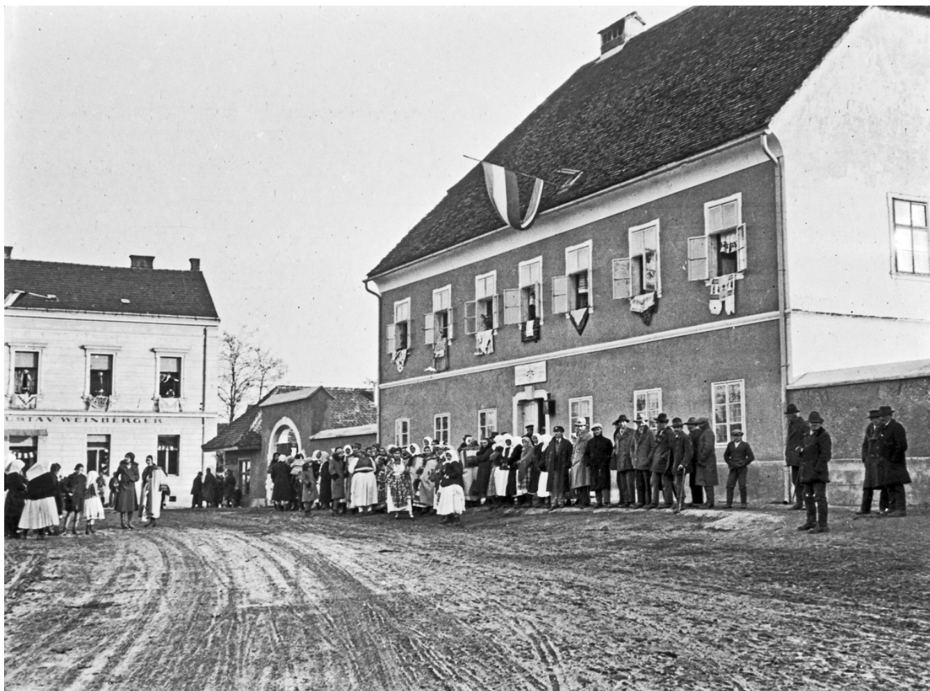
Sesvećani ispred sjedišta sesvetske Općine, sredina 1930-ih | 40