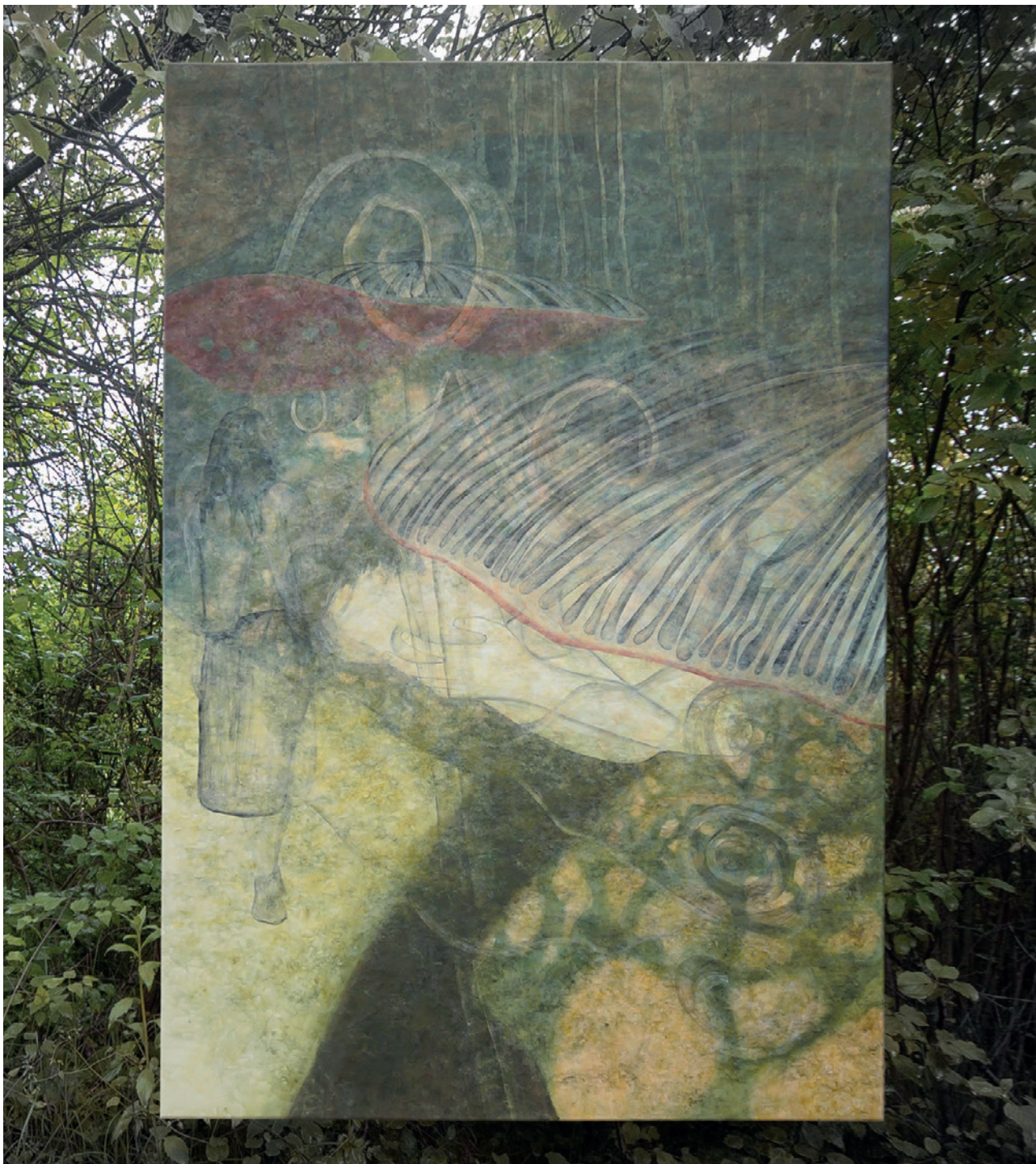
Kći nečastivog – Buđenje Trnoružice, 2023., akrilik na platnu, 220 × 150 cm

Treća je nastala slika Buđenje Trnoružice (poglavlje Kći nečastivog), vezana uz sljedeći citat: „ Ono što je dugo spavalo, začarano, vratiti se može u zagrljaj jave samo najnježnijom glazbom čulnosti, najtišom bijelom meditacijom živih.... “ (str. 67). I dok je Parunova ovdje zapravo problematizirala uskraćivanje budnosti u jednom čitavom društvenom razdoblju, Sanela Đurinec Raič oslikava