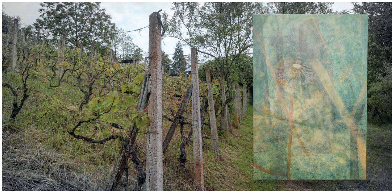
Pogreška iz ljubavi – Poruka cvjetne čaške, 2023., akrilik na platnu, 220 × 150 cm

Izložba je ostvarena sredstvima Gradskog ureda za kulturu i civilno društvo Grada Zagreba i Ministarstva kulture i medija Republike Hrvatske