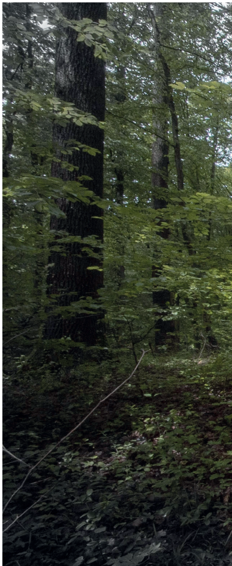
Prijetim dakle postojim – Ptičja strašila , 2023. akrilik na platnu, 220 × 150 cm

Druga slika nastala je inspirirana esejem Ptičja strašila (unutar poglavlja Prijetim, dakle: postojim! , str. 95-96.), odnosno njegovim sljedećim rečenicama: „ Taj najšaljiviji vid prijetnje na ovoj zemlji – ptičje strašilo – star je valjda koliko i oruđe na prelasku iz nomadske ere u sjedilačku poljoprivredu....Prijeteći pticama čovjek se, ustvari domislio kako se može ista taktika primijeniti i na društvena bića. Zašto pustiti podanike na miru kad ih možeš na tisuću načina plašiti, ugrožavati, prijetiti im, ometati im san, zaustavljati korak?... “ Nema sumnje da je ovo opisivanje i razumijevanje fenomena prijetnje u ljudskom društvu bilo istoznačno i za književnicu nekada (posebice Parunovu koja je živjela i stvarala izvan institucija) i za umjetnicu danas, kad su prijetnje i strahovi umnoženi do neslučenih razmjera putem medija i društvenih mreža. Tom strahu se treba oduprijeti i onaj ležeći portret, čiju polovicu lica razaznajemo, dok je druga rastvorena košmarom razmišljanja. Veo od blijede crvene tkanine svakako štiti od prijetnji.