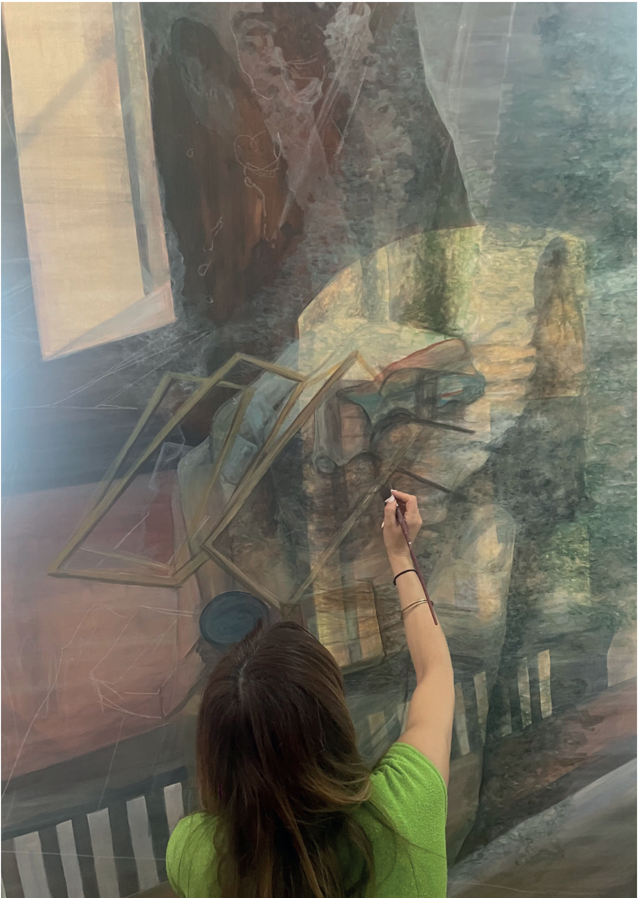
Sanela Đurinec Raič dovršava sliku Neostvorena – Rastanak, 4. travnja 2024.