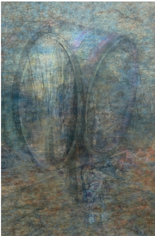
Neostvarena – Popodnevno odmaranje, 2023. akrilik na platnu, 220 × 150 cm

Tek početkom 2024. godine, kada su život i nagnuće to dozvolili, počela je nastajati sedma, završna slika ciklusa, koju po prvi puta pokazujemo upravo u Muzeju Prigorja. Uporište je nađeno u pjesmi u prozi Rastanak , unutar skupa Neostvarena , a koja započinje ovako: Ima svijetlih i tamnih rastanaka, kao što ima svijetlih i tamnih oblaka (str. 288). Kako bi osvjetlila svoj osobni proces rastanka, Sanela je napokon uzela kist u ruke i naslikala završnu kompoziciju, jasno građenu na motivima arhitekture iz sjećanja, ali i (naslućenih) bolnih iskustava, istom zahtjevnom tehnikom dugog slikanja. Ona jest tamna i ne koristi boje iz prirode koja okružuje i tješi, ali svjetlo ipak u nju dolazi kroz otvorena vrata i pada na tamne krhotine ljudskog propitivanja i kidanja veza.