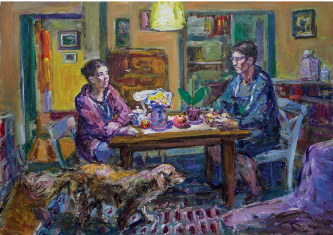
Interijer, 2020., akril na platnu, 70 x 100 cm