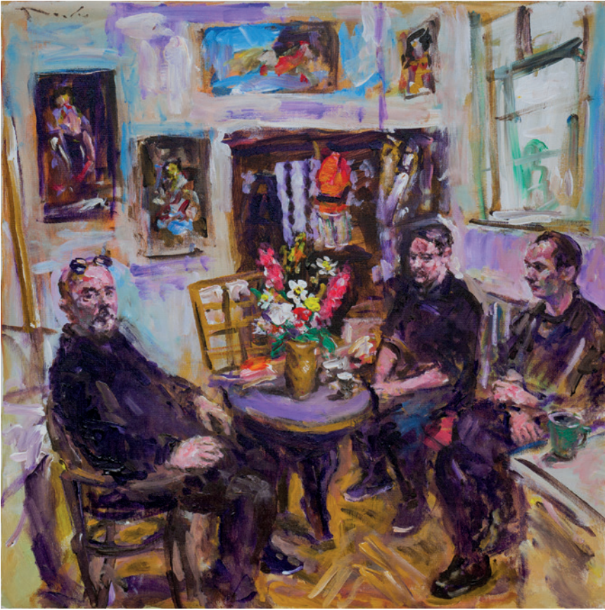
Jure, Duje, Borna, 2021., akril na platnu, 80 × 80 cm