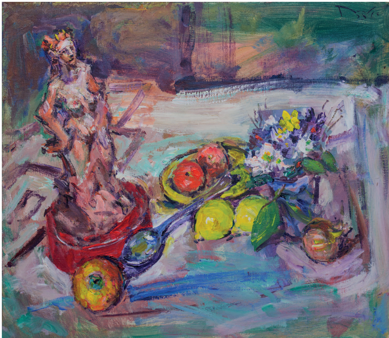
Mrtva priroda, 2022., akril na platnu, 50 × 60 cm