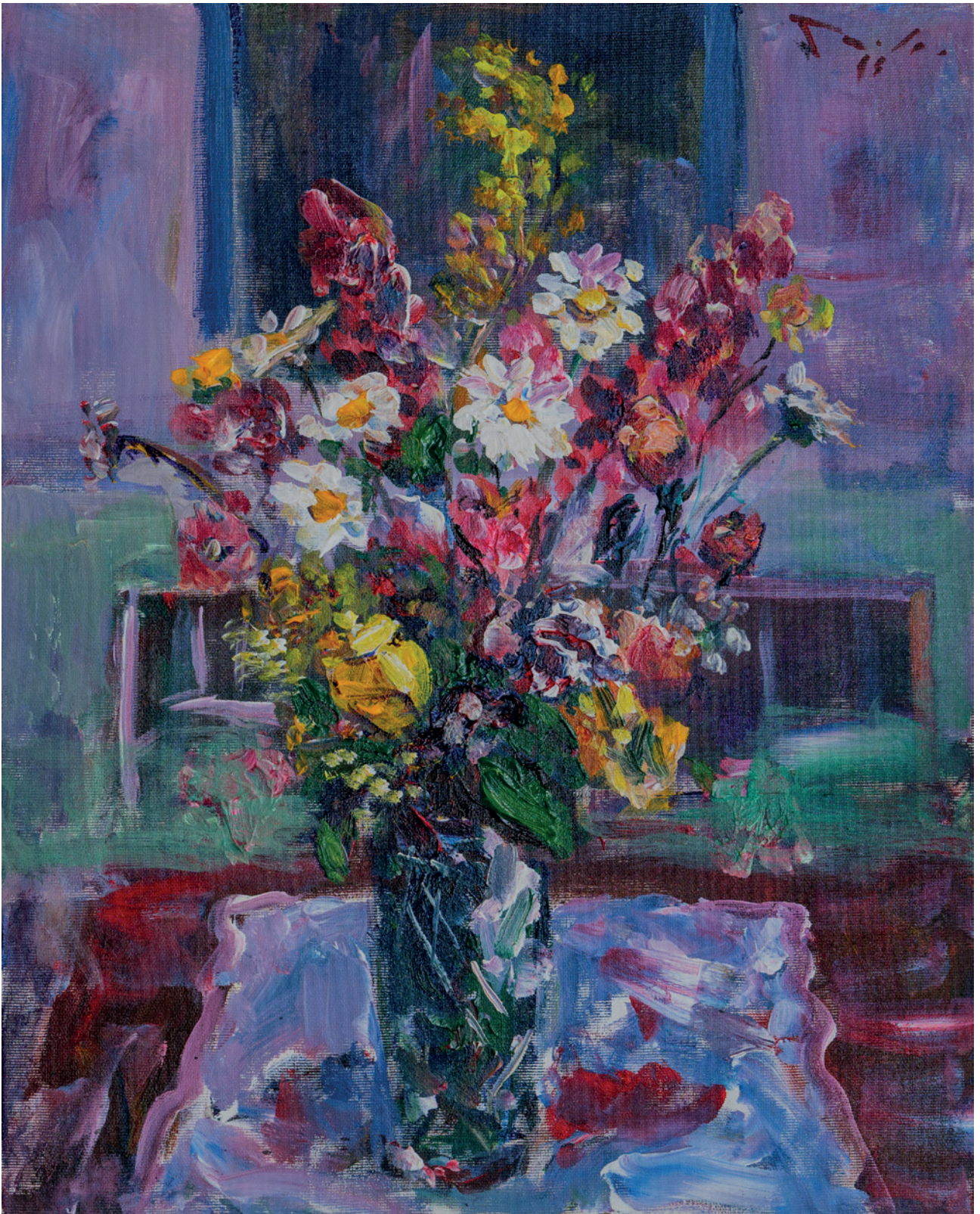
Cvijeće, 2018., akril na platnu, 50 × 40 cm