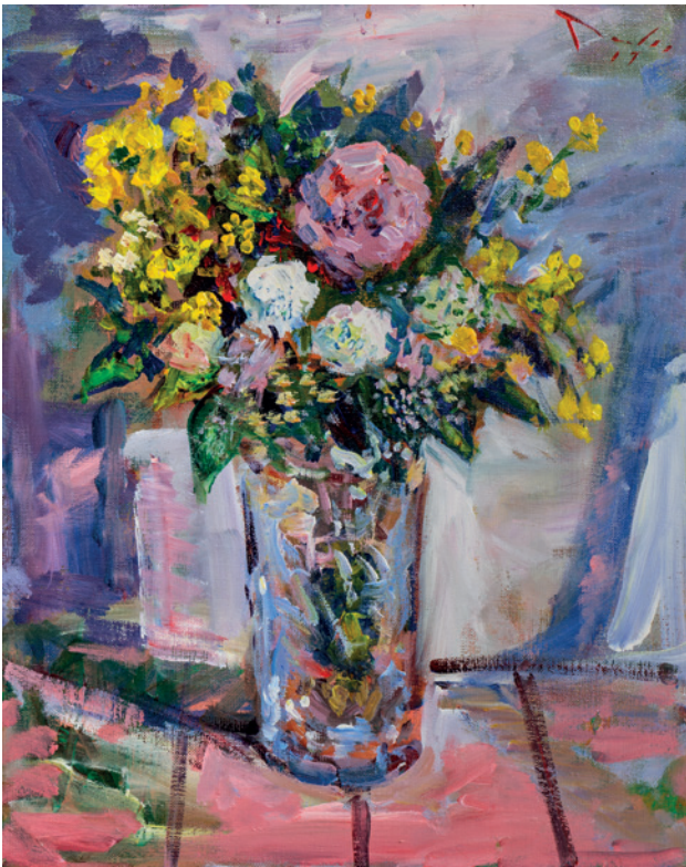
Cvijeće, 2019., akril na platnu, 60 × 50 cm

senzibiliteta, slikama često neosporne umjetničke strasnosti. Radić živi, a ne samo da slika sliku. Neovisno o tome radi li se o krokiju trenutka ili o većoj kompoziciji s mnoštvom likova. Ekspresija prizora može biti i eruptivna i pri-tajena, ovisna i o dramaturgiji neke adrese.