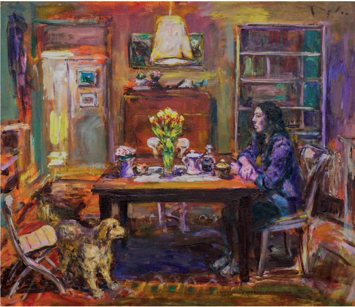
Interijer, 2020., akril na platnu, 50 x 60 cm