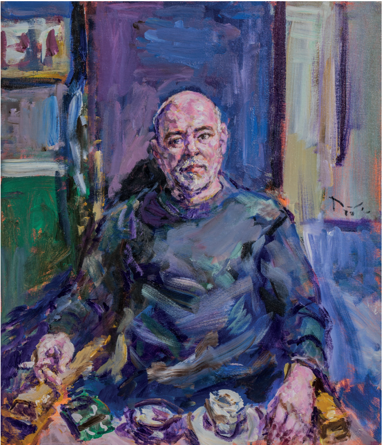
Jure, 2020., akril na platnu, 80×60 cm