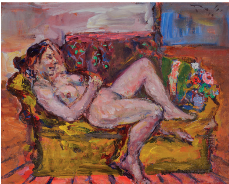
Akt, 2019., akril na platnu, 30 × 40 cm