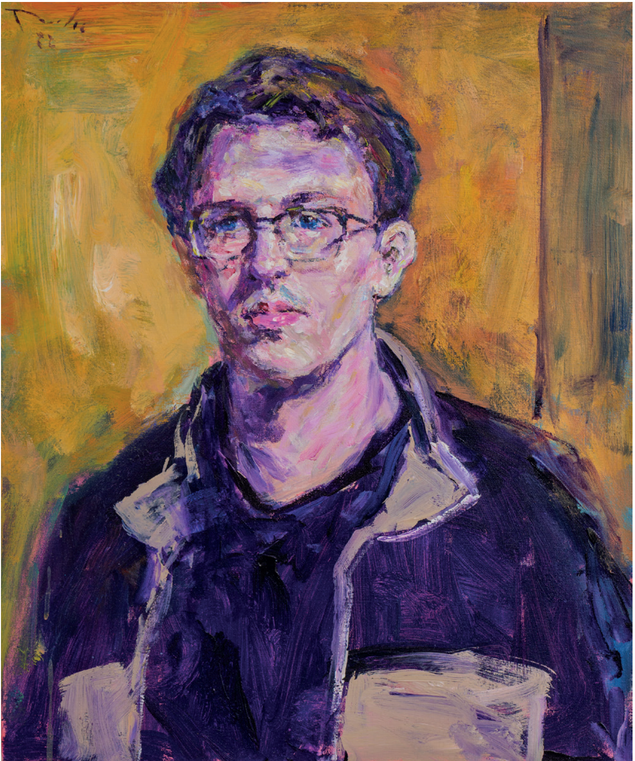
Juraj, 2022., akril na platnu, 60 × 50 cm