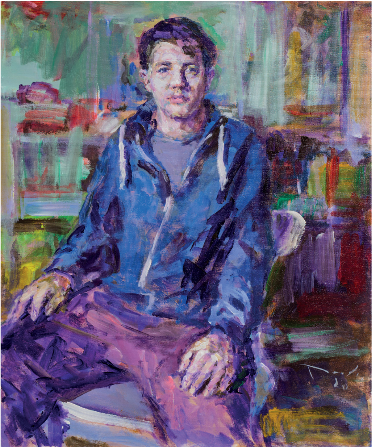
Juraj, 2020., akril na platnu, 60 × 50 cm