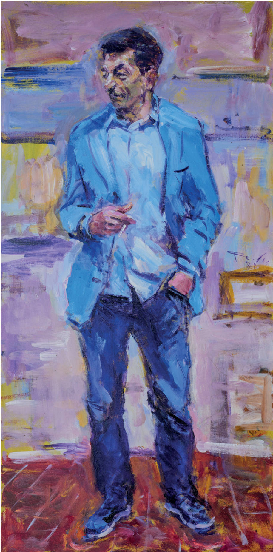
Pero, 2020., akril na platnu, 100 × 50 cm