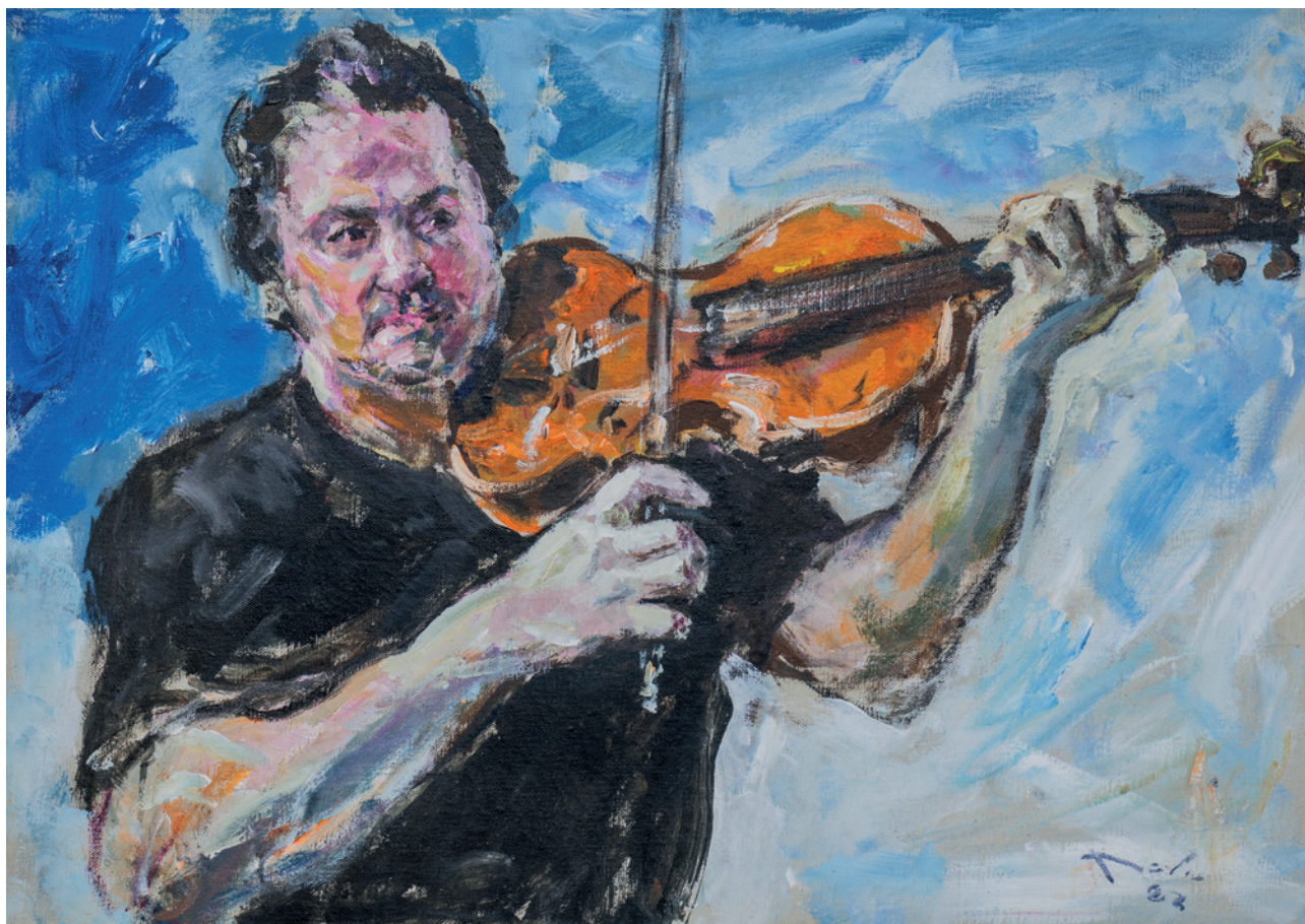
Orest, 2022., akril na platnu, 50 × 70 cm