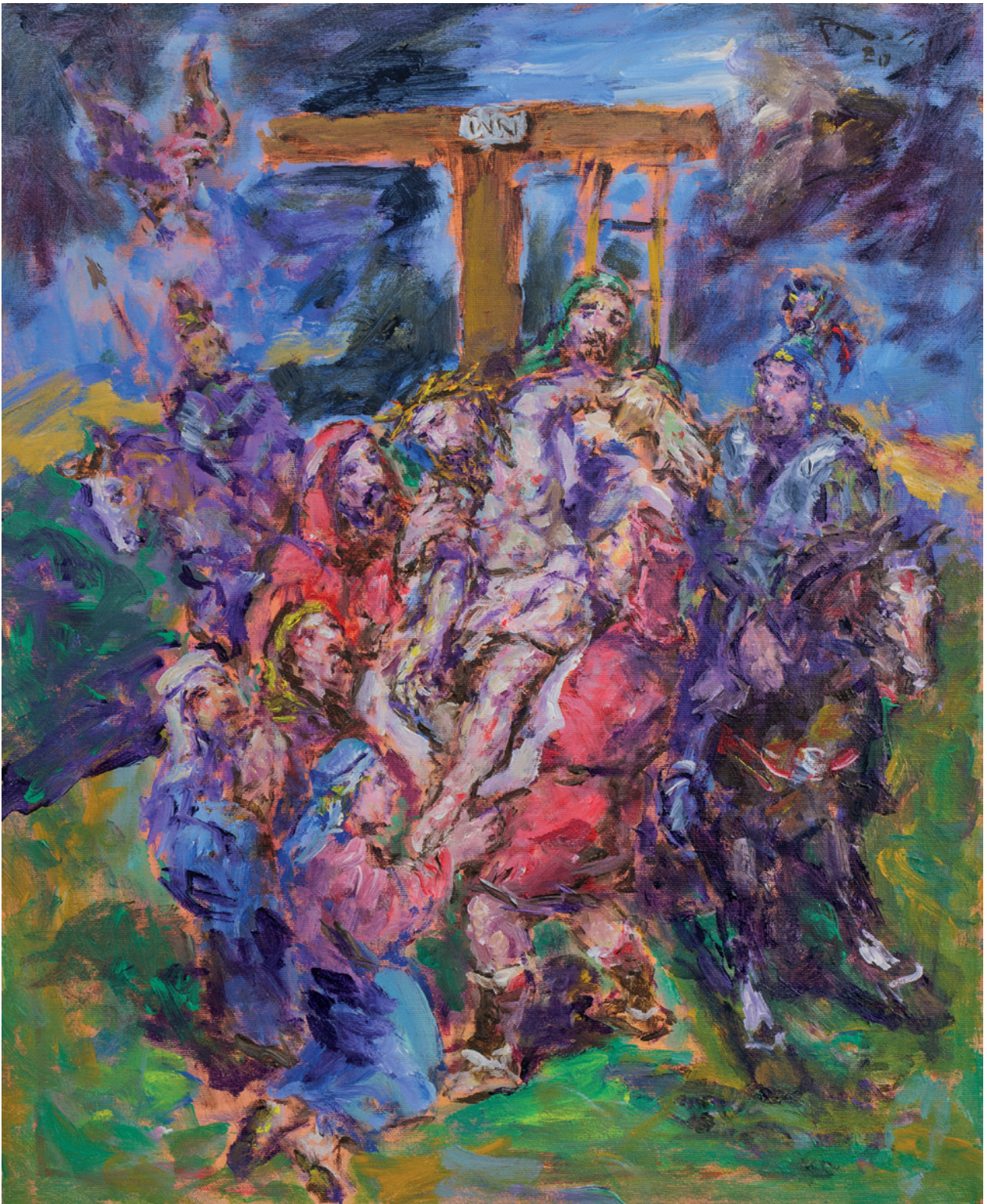
Skidanje s križa, 2020., akril na platnu, 60 × 50 cm