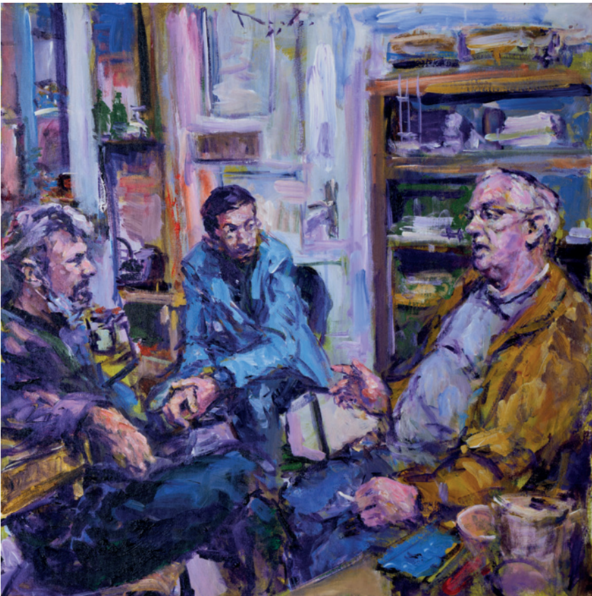
Miro, Pero, Mario, 2020., akril na platnu, 80 × 80 cm