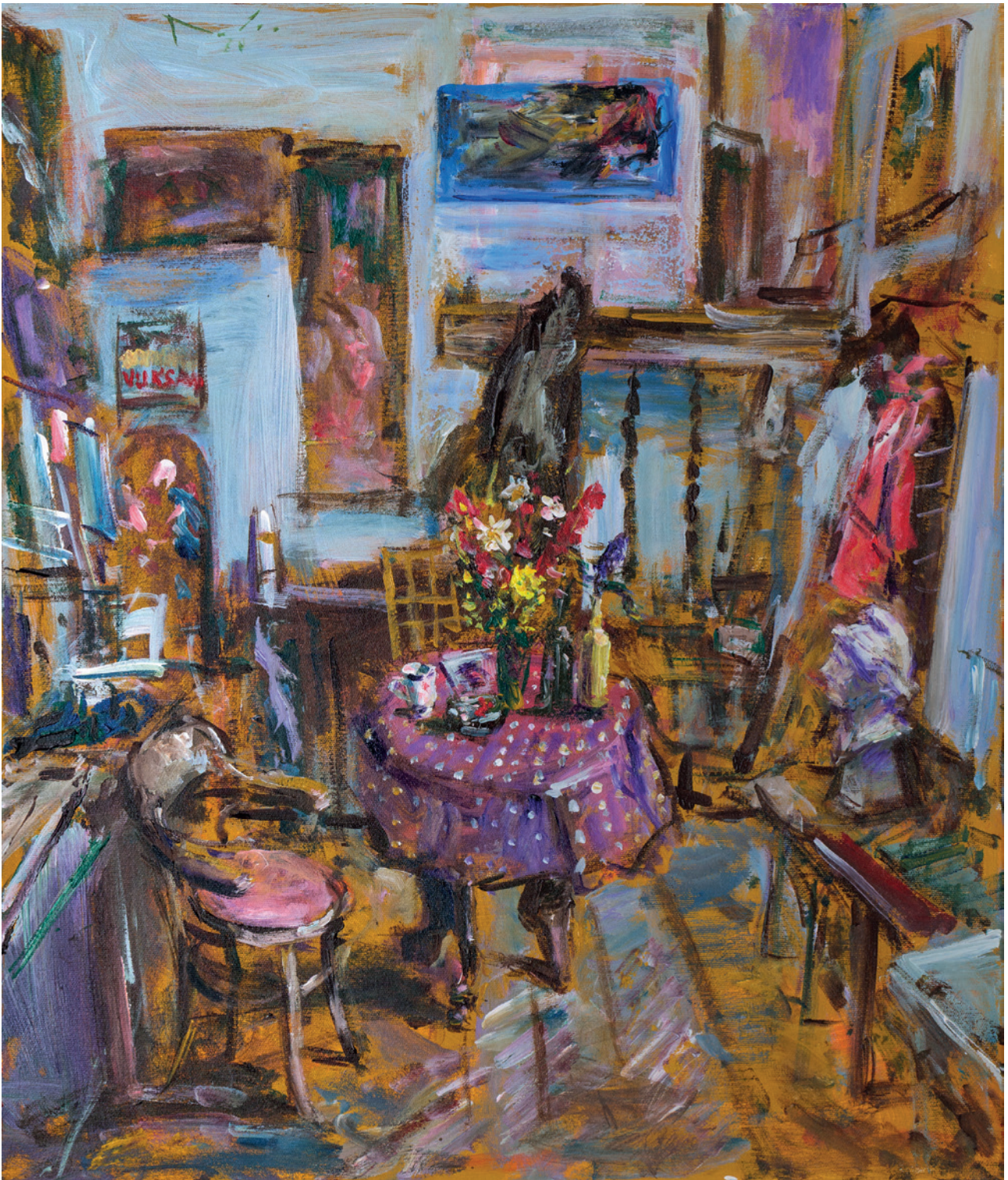
Interijer, 2020., akril na platnu, 80 × 60 cm