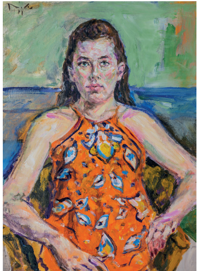
Mirta, 2021., akril na platnu, 70 × 50 cm

Radićevi motivi različite su inspiracije. Razumljivo, u komornosti ove izložbe predstavljeni su fragmentarno. No i dostatno za prepoznavanje Radićeva umjetničkog bioritma. Ali svakako vrijedi, bar "taksativno", spomenuti njegovu zaokupljenost širinom motiva – i krajolika i veduta, od rodne Hrvatske Kostajnice do Zagreba, mjesta kojima se istinski brojnim ciklusima odužio, s promjenama u kadriranju i rakursu, s naglascima na slikovitosti pejzaža ili trgovima, arhitekturi i spomenicima urbaniteta, te scenama iz svakodnevice života. Mitološke teme, prizori kršćanske ikonografije čine jezgru njegove figuracije složenog scenarija uz one jednostavnijeg postava – psihološko-realistične portrete i umjetnički intrigantne auto-portrete, koji zbog izuzetne brojnosti zaslužuju ulazak, da se malo našalimo, u knjige svjetskih rekorda.