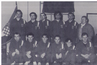
Sadašnjost HK "Sesvete"