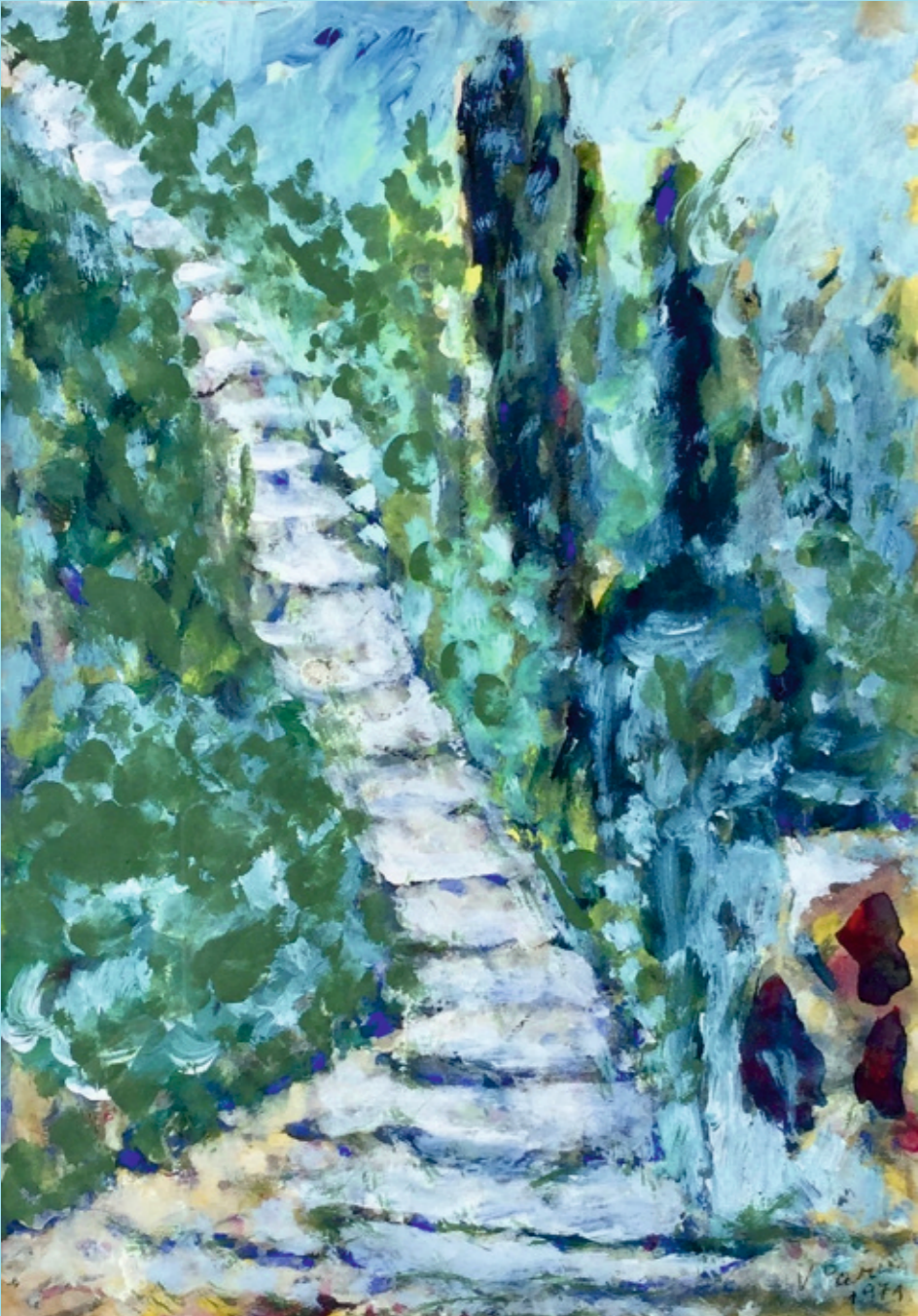
Silazak u Maslinicu (Šolta) tempera, 29 x 20 cm Muzej Prigorja 1971.