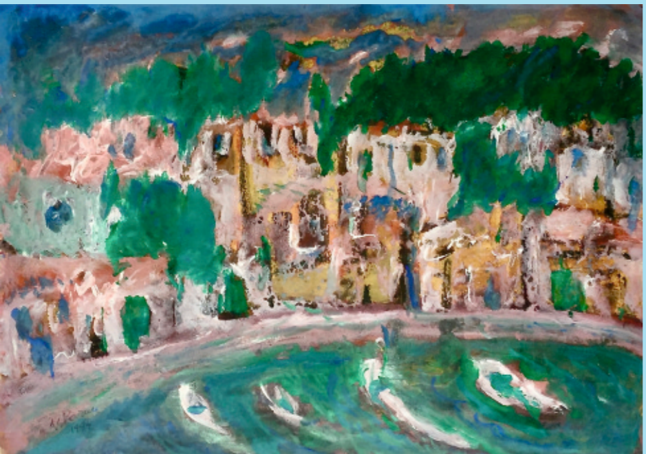
Zlarinska obala tempera, 28,5 x 40 cm Muzej Prigorja 1994.